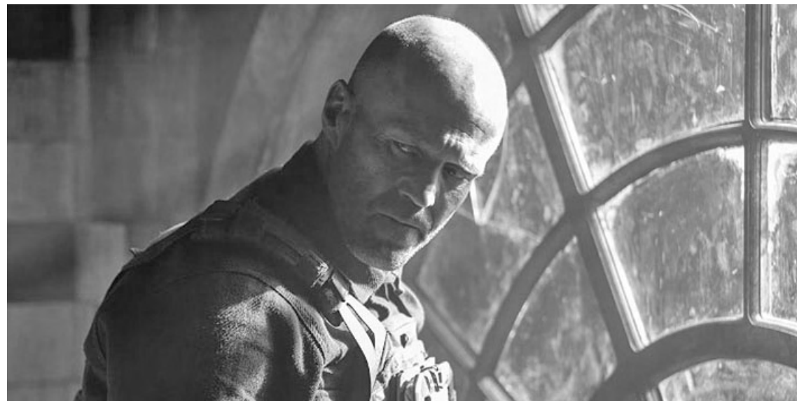
Jason Statham vuelve a hacer lo que mejor sabe en "Rescate implacable": repartir golpes y desafiar a criminales en una película de acción imparable.

El actor británico protagoniza la cinta dirigida por David Ayer, con guion de Sylvester Stallone. El miércoles 2 de abril será el preestreno de «Una película de Minecraft». Continúan en cartel: "Mufasa", "Blancanieves", "Aún estoy aquí" y "Presencia".