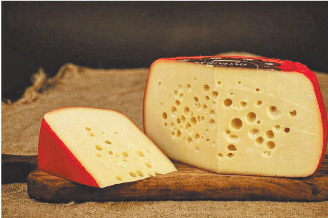
Queso Mar del Plata, una variante local de una tradicional receta holandesa.

A su vez, lo define como “tradicional, contemporáneo y viviente a un mismo tiempo”, y considera que “no es inmutable, se resignifica en diferentes procesos históricos y está sujeto al contexto, respondiendo a prácticas globales en constante cambio, lo que le exige adaptación permanente”.