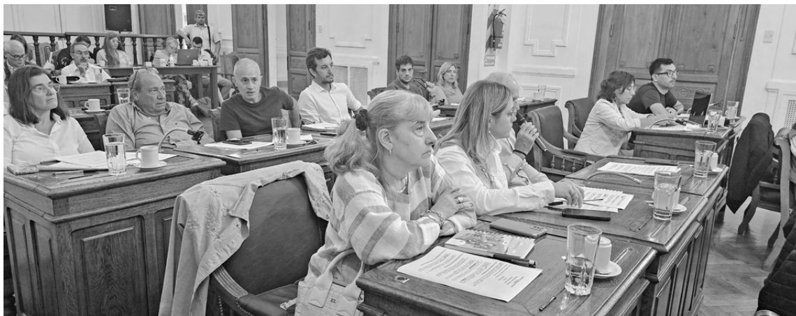
La Presa de Regulación del Arroyo Pergamino sigue siendo un tema de gran relevancia en la agenda del Concejo Deliberante.