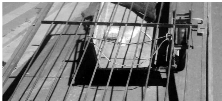
La reja sustraída la cargaron en un carrito y fueron interceptados.