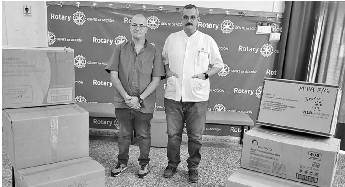
Son siete las cajas que contienen medicinas básicas por un valor total de 10 millones de pesos.

Los filántropos locales enviarán un cargamento valuado en 10 millones para asistencia de los damnificados de las inundaciones. El accionar se enmarca en la orientación que la institución local tiene en el área rotaria de 'Prevención y Tratamiento de enfermedades'.