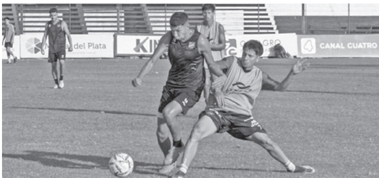
El plantel "Rojinegro" entrenará esta tarde de cara a su visita a El Linqueño.

Tras el empate 0 a 0 ante Gimnasia y Esgrima de Chivilcoy en el debut de local en el Torneo Federal A 2025, el plantel profesional de Douglas Haig regresó a los entrenamientos el martes en jornada desdoblada. Los que no fueron convocados en dicho compromiso, como también los que sumaron pocos minutos el domingo fueron citados a la mañana, en tanto que en horario vespertino estuvieron presentes todos los integrantes del plantel.