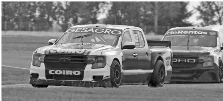
José Rasuk logró avanzar tres posiciones en su primera final en la categoría.

Y en el mediodía del domingo se llevó a cabo la final a 14 giros y el pergaminense pudo alcanzar un buen resultado al ver la bandera a cuadros en la sexta posición. Batalló durante toda la carrera con Hernán Sala y Tomás Pellandino entre otros pilotos que luchaban por mantenerse dentro del Top 10, y sobre el final aprovechó