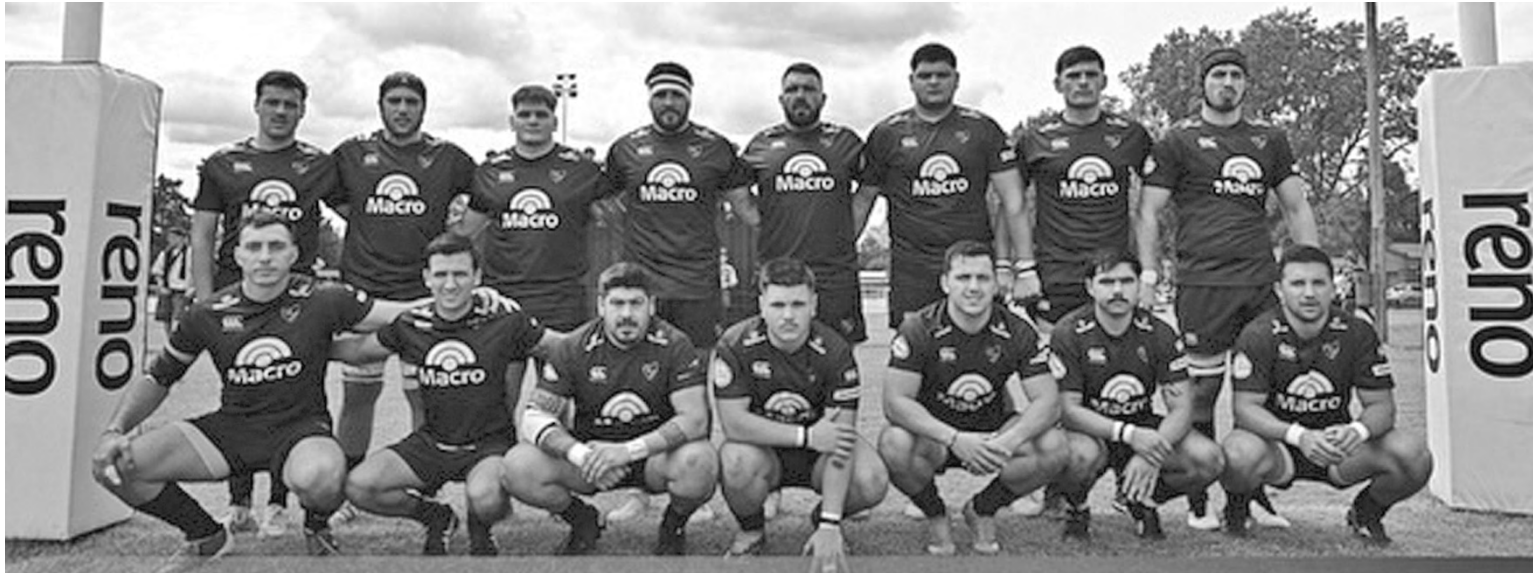
La Primera de Gimnasia y Esgrima ganó en Rufino en su segunda presentación en el Torneo local URR "Copa Santa Fe".

El "Lobo" triunfó 13 a 8 de visitante en la segunda fecha del Torneo local URR "Copa Santa Fe" y se recuperó de la caída en el debut frente a GER. En Intermedia la victoria fue para el equipo santafesino por 27 a 10. Mañana debutará en la Segunda División del Torneo Regional del Litoral, el principal objetivo del mens sana, ante Universitario de Rosario.