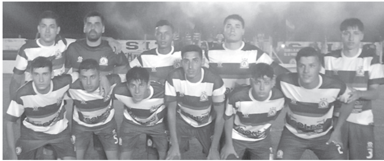
Leandro N. Alem buscará hacerse fuerte de local ante el líder Cusa de Salto.

Al cierre de esta edición, Racing recibía en su estadio del barrio