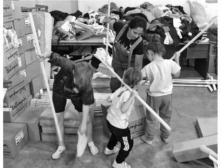
Los espacios elegidos para la asistencia fueron: General Daniel Cerri e Ingeniero White.

Un grupo de 10 voluntarios, conformado por las mujeres de Por una Sonrisa Pergamino y los payasos de "Por teléfono", retornaron el lunes desde Bahía Blanca, luego de un fin de semana cargado de actividad solidaria ya que no solo repartieron las numerosas donaciones que los pergaminenses hicieron, y que fueron transportadas en un camión de la firma Metalsol, sino también desplegaron una labor de contención, acompañamiento y asistencia a las cientos de familias afectadas por la última inundación.