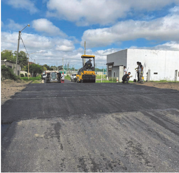
La pavimentación favorece el tránsito diario de los vecinos.