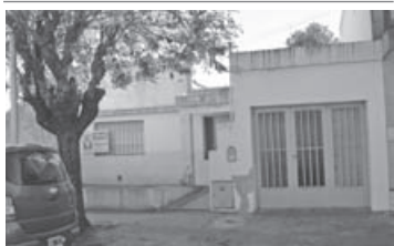
SAN LUIS 850: Casa para reciclar, lote 9,66 x 34, 2 dorm, garage. U$S 45.000