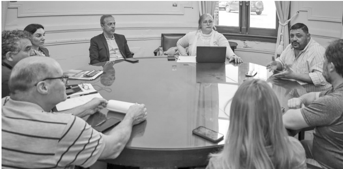
Representantes gremiales y autoridades municipales llegaron a un acuerdo salarial para los empleados comunales.

El Ejecutivo y los gremios municipales sellaron un incremento del 4% sobre los haberes y el mismo eleva la suba anual al 19,7%. El acuerdo, que homologado en el Ministerio de Trabajo, prevé otra reunión en noviembre para evaluar la evolución inflacionaria