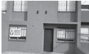
J. Newbery 2181: 3 dorm, 2 baños, liv-comed, estar diario, amplio jardín.