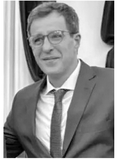
Juez Ignacio Uthurry.

El Tribunal Oral en lo Criminal N° 1 la sentenció a un año y tres meses de prisión por las dosis de drogas que le secuestraron durante un operativo en la ruta 8. La sentencia tuvo en cuenta los chats enviados cuando era menor de edad con atenuantes.