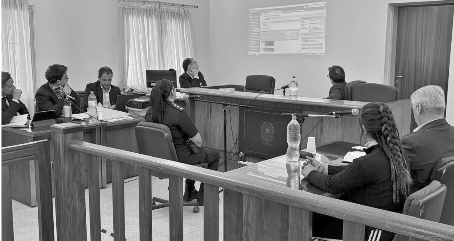
La joven de Colón durante la audiencia en el Tribunal Oral en lo Criminal N° 1.