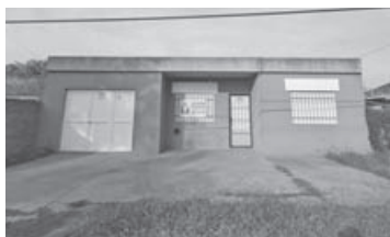
R. Raimundo 1780: 3dorm, 2baños, liv, coc-comed, garage, amplio jardín.