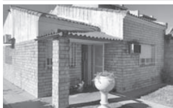
G. Colodrero 860: Terr 10 x 40, casa 2 dorm, liv-com, coc, garage, jardín. U$S 65.000.

Saavedra 309 - Teléfono fijo 428631 ó 414849 - Celular 2477-688875