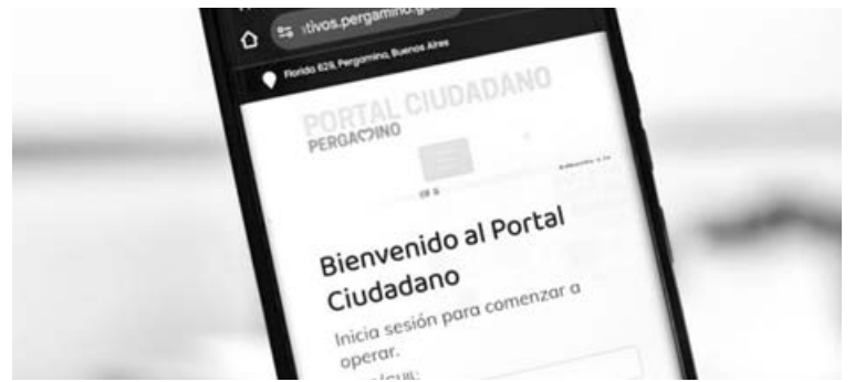
Este Portal propone un entorno personalizado en el que cada usuario puede configurar su panel de inicio.

Portal Ciudadano de la Municipalidad de Pergamino se consolida como una herramienta fundamental en el proceso de modernización del Estado local, acercando de esta manera la gestión pública a los vecinos a través de soluciones tecnológicas simples, accesibles y eficientes.