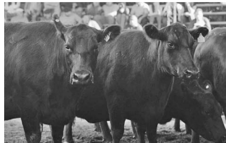
No es la suba mensual lo que más se destaca, sino la trayectoria que vienen mostrando los precios a lo largo del año.

La cría en su mejor momento Según el informe del Rosgan de la Bolsa de Comercio de Rosario, si nos enfocamos exclusivamente en el precio de los bienes, podemos afirmar que la cría atraviesa uno de sus mejores momentos de los últimos años, no solo por los