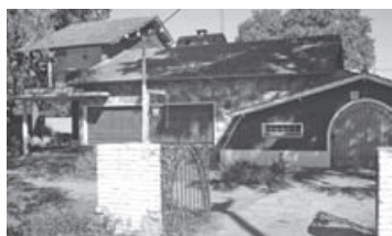
Ruta 188 Cruce: casa 400 m2 cub, 4 dorm, baño, living-comed, pileta.