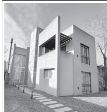
CASA EN CLUB SIRIO 4 DORMITORIOS. Y DEPENDENCIAS MUY BUENA ORIENTACIÓN