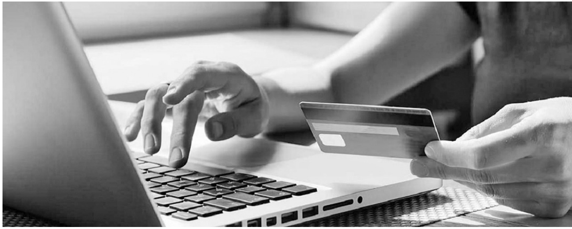
Los estafadores ingresaron al home banking para realizar operaciones.

Los integrantes de una organización criminal ingresaron al home banking y desarrollaron operaciones fraudulentas por más de 4,7 millones de pesos. La víctima aportó las capturas de pantallas de las distintas defraudaciones dentro de su entorno bancario.