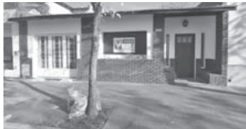
3 de Febrero 1076: 2 dorm, 3 baños, liv, coc-comed, garage, patio.