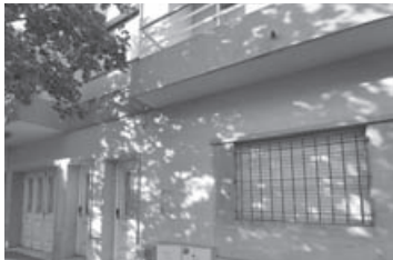
Florida 44: 2 dorm, baño, liv, comed, coc, garage, amplio jardín.