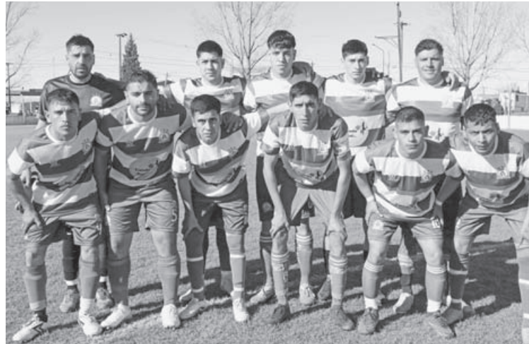
Racing se medirá esta tarde con Alem en el barrio 12 de Octubre en el partido que marcará la continuidad de la tercera fecha de la rueda de interzonales.