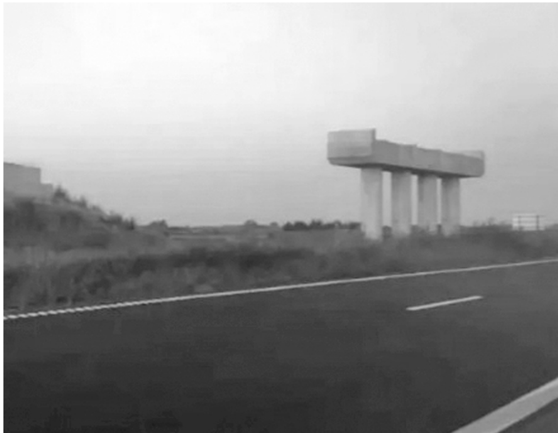
La obra fue paralizada totalmente y los vecinos de Urquiza no tienen respuestas sobre el futuro en esa zona de la Autopista.

En la actualidad, la situación no muestra señales de avance. Los vecinos denuncian que la falta de un distribuidor seguro obliga a realizar desvíos peligrosos y extensos para ingresar o salir de la localidad, generando riesgos viales y dificultades logísticas.