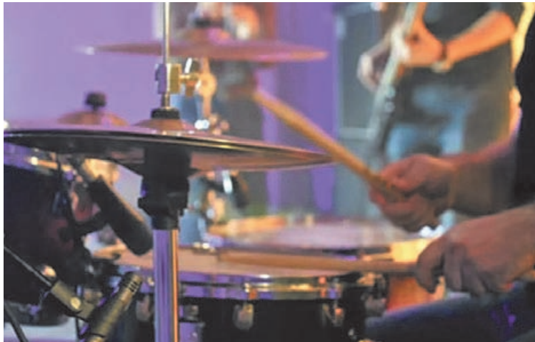
Será una verdadera exhibición de técnica, creatividad y pasión por el ritmo.