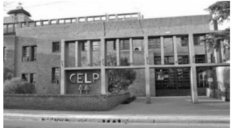
Desde la Cooperativa Eléctrica de Pergamino mostraron preocupación por el robo de los cables.

La problemática del robo de cables volvió a registrarse en Pergamino y en esta ocasión afectó a la zona oeste de la ciudad. Según informaron desde la Cooperativa Eléctrica de Pergamino, en los últimos días se produjeron tres hechos consecutivos que generaron inconvenientes en el suministro eléctrico y en los servicios vinculados.