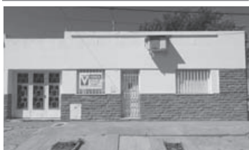
Guido 856: 2 dorm, liv, coc-comed, garage p/2 autos, amplio jardín.