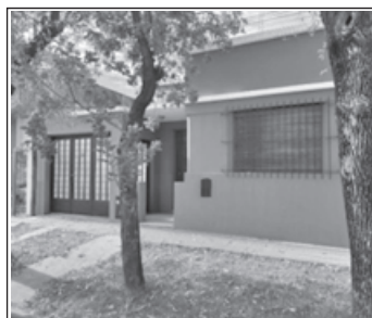
CASA EN CALLE BOLIVIA 217