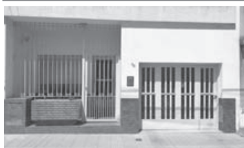
Rivadavia 752: 3 dorm, liv-comed, coc, baño, garage, amplio jardín.