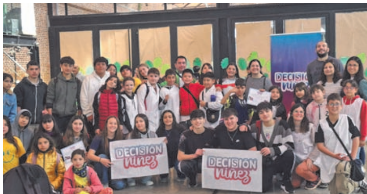
Los proyectos ganadores en Pergamino y Colón fueron presentados por chicos de entre 8 y 17 años. (DECISION NIÑEZ)

días pasados en el Centro Cultural Bellas Artes de Pergamino, en una jornada que estuvo cargada de entusiasmo y compromiso. La Directora Provincial de Promoción y Fortalecimiento Comunitario, Tamara Perini, acompañó el encuentro y destacó la importancia de dar voz y voto a los más jóvenes en políticas públicas.