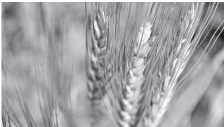
La baja movilidad del zinc en el perfil del suelo convierte a la reposición en una inversión estratégica.

Los datos surgen de un relevamiento realizado por la Unidad Integrada Balcarce -Buenos Aires-, que muestra una disminución significativa en los niveles disponibles de zinc en el suelo. Según el análisis, un 33 % de los lotes analizados en el sur bonaerense presentan concentraciones por debajo de 0,80 partes por millón (ppm), nivel de Zn que podría limitar el rendimiento de trigo y cebada. Esta tendencia marca un retroceso en comparación con los registros de 2011, cuando los valores en la zona eran predomi-