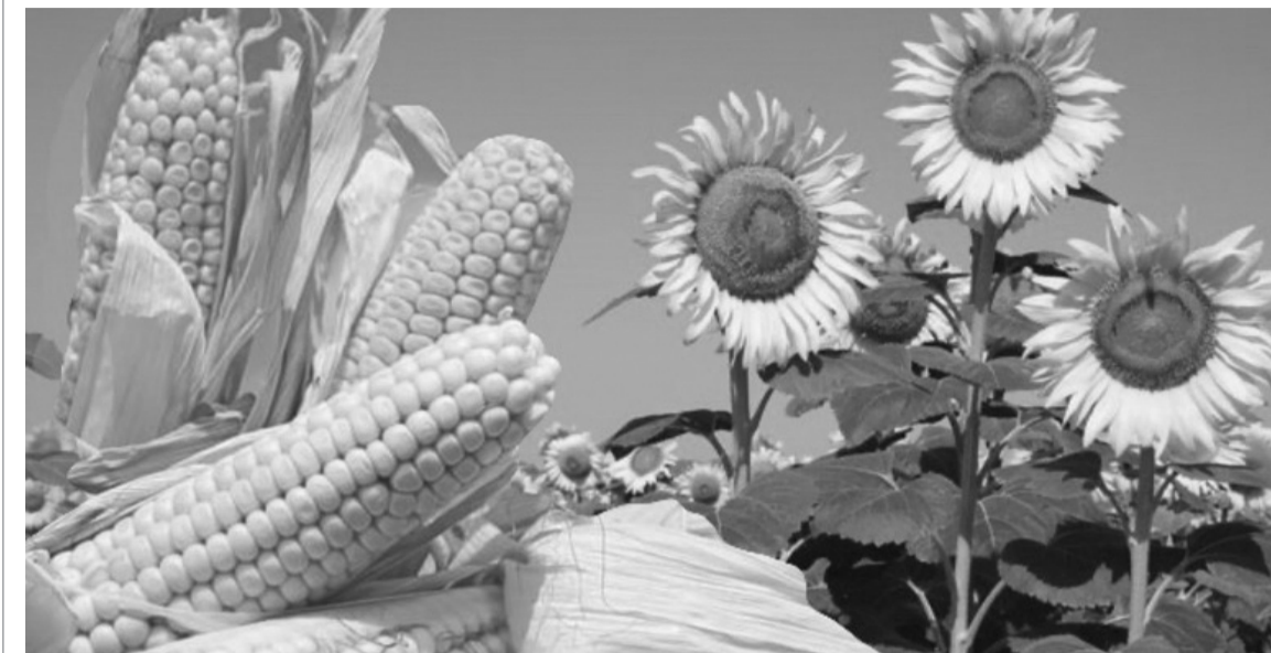
Por una serie de factores, la soja le va dejando espacio al maíz y el girasol.

La Bolsa de Cereales de Buenos Aires presentó su informe de precampaña de soja, en el que estima que se sembrarán 17,6 millones de hectáreas en el ciclo 2025/26. El número representa una caída interanual del 4,3%, equivalente a 800.000 hectáreas menos frente al ciclo previo, cuando se alcanzaron 18,4 millones, la mayor superficie de las últimas cinco campañas. “Se proyecta una caída interanual en la superficie destinada a la oleaginosa, aunque el área se mantendría como la segunda más elevada de los últimos cinco ciclos y superaría el promedio del mismo período (17 millones de hectáreas)”, destacó la entidad. La reducción responde principalmente a una menor intención de siembra de soja de primera, desplazada por maíz y girasol.