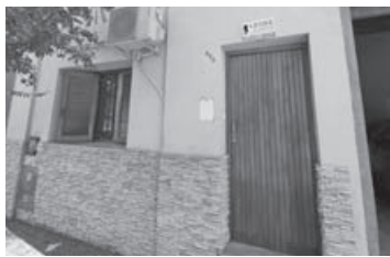
Ecuador 454: 2 dorm, liv-comed, coc, baño, patio pequeño.