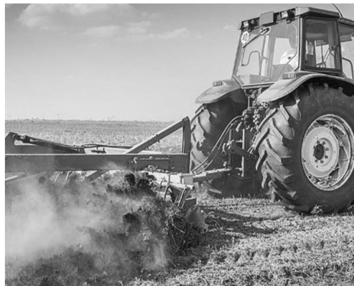
La labranza ocasional puede ser un recurso puntual, pero no reemplaza la necesidad de un manejo integrado.

El resultado fue concreto: la cantidad de semillas de malezas en superficie fue similar a la de los lotes sin labranza, pero la composición cambió.