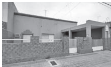
Catamarca 253: 2 dorm, liv, comed, coc, entrada para auto, amplio jardín.