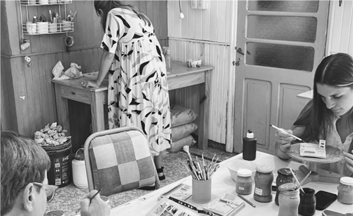
Este viernes en Centro Cultural Registrarte inaugura la muestra de cerámica del Taller Boga. (NATALIA TEALDI)

Junta Centro Cultural Pink Dragon Polestudio Este viernes en Junta Centro Cultural hará su muestra de cierre de año Pink Dragon Polestudio, a cargo de Majo Gouna. "Compartí con nosotros el cierre del trabajo de este año", anuncian en sus redes sociales. 9 de Julio 682, a las 19:30. Bufet a cargo del espacio. Anticipadas al 2477 318098. Instagram: @juntacentrocultural