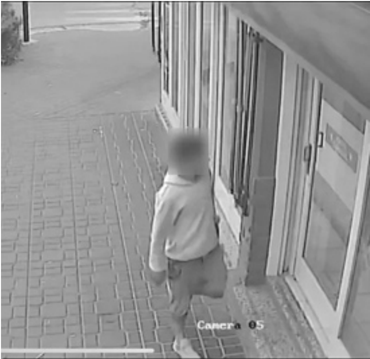
Las cámaras de seguridad de la Heladería Grido lo filmaron ingresando.