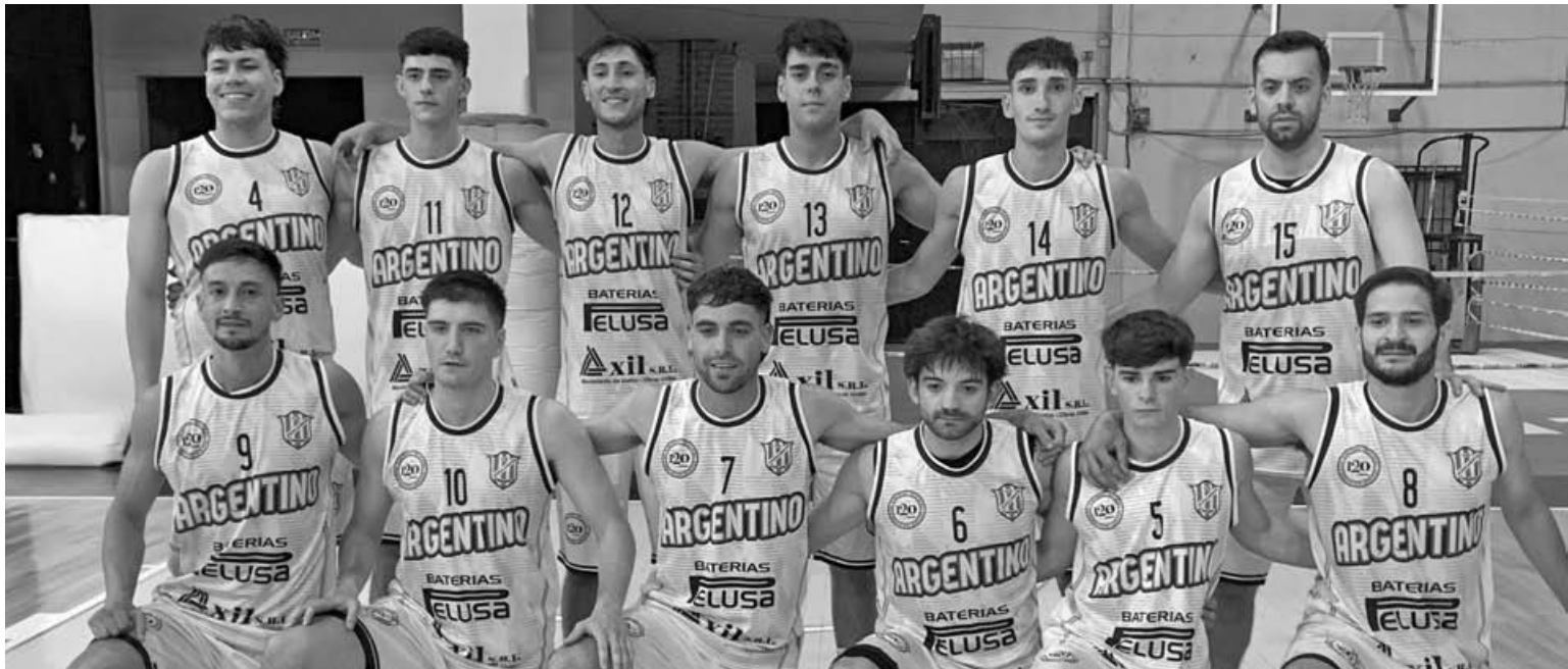
Argentino demostró esta temporada su jerarquía en el torneo de básquetbol local. Venció a “Comu” en las finales del Apertura, Clausura y Súper 4.

El “Blanco” se consagró campeón del básquet pergaminense por tercer año consecutivo al vencer 80 a 54 al “Cartero” y cerrar 2-0 la final del Clausura en el estadio “Pickle Gracia”. Con una actuación sólida desde el inicio, confirmó su dominio anual tras haber ganado también el Apertura. Sumó su título N° 26 en la APB, ampliando su liderazgo histórico.