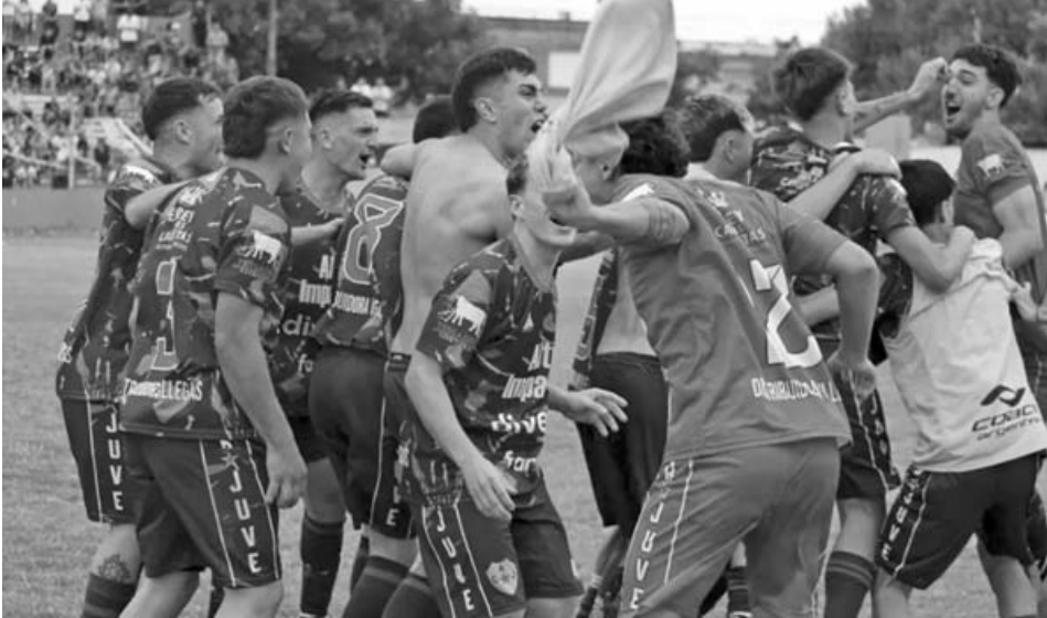
El plantel de Juventud celebrando en el “Fernando Bello” la obtención del título luego de imponerse por penales ante Argentino de Alfonso, que se quedó con el subcampeonato.