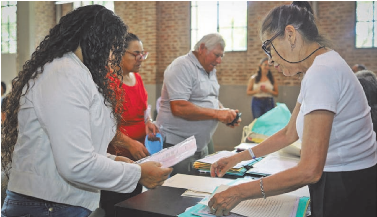
Ayer se llevó a cabo un nuevo operativo para firmas de protocolos y nuevas escrituras sociales. (LA OPINION)

El operativo tuvo una dinámica que ya se ha vuelto habitual en la ciudad, pero que conserva su peso simbólico y social en cada edición: vecinos que durante años habitaron sus viviendas con la sola posesión jurídica se acercan a completar el proceso que les otorgará el pleno dominio del inmueble. PAGINA 3