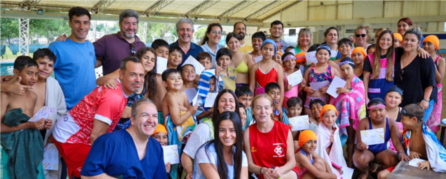
“Vuelta al agua” nació con el propósito de generar inclusión, nivelar oportunidades y promover hábitos saludables a través de la natación.

Un programa que incluye y acompaña “Vuelta al agua” nació con el propósito de generar inclusión, nivelar oportunidades y promo-