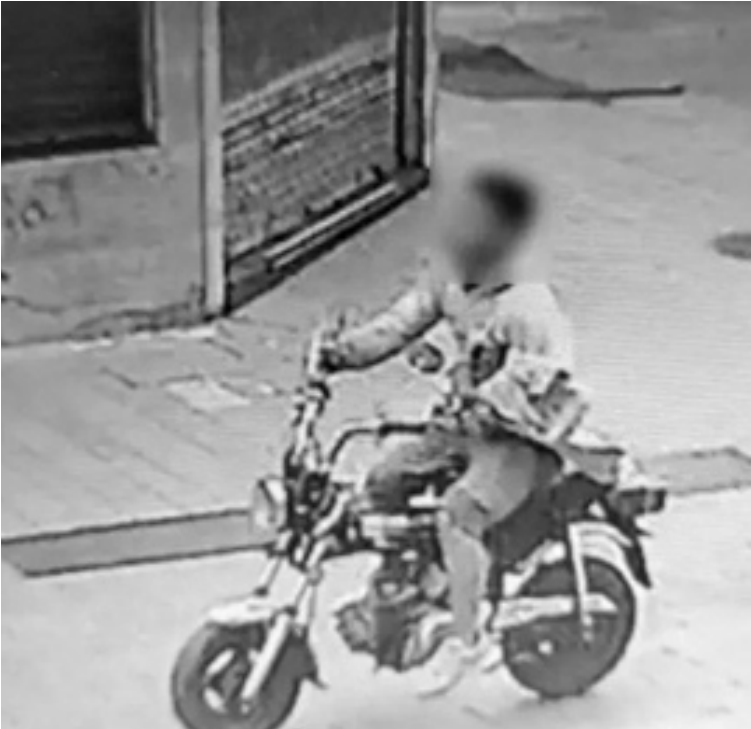
El menor sustrajo una moto de un local y escapó montado al rodado.

Se trata de un adolescente de 16 años con una grave problemática de consumo que protagonizó una seguidilla de episodios delictivos en comercios de la zona céntrica. Hoy lo trasladarán desde un centro de contención juvenil de San Nicolás para comparecer ante el Juzgado de Garantías del Joven en la audiencia de prisión preventiva.