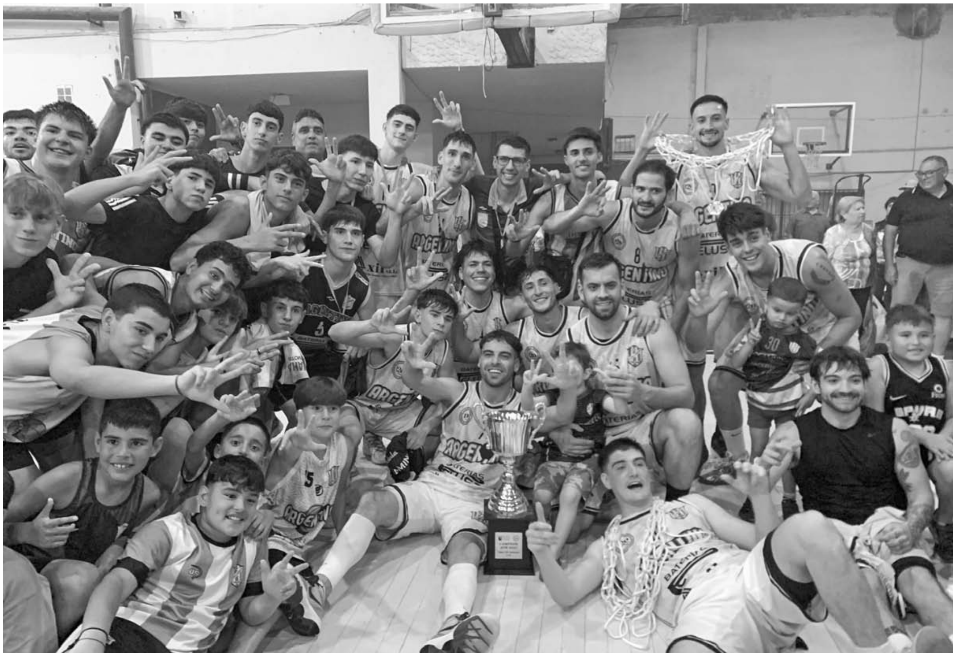
El plantel de Argentino festejando el tricampeonato de la Asociación Pergaminense de Básquetbol (APB) junto a sus hinchas. Ratificó su dominio en el certamen local.

El “Blanco” se consagró campeón del básquet pergaminense por tercer año consecutivo al vencer 80 a 54 al “Cartero” y cerrar 2-0 la final del Torneo Clausura en el estadio “Andrés ‘Pickle’ Gracia”. Con una actuación sólida desde el inicio, confirmó su dominio anual tras haber ganado también el Apertura. Sumó su título N° 26 en la APB, ampliando su liderazgo histórico. PAGINA 3