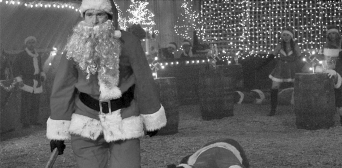
Este viernes llega a Cinema Pergamino el estreno de Noche de paz, noche de muerte, el esperado remake del clásico de terror.

Noche de paz, noche de muerte llega como gran estreno, Avatar: Fuego y Cenizas anticipa su preestreno exclusivo, y continúan en cartel Five Nights at Freddy's 2 y Zootopía 2, completando una semana llena de terror, fantasía y aventuras en Cinema Pergamino.