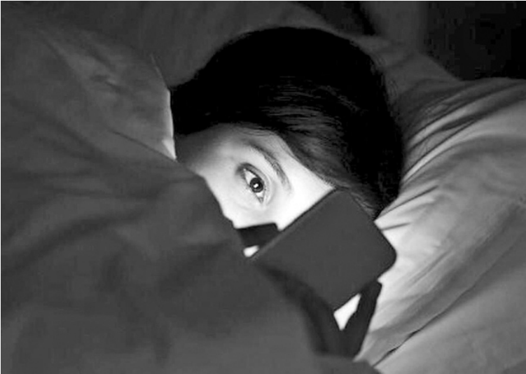
El su nocturno de pantallas provoca déficit del sueño en adolescentes.

El Defensor del Pueblo Adjunto General de la Provincia de Buenos Aires, Walter Martello, expuso cifras preocupantes que vinculan el déficit crónico de sueño con el uso nocturno de pantallas en jóvenes. El informe, un estudio preliminar conjunto entre el Observatorio de Adicciones y Consumos Problemáticos de la Defensoría y la Dirección de Prevención de Adicciones de la Universidad Nacional de La Plata (UNLP) sobre 350 casos, revela: -Déficit crónico de sueño: un 45.6% de los adolescentes duerme menos de 7 horas entre semana, lo que representa una privación crónica significativa. -Influencia tecnológica nocturna: el 87.4% de los encuestados reporta quedarse hasta tarde utilizando tecnología (frecuente o algunas veces). -Uso de redes sociales: el 57.9% utiliza activamente redes sociales como TikTok o Instagram después de las 11 p.m., impactando directamente en la hora de conciliar el sueño. Cuidar el sueño En el marco del “Quinto Encuentro: Salud mental y jóvenes”, Martello expuso la necesidad de reconocer el sueño como un pilar