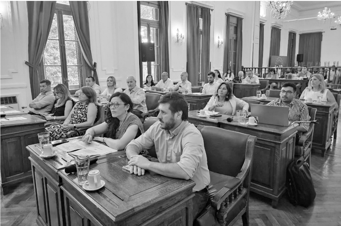
La sesión inició con el tratamiento sobre tablas del proyecto de ordenanza de modificación presupuestaria del Concejo.