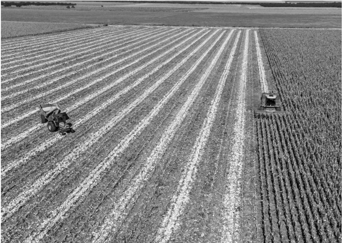
La medida apunta a mejorar la competitividad de la agroindustria, sector que concentra cerca del 60% de las exportaciones argentinas. (RURAL AL DIA)

El intendente municipal apoyó la baja de retenciones anunciada por Luis Caputo y destacó que aliviar al campo impulsa el crecimiento de Pergamino y el interior productivo. El interior productivo es el motor silencioso del país: cuando se alivian cargas al que produce, se activa el comercio, el transporte, la industria y las oportunidades para miles de familias”, agregó.