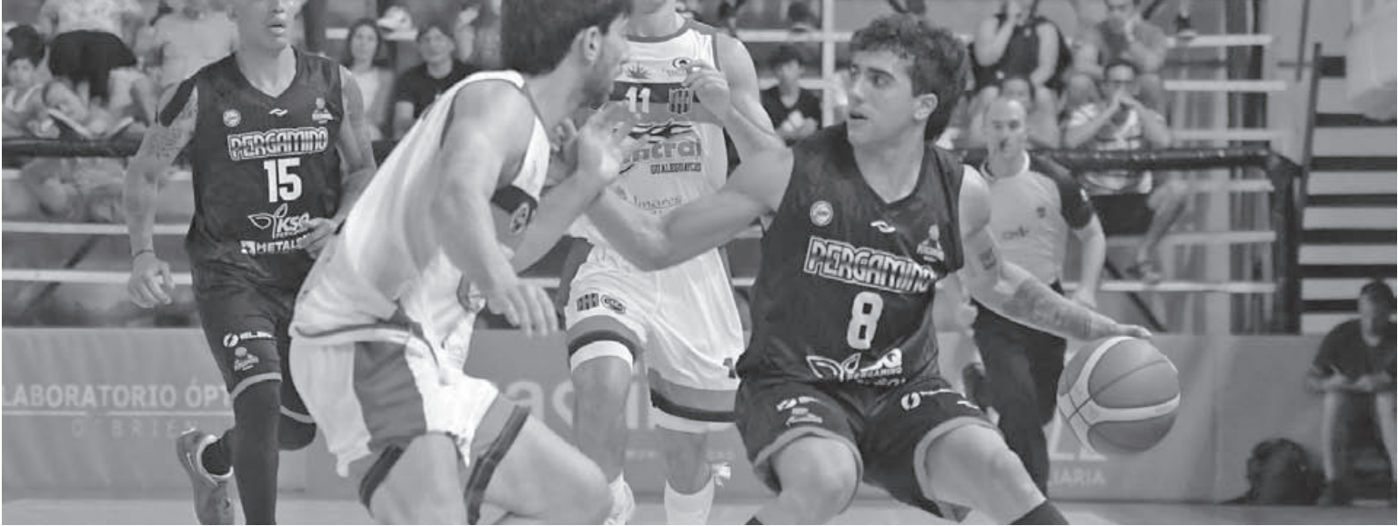
El equipo de la ciudad no pudo festejar su quinto triunfo en casa en la Liga Argentina 2025/2026. Mañana visitará a Gimnasia de La Plata.

Perdió 72 a 71 en un final muy cerrado y dejó pasar la chance de obtener su segundo triunfo consecutivo en la Liga Argentina 2025/2026. El equipo de la ciudad, que venía de vencer a Rocamora, no pudo sumar otra victoria y quedó con récord de 4-7. Mañana visitará a Gimnasia de La Plata, en busca de la recuperación.