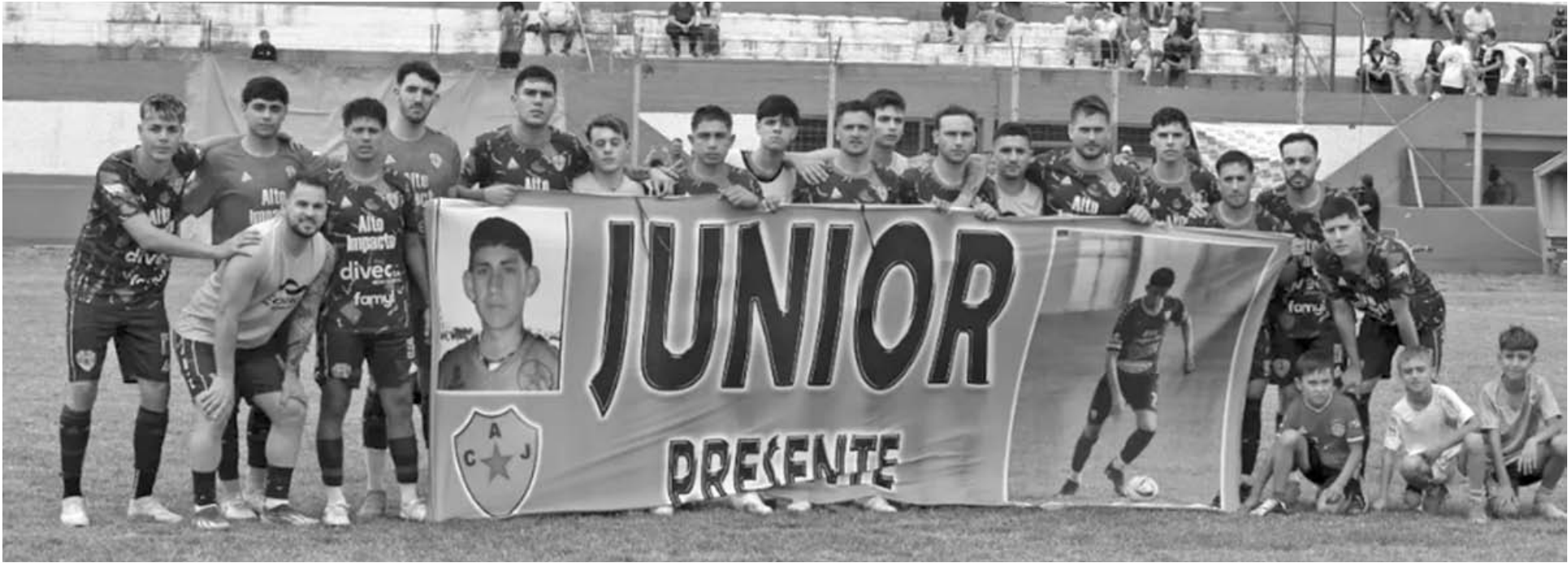
Juventud campeón 2025 de la Liga de Pergamino. El “Celeste” se coronó por decimocuarta vez como el mejor del fútbol pergaminense, sumando así una nueva estrella. (@JUVE.FUTBOL)