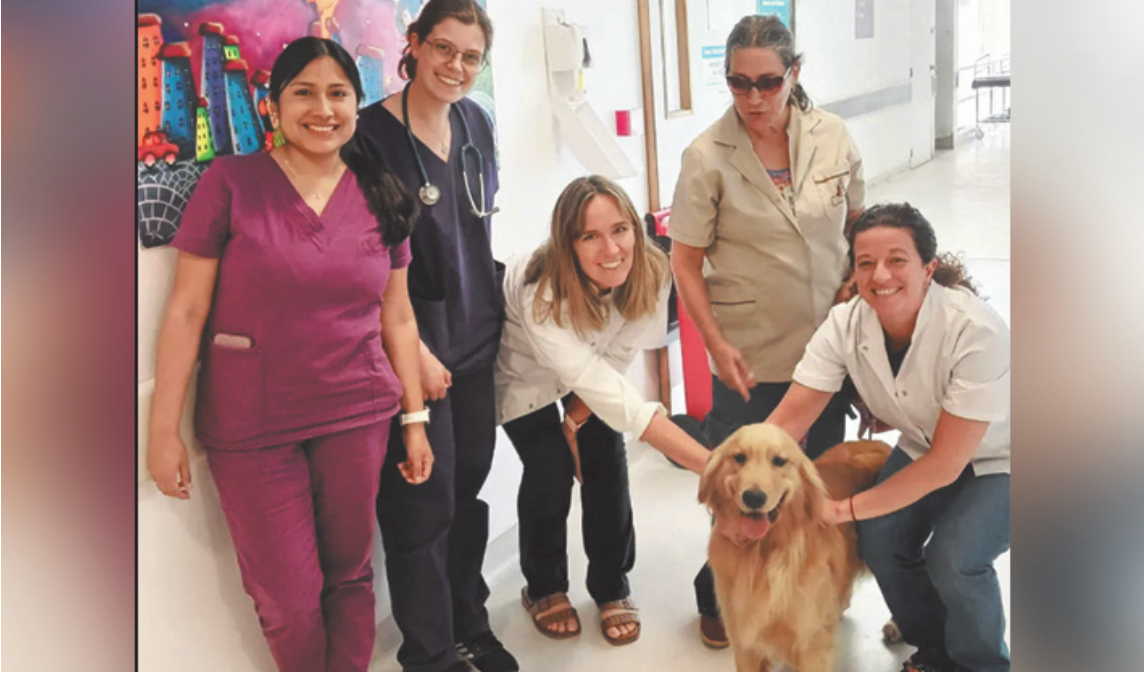
Saru y Cora, dos golden retrievers de tres años que protagonizaron la primera experiencia de intervención asistida con animales dentro del hospital.