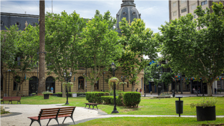
En la primera etapa se trabajará sobre temáticas vinculadas al desarrollo social, poniendo el foco en áreas como el deporte, la accesibilidad y la educación. (LA OPINION)

El proyecto surge del trabajo conjunto de la coordinación de Gobierno Abierto y del equipo de Datos Abiertos del Municipio, que desde hace meses desarrollan un sistema orientado para transformar la manera en que los vecinos se involucran en los asuntos públicos.