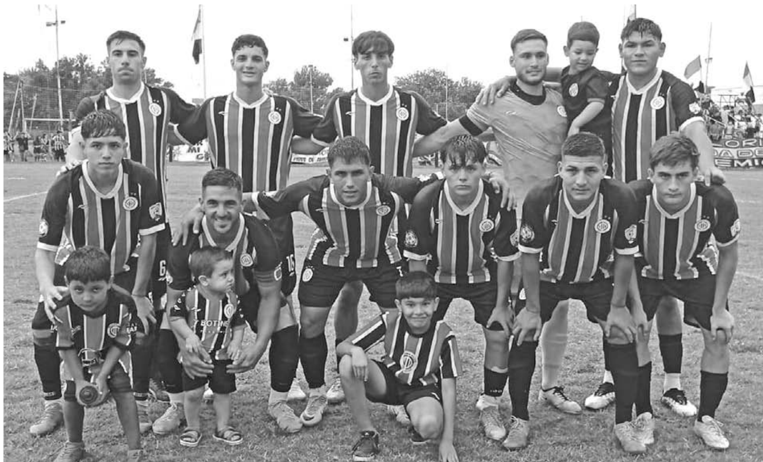
Racing Club avanza. Se metió entre los ocho mejores equipos de la Región Bonaerense Pampeana Norte y ahora enfrentará a Colón de Chivilcoy.

El “Bohemio” igualó 1 a 1 ante Compañía de Salto en el estadio “Carlos Morales” y, gracias al triunfo conseguido como visitante en el partido de ida, logró el pase a los cuartos de final de la Región Pampeana Bonaerense Norte del Torneo Regional Federal Amateur. Con orden, personalidad y el respaldo de su gente, el equipo supo administrar la ventaja y ratificó su buen presente en el certamen. El próximo rival será Colón de Chivilcoy.