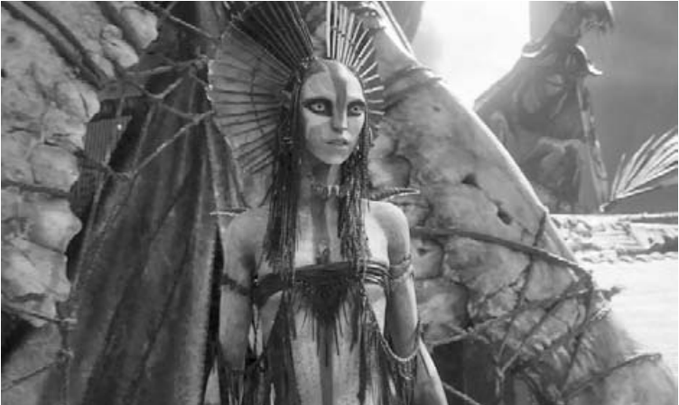
Continúa en cartel la tercera entrega de la saga Avatar.