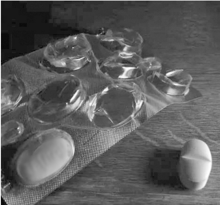
El paracetamol es de venta libre y ampliamente utilizado como analgésico. (LA CAPITAL)

En Rosario crece la preocupación por un reto viral que se expandió entre adolescentes a través de TikTok y otras redes. La consigna es alarmante: consumir en simultáneo un blíster completo de paracetamol de un gramo para “medir resistencia” a la sobredosis. Ya se registraron jóvenes hospitalizados en la ciudad. El desafío propone dos variantes: gana quien ingiere más pastillas antes de ser internado o quien permanece menos tiempo en observación. Casos similares se detectaron en Europa y Estados Unidos a mediados de 2025 y, recientemente, en Argentina.