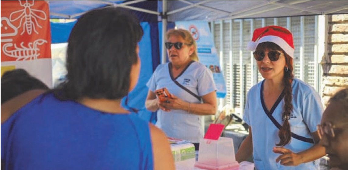
La Muni en tu Barrio continúa con su recorrido por diferentes puntos de la ciudad.

El área de Deportes difundió las distintas escuelas deportivas