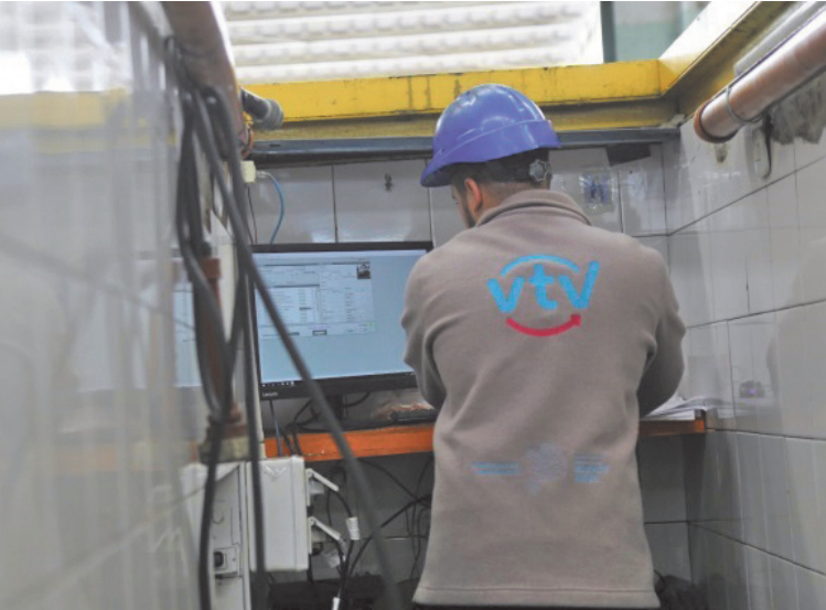
El aumento de la VTV vuelve a instalar el debate sobre el costo del mantenimiento obligatorio de los vehículos en un contexto económico complejo.

La actualización, que incluye a la planta Pergamino, impactará en todas las categorías de vehículos, desde autos particulares y motocicletas hasta unidades de mayor porte destinadas al transporte de cargas o pasajeros, y vuelve a poner en discusión el peso del trámite obligatorio en la economía cotidiana de los bonaerenses.