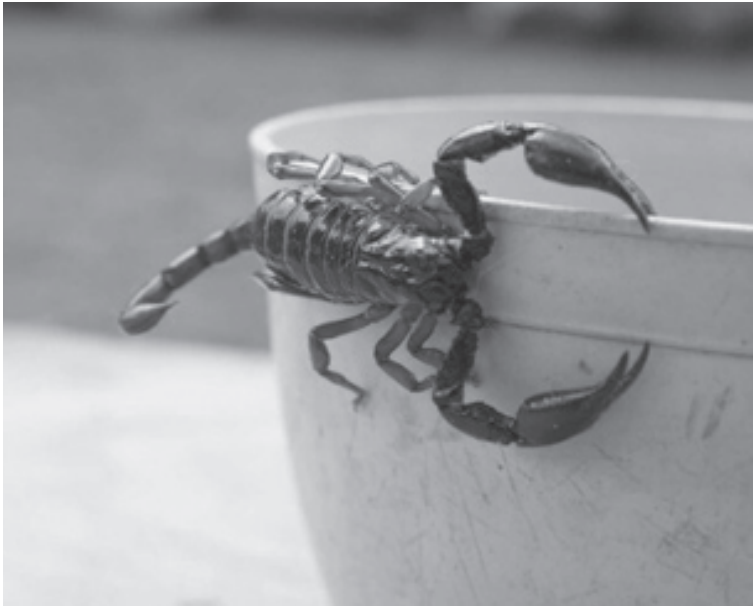
Los alacranes suelen habitar en lugares húmedos, oscuros y de escasa circulación, por lo que se recomienda extremar las precauciones.

Desde el Municipio de Pergamino y las autoridades sanitarias de la provincia de Buenos Aires señalaron que la situación actual no presenta variaciones significativas respecto de años anteriores, aunque reconocieron la preocupación creciente de los vecinos ante la detección de estos arácnidos en distintas zonas de la ciudad.