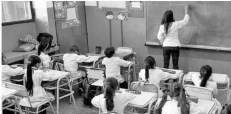
El receso invernal será del 20 al 31 de julio.