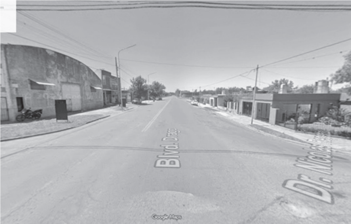
La víctima llamó al servicios de emergencias 911 e intervino la Policía. (LA OPINION)

Un comerciante fue abordado por dos delincuentes armados cuando llegaba a su domicilio de avenida Drago al 400. Bajo amenazas redujeron a su familia y escaparon con efectivo y pertenencias. El hecho es investigado por la Fiscalía N° 2.