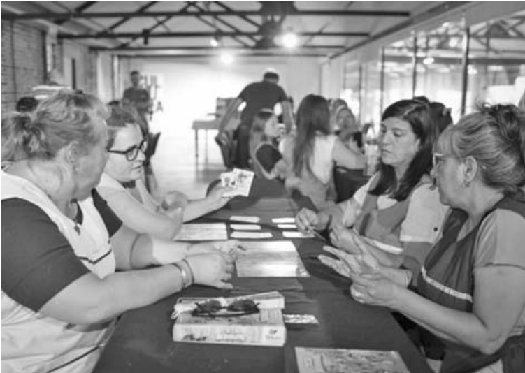
Del encuentro participaron coordinadores de los CDC, directivos y referentes barriales.

Durante la jornada se presentó el juego educativo “Caza Residuos”, el cuarto desarrollo de la editorial Tëkun, diseñado para enseñar de manera lúdica la correcta gestión de los residuos, promoviendo prácticas como el reciclado, el compostaje, la reconversión y la restitución de materiales, con énfasis en el aprendizaje activo y la experiencia social del juego.