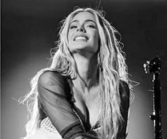
Tini, Duki y Lali Espósito encabezaron la lista de los artistas con mayor poder de convocatoria.