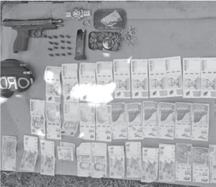
El sujeto iba al mando de un auto sin papeles, con una pistola y droga.

En la mañana de este martes, alrededor de las 11:00, personal policial del Destacamento Acevedo llevó adelante un procedimiento de control vehicular sobre la ruta nacional 188, a la altura de la localidad de Acevedo, en el marco de la Orden de Servicio Especial N° 389/25. Durante el operativo, los efectivos procedieron a detener la marcha de un automóvil Citroën C4, de color negro, que era conducido por un sujeto de 50 años. Según se informó, momentos antes el conductor habría intentado evadir el control policial y, al ser interceptado, no contaba con la documentación correspondiente del rodado. Al solicitarle que descendiera del vehículo, los uniformados constataron a simple vista la presencia de un arma de fuego tipo pistola, calibre 9 milímetros, ubicada sobre la butaca del lado del conductor. Ante esta situación, el sujeto fue trasladado junto al vehículo al Destacamento Acevedo. Ya en la dependencia policial,