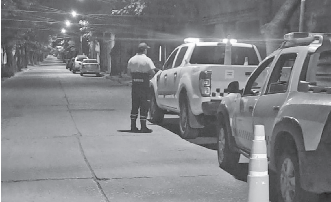
Uno de los controles de alcoholemia dio 2.62 en un conductor de automóvil.

En la madrugada del 25 no se registraron incidentes en nuestra ciudad. En el Hospital San José, si bien se advirtió un movimiento mayor en la Guardia, no se ha habido ingresos ni intervenciones de gravedad. Varios conductores dieron positivo de alcoholemia.