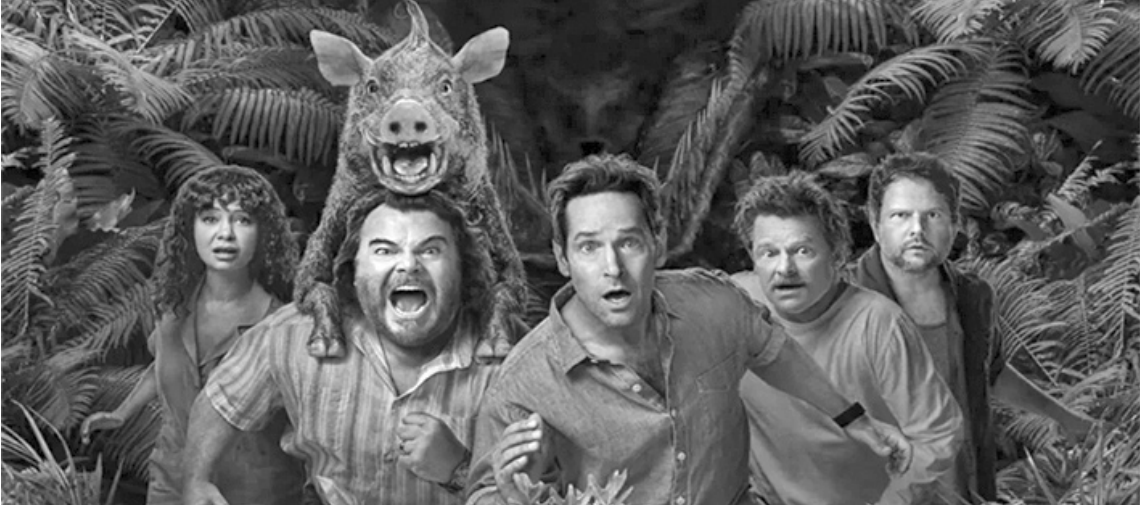
Los carismáticos actores Jack Black y Paul Rudd lideran el elenco de Anaconda.

Inspirada en el clásico de terror de 1997, la película está dirigida y coescrita por Tom Gormican, y reúne a Paul Rudd y Jack Black en los papeles principales, interpretando a dos amigos de toda la vida que buscan revivir su pasión por el cine, lo que los lleva a consecuencias peligrosas. A diferencia de la cinta original, esta nueva versión de Anaconda no es un remake tradicional. En vez de repetir la trama de la película de los años noventa, protagonizada por Jennifer Lopez y Owen Wilson, presenta a Doug (Jack Black), un videógrafo de bodas frustrado, y Griff (Paul Rudd), un actor secundario con sueños insatisfechos. Ambos, amigos inseparables desde la niñez, com-