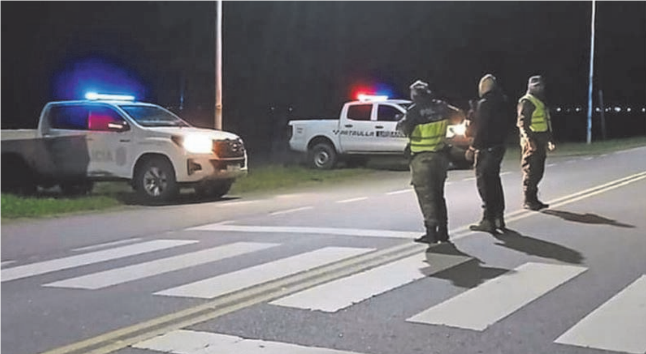
Las fuerzas de seguridad desplegaron operativos preventivos en los alrededores de fiestas juveniles.