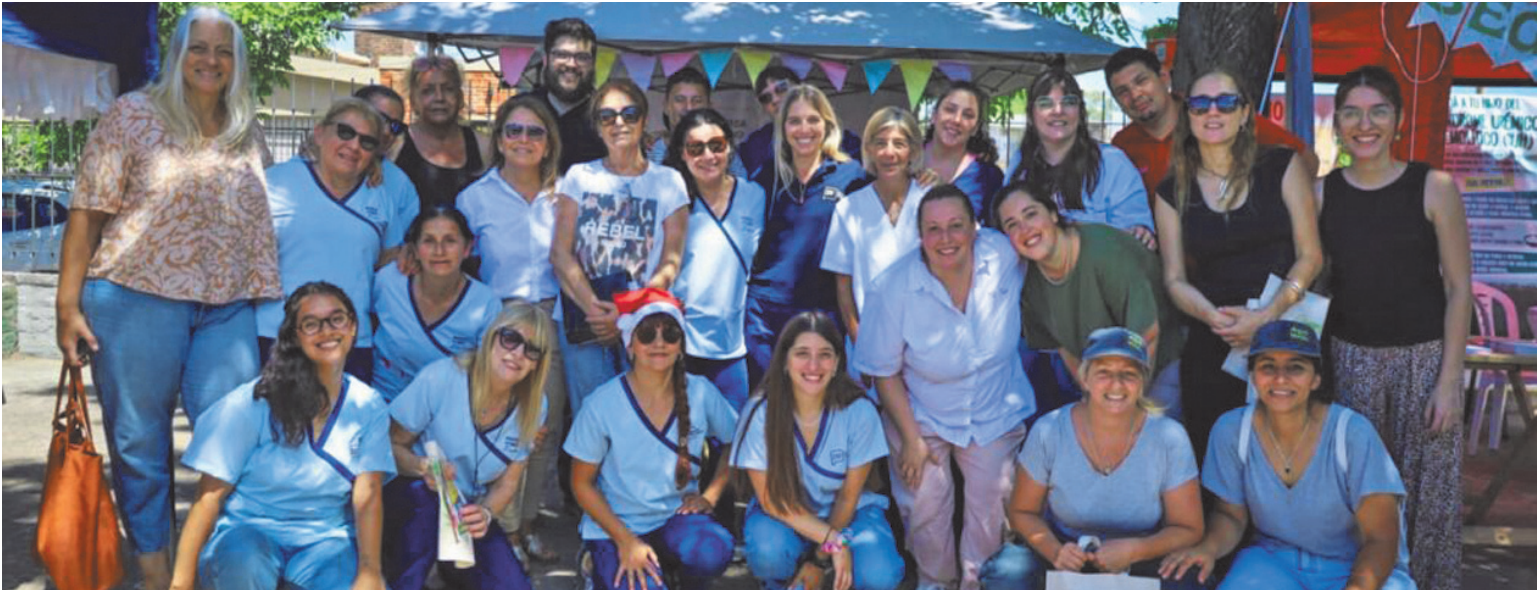
Diversas áreas del Municipio participaron con el objetivo de acercar servicios, facilitar trámites y fortalecer el vínculo con la comunidad.

En el plano social y comunitario, el área de Salud Mental desarrolló dinámicas grupales, con actividades coordinadas por el padre