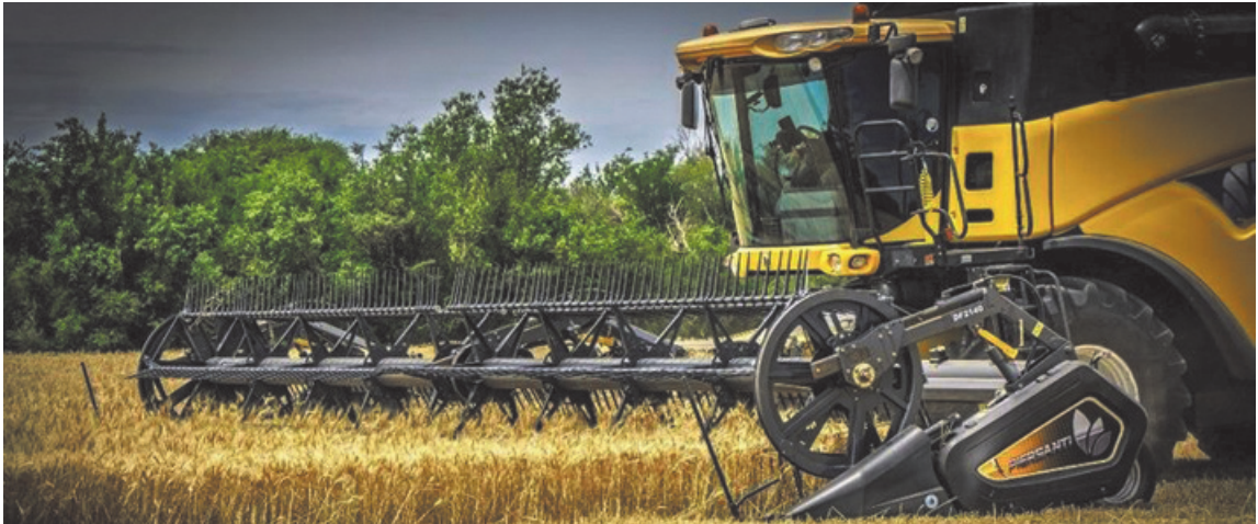
Fue una campaña que combinó superficie, manejo y condiciones ambientales en un equilibrio poco frecuente. (ARCHIVO)

Con rindes inéditos y un clima que jugó a favor, la campaña fina 2025/26 cerró como la mejor de la historia. Trigo y cebada no solo batieron récords productivos, sino que también prometen un fuerte aporte de divisas para la economía argentina. De acuerdo con estimaciones privadas y oficiales, el volumen total obtenido permitiría generar exportaciones por unos 4.700 millones de dólares