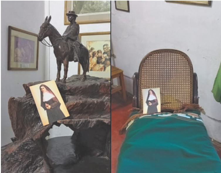
El recorrido comenzó en Villa Cura Brochero. Allí, Gael dejó imágenes de Crescencia. (GAEL MAJLUF)

Así, desde Pergamino hasta Córdoba, Crescencia volvió a caminar. Lo hizo sin ruido, con dulzura, llevada por las manos y el corazón de un adolescente que eligió creer, servir y anunciar que la santidad también se vive -y se transmite- en lo cotidiano.