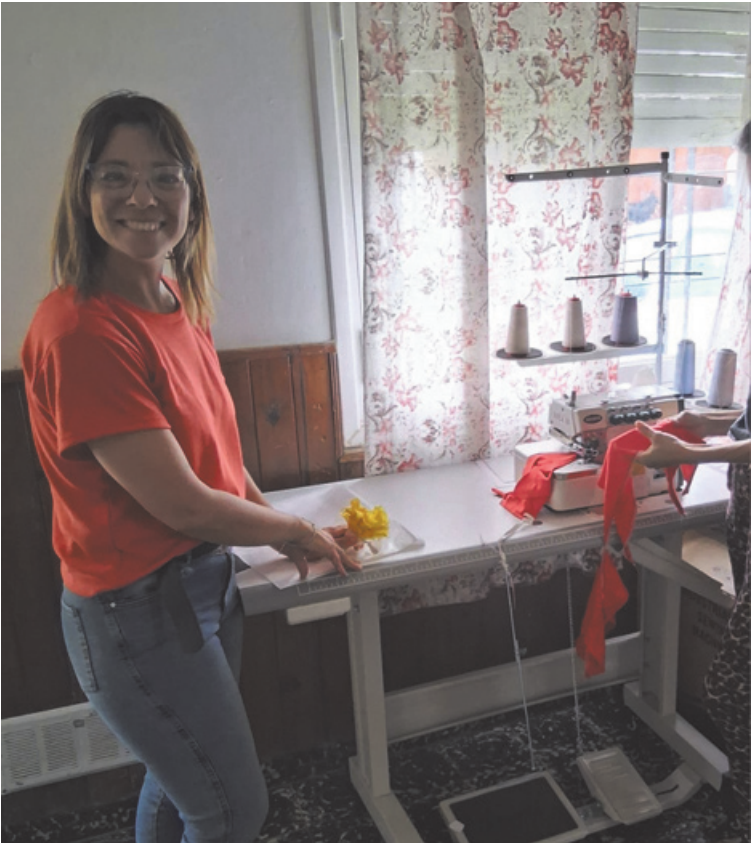
La titular de la Dirección de Asistencia a la Mujer hizo entrega de los insumos a las cuatro mujeres emprendedoras.

Uno de los ejes fundamentales del programa es la formación previa. Las mujeres seleccionadas debieron participar de una capacitación brindada por la Dirección de Empleo, que incluyó contenidos vinculados