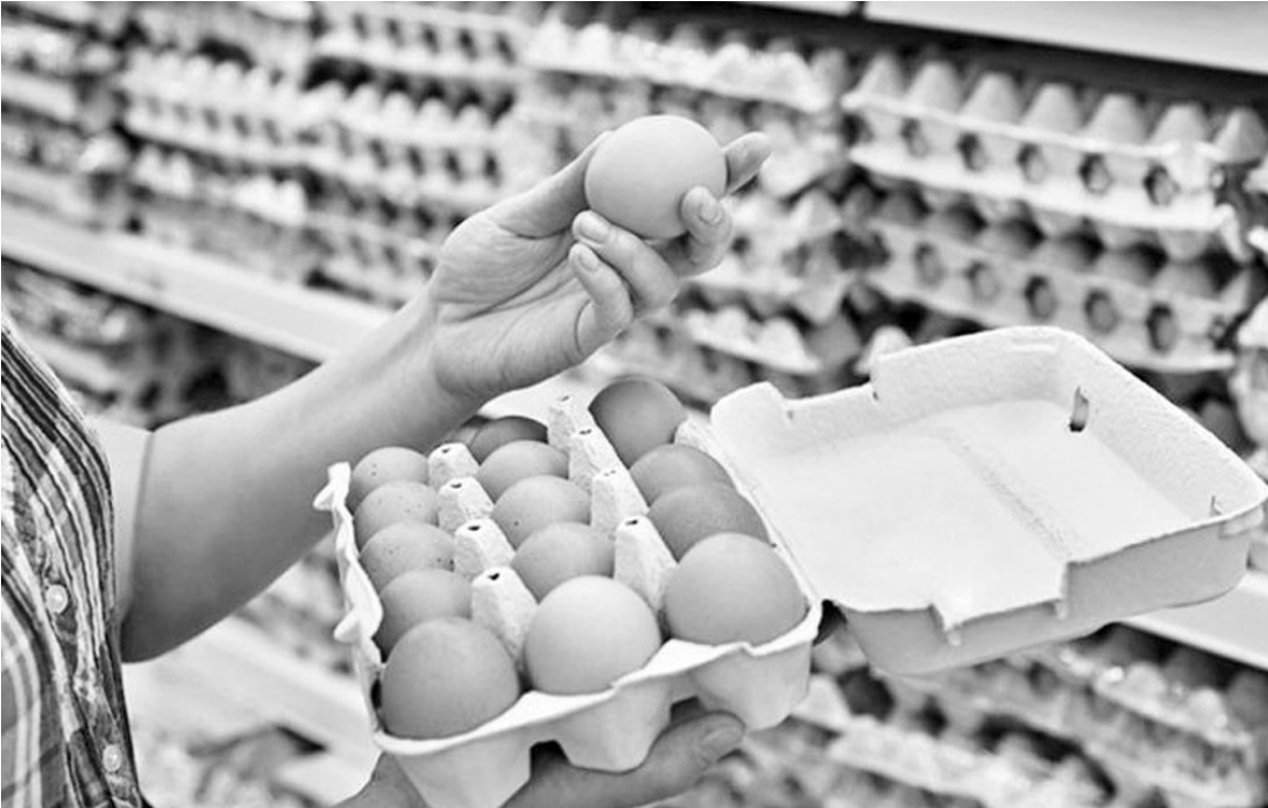
Durante 2025 en el país se produjeron 533 huevos por segundo, con destino mayoritario al mercado interno.

El huevo dejó de ser únicamente un complemento en la mesa cotidiana para transformarse en un protagonista. Por su equilibrio nutricional, su versatilidad culinaria y, sobre todo, su accesibilidad comparativa frente a otras proteínas, el consumo se disparó. En tiempos de inflación, ajuste y cambios en los hábitos de compra, pasó a ser una alternativa concreta cuando se busca reemplazar o estirar el consumo