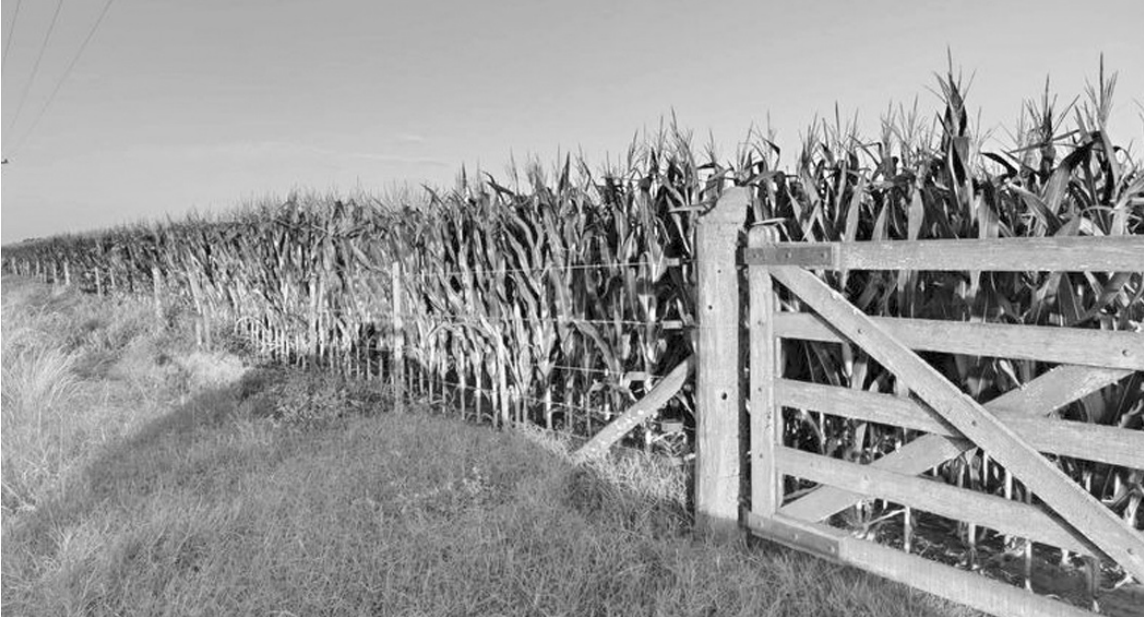
Se estima que podría obtenerse 1 millón de toneladas más de producción que lo proyectado.

DE LA REDACCION. Se esperaban mejores rindes en el maíz temprano, pero han quedado atrás las expectativas. Lo positivo es que se esperan lluvias; lo negativo, la inquietud que genera la chicharrita en el norte. Con un área a cosechar de 8 millones de hectáreas, se estima que podría obtenerse 1 millón de toneladas más de producción que lo proyectado. Al comparar la imagen de anomalía de las reservas de agua en los suelos de esta semana con la del 23 de diciembre, se observa un cambio que se ha dado muy rápido en el centro y sur de la región pampeana. Es un desafortunado giro en el excelente comportamiento que venían mostrando las lluvias y que presenta algunas dificultades, sobre todo en el maíz temprano. Una situación similar se vivía un año atrás, pero abarcaba a todo el país y con mayor gravedad, y fue cuando las lluvias se interrumpieron a partir del 11 de diciembre del 2024. Volviendo a esta campaña, a partir del 24/12/2025 hubo lluvias significativas, pero restringidas al norte del país, lo cual se refleja en la imagen del primer mapa. Un centro de alta presión evitó el ingreso de humedad en el centro del país. Lo bueno es que esta vez fue una situación temporal, a diferencia del 2024, cuando se estableció un bloqueo. De todas maneras, los últimos días del año estuvieron marcados por una ola de calor de 3 a 4 días. Alivio y esperanza El 2026 comenzó con un alivio