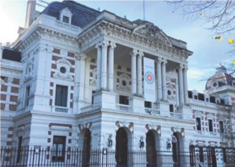
Un punto clave es el compromiso de retomar las negociaciones en febrero. (DB)

El gobierno de Axel Kicillof mejoró con un retroactivo una oferta que había hecho el martes y logró un acuerdo de aumento salarial con los docentes y el resto de los empleados estatales, por el cual los agentes públicos recibirán en febrero -con los salarios de enero- un incremento del 4,5% respecto de los de enero.