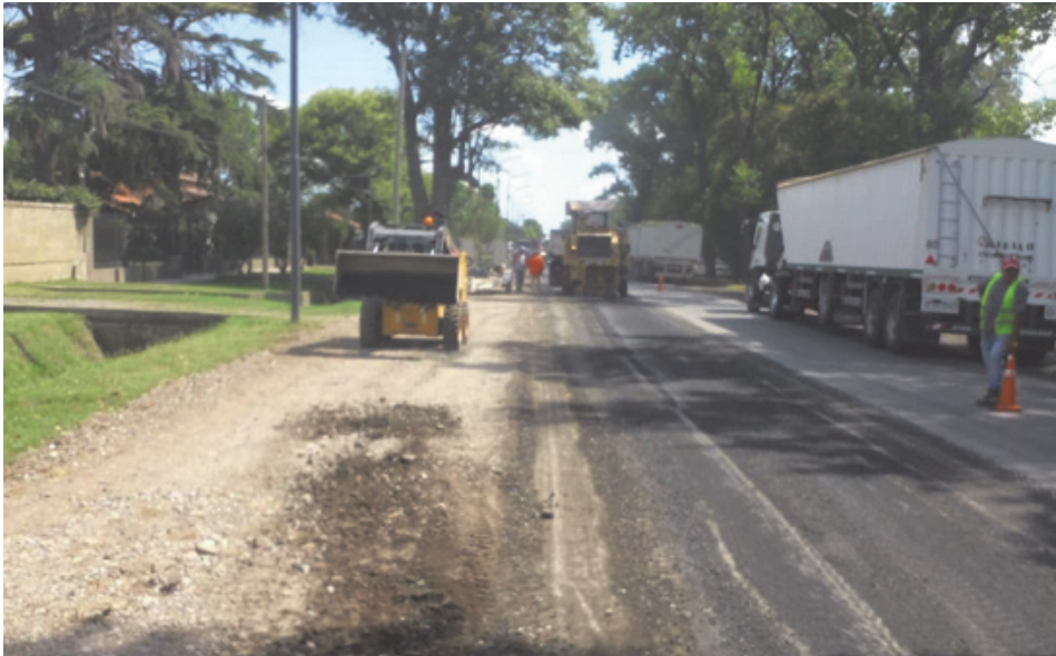
Mientras se continúa con las intervenciones previstas, el Municipio mantiene abiertas las gestiones institucionales ante los organismos nacionales. (LA OPINION)