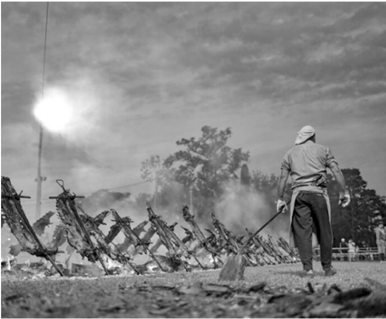
El asado a la estaca, preparado por asadores expertos, será nuevamente la gran vedette gastronómica de la fiesta.