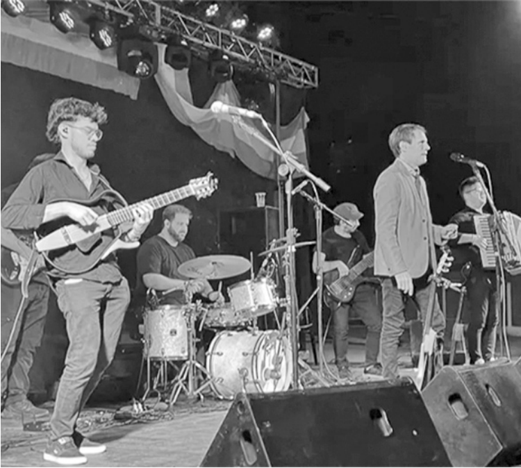
Como en el año 2025, en el escenario se presentarán reconocidos artistas y agrupaciones regionales.