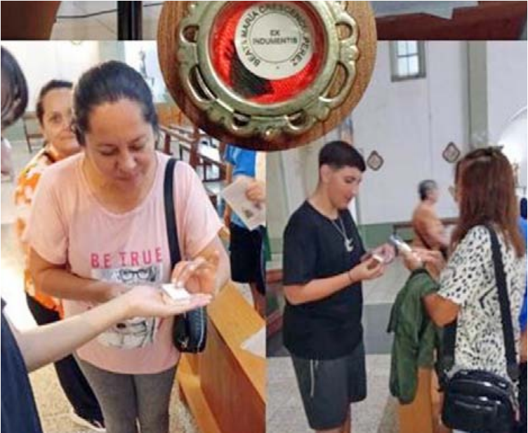
Muchos de los fieles que estaban en la celebración en Villa Carlos Paz, se acercaron a conocer sobre la beata pergaminense. (GAEL MAJLUF)

“Me dejaron hablar, repartir folletos y reliquias. Me hizo muy bien ver cómo la gente se iba con esperanza”, relató Gael, con la