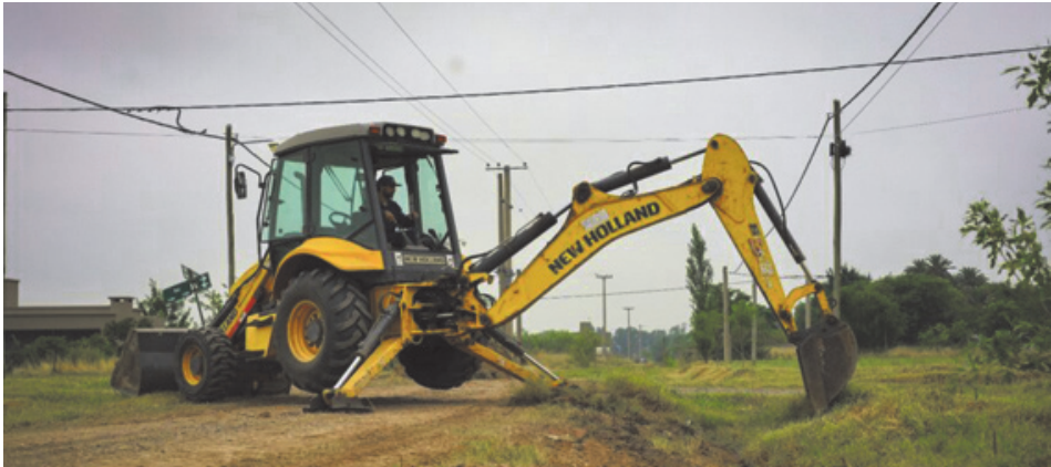
Durante los últimos días iniciaron importantes trabajos para la limpieza integral de la zona del lago en el Parque Municipal.