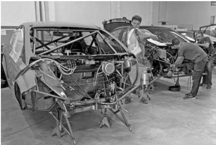
El MG-C Pergamino trabaja a fondo para estar en Paraná con tres autos.