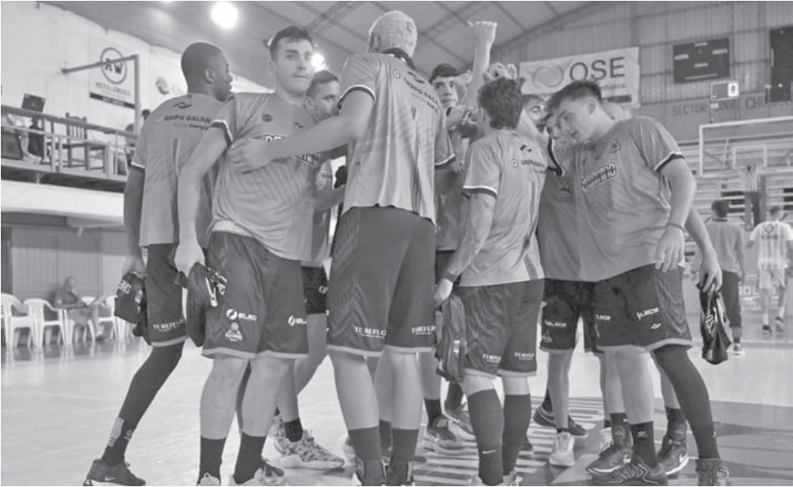
Pergamino Básquet afrontará esta noche una parada brava luego de la caída de local ante Ciclista.

El compromiso de este domingo aparece como una prueba de alto voltaje. Pico FC se ubica actualmente en el sexto lugar de la Conferencia Sur, con un