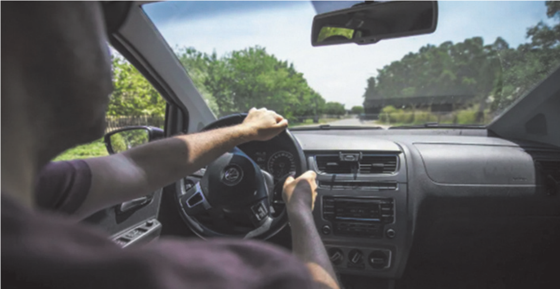
Alquilar un vehículo para viajar en vacaciones implica cumplir requisitos específicos y tomar los recaudos necesarios.

Los autos de alquiler que te ofrecen son los habituales en el país que vas a visitar, por lo que te puedes encontrar con alguna marca o modelo que quizás no conozcas. Pero al final lo que realmente has de contratar es un tipo de modelo con un tamaño y características determinadas. Un dato para tener en