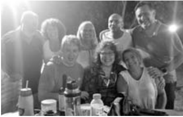
Arte y camaradería en el Complejo Sueños. (CELIA MAGALLANES)

Asimismo, Pandolfini detalló que “la entrada en puerta va a ser de $25 mil pesos, las entradas anticipadas de $20 mil; el valor de la entrada de Jubilados (tanto anticipada como en puerta) es de $20 mil. Los menores de 6 a 12 años van a pagar $10 mil pesos. Los esperamos a todos, es un evento muy importante para la comunidad y para toda la zona ya que nuclea alrededor de 5 mil personas que todos los años disfrutan de la Fiesta de la Estaca”.