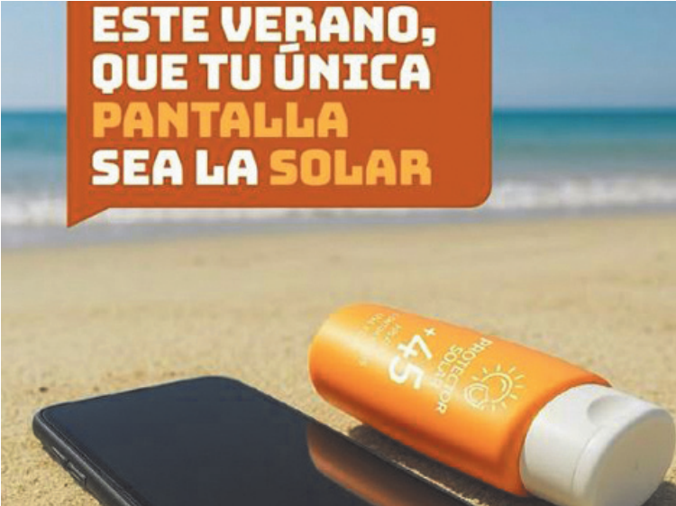
Con diferentes gráficas se insta a las personas a no estar pendientes del celular.

Este proyecto, además, se refuerza con datos obtenidos en la campaña de la Defensoría “Desconectá para conectar”, donde se analizaron diferentes situaciones en las que el uso de estos dispositivos impacta en el día a día y los vínculos de las personas. En este marco se destacó que el 36 por ciento de las personas encuestadas tiene un uso problemático del celular.