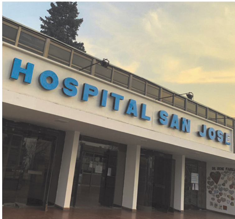
El Hospital San José de Pergamino ofrece ocho pre-residencias: Clínica Médica, Psiquiatría, Terapia Intensiva de Adultos, Farmacia, Bioquímica, Pediatría, Neonatología, Terapia Intensiva Infantil. (HOSPITAL SAN JOSE-0221)

Desde el lunes 26 de enero y hasta el 13 de febrero estará abierta la inscripción al programa de Pre-residencias en el Hospital San José de Pergamino. Se trata de una formación paga de seis meses que permite conocer la red de residencias y acceder de manera directa a especialidades estratégicas del sistema de salud de la provincia de Buenos Aires.