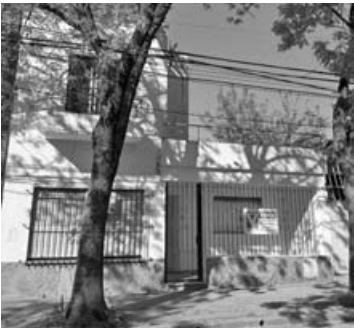
Echevarría 74: 3 dorm, baño, liv, comed, coc, patio, terraza. U$S 85.000