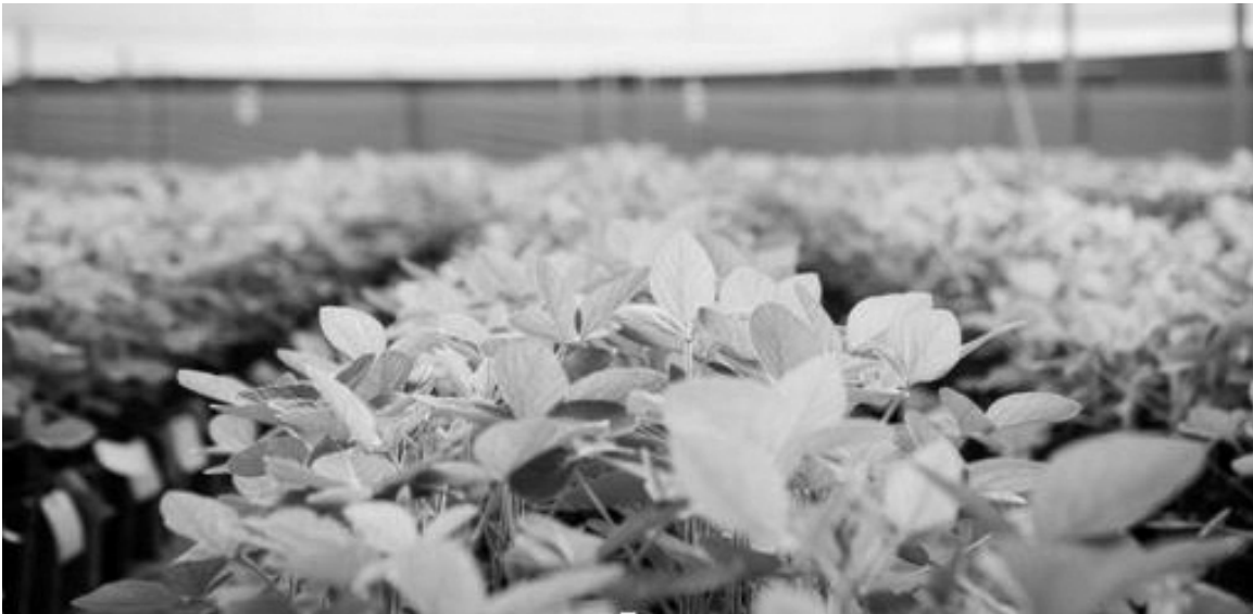
El Evento será el 25 de este mes en Chacabuco. (DONMARIO)

En un escenario productivo marcado por la inestabilidad del clima y la necesidad de optimizar cada decisión, DONMARIO realizará el próximo 25 de febrero una nueva edición de su tradicional jornada a campo "DONMARIO MÁS 2026", en el Centro de Experiencias Don Florencio, en Chacabuco.