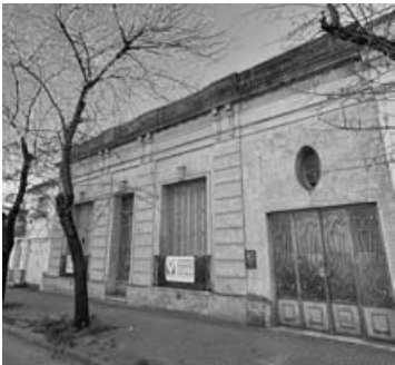
Echevarría 355: Lote 12,40 x 43, sup. cub 285 m2, 7 habitaciones, garage.