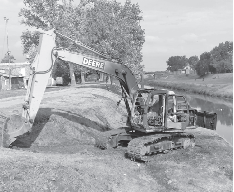
La retroexcavadora se incendió por causas que se investigan.

Un incendio se registró este jueves por la tarde en una retroexcavadora que se encontraba realizando tareas en el arroyo Pergamino, en inmediaciones del puente de avenida Rocha. El siniestro generó alarma entre vecinos y transeúntes por la intensidad del fuego y una densa columna de humo visible desde distintos puntos de la ciudad. El hecho ocurrió alrededor de las 15:15, cuando por motivos que aún no fueron informados oficialmente la maquinaria pesada comenzó a incendiarse mientras operaba dentro del cauce del arroyo Pergamino, a pocos metros de avenida Rocha, una zona de tránsito constante y frecuente circulación peatonal. Las llamas envolvieron rápidamente parte de la retroexcavadora y dieron lugar a una importante columna de humo negro que se elevó varios metros, lo que motivó llamados de alerta al sistema de emergencias y generó preocupación entre los vecinos del sector y automovilistas que circulaban por la zona. Ante la situación, los rescatis-tas se desplazaron hasta el lugar y trabajaron intensamente para controlar y extinguir el incen-