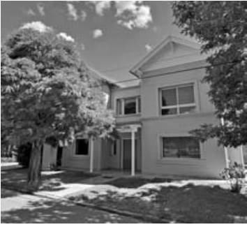
C. Deportiva: 3 dorm, escrit, 2 baños, liv-com, coc-com, jardín.