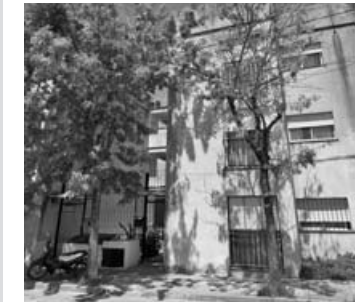
Zeballos 845: 3 dorm, baño, liv-com, coc, lav. U$S 45.000

Saavedra 309 Telefono fijo: 428631 ó 414849 Celular: 2477-688875