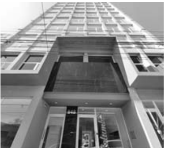
Merced 648: a estrenar, 2 dorm, 2 baños, liv-com, cochera. U$S 130.000