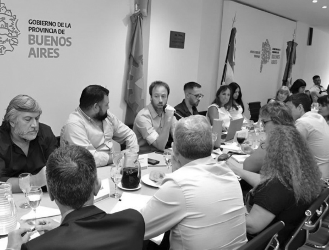
El Gobierno bonaerense se comprometió a convocar a los gremios para los próximos días.

Uno de los factores centrales que atraviesa la discusión es el calendario. Las autoridades provinciales buscan cerrar un acuerdo antes de la liquidación de sueldos, para que los incrementos impacten en los haberes del mes en curso. Al mismo tiempo, existe un fuerte interés en garantizar el normal inicio del ciclo lectivo, previsto para comienzos