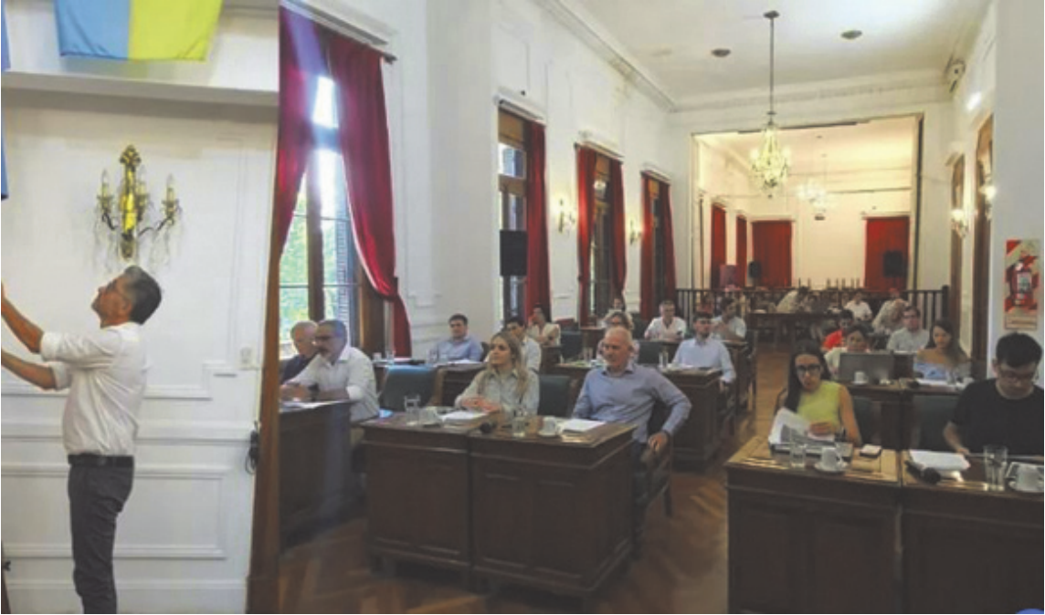
El jueves se realizó la primera sesión extraordinaria del año con el tratamiento de más de 40 expedientes.