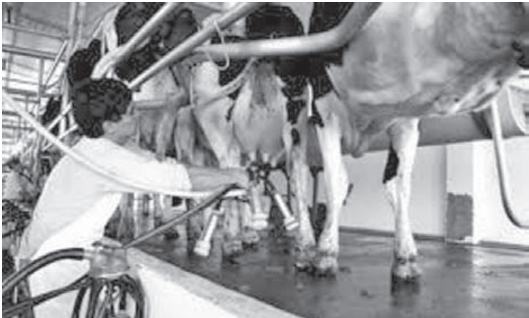
La producción lechera encadenaría dos años consecutivos de crecimiento, alcanzando uno de los niveles más altos de su historia. (ARCHIVO)

El informe del OCLA destaca que el crecimiento proyectado responde en parte a la “inercia” positiva de 2025, un año en el que la lechería argentina mostró una mejora significativa tras varios períodos de dificultades. Para 2025, los datos oficiales reflejaron un crecimiento interanual cercano