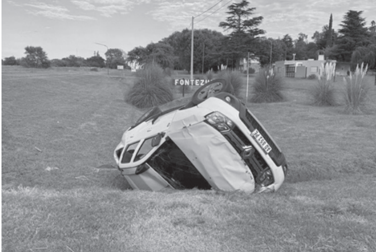
Los ocupantes del Renault Sandero Stepway resultaron ilesos.

La causa quedó caratulada como estafa, y se dio intervención a la Fiscalía en turno, que ordenó la incorporación de capturas de pantalla, comprobantes de las transferencias y demás diligencias de rigor para intentar identificar a los responsables de la maniobra.