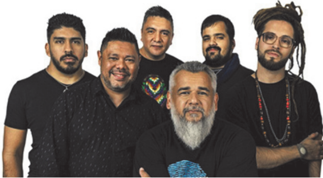
La Callejera, este sábado en el Festival de Peyrano.

Este sábado, la vecina localidad santafesina de Peyrano será escenario de una nueva edición del Festival “Peyrano vuelve a cantar”, un evento que ya forma parte de la agenda cultural de la región y que en este 2026 celebra su 30ª edición con una propuesta renovada y artistas de primer nivel. La grilla artística tendrá como principales protagonistas a las reconocidas agrupaciones Ahyre y La Callejera, que encabezarán una noche pensada para la celebración cultural, la música en vivo y el encuentro comunitario, convocando a público de distintas localidades. Como es tradición, el festival ofrecerá un completo Patio de Comidas, donde se podrán disfrutar los clásicos costillares a la estaca, las tradicionales empanadas del festival, loco, además de choripanes, hamburguesas y una destacada Mesa Dulce, uno de los sellos distintivos del evento. A ello se sumará la vigésimo sexta Muestra de Artesanos y Manualistas, con puestos pro-