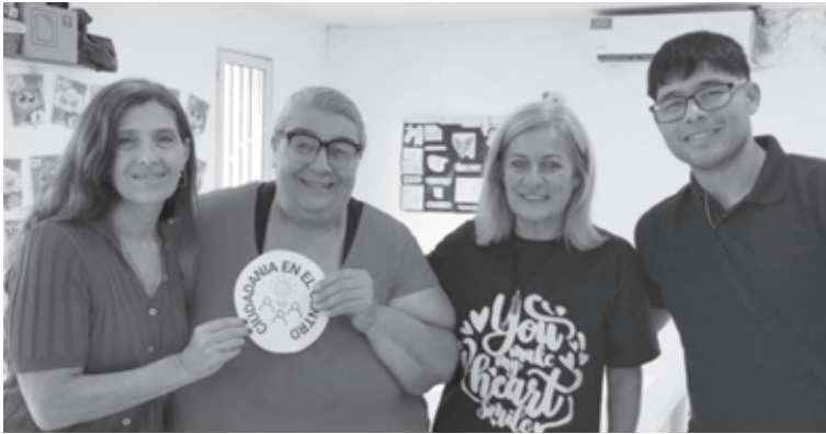
El Municipio de Pergamino destinó $75.000.000 para hacer realidad los proyectos de Desarrollo Social.

El Municipio de Pergamino continúa fortaleciendo las políticas de participación ciudadana y, en ese marco, días atrás se llevó a cabo una importante reunión en el Centro Comunitario de Quinta Mastrángelo en el marco del Presupuesto Participativo, una herramienta que permite a los vecinos proponer y decidir proyectos para mejorar sus barrios.