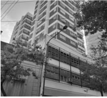
Florida 815: 3 dorm (1 en suite) liv-com, terraza amplia propia, 2 cocheras.