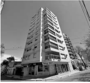
11 de Sep esq. 9 de Julio: 3 dorm, 2 baños, liv-com, coc, balcon. U$S 120.000.