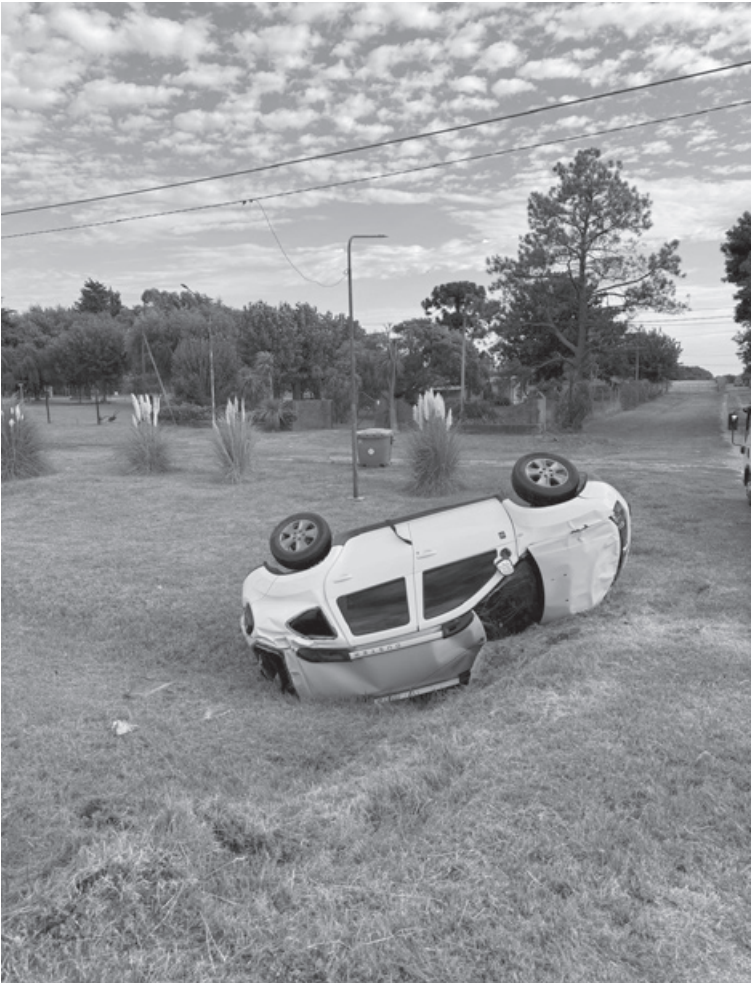
La docente que iba al mando de la Renault Duster sufrió lesiones de consideración.