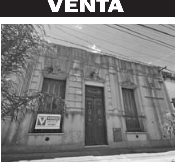
San Martín 419: Apto uso fliar/comercial, 5 hab, sala espera o liv, 2 baños, patio.