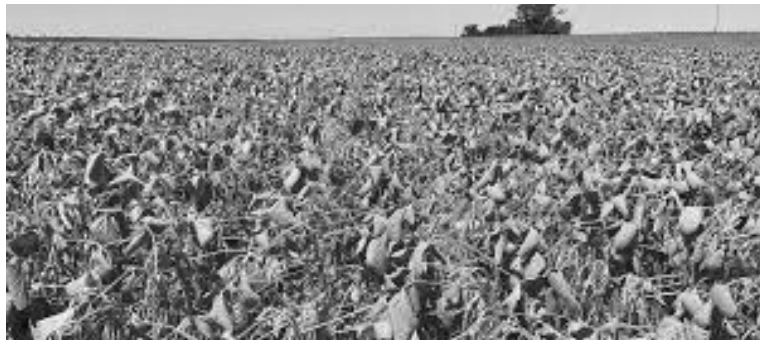
Este déficit de agua coincide con un momento crítico para la soja de primera, cuyo desarrollo está en etapas claves.

La campaña agrícola 2025/26 padece una sequía significativa que ya está dejando huellas visibles en los cultivos más claves de la región núcleo. Según el último informe de la Bolsa de Comercio de Rosario (BCR), el mes de enero cerró con un déficit de precipitaciones que ronda el 66% por debajo de la media histórica para este período, lo cual ha profundizado el estrés hídrico en vastas áreas productivas y empieza a reflejarse en los potenciales de rendimiento de la soja de primera.