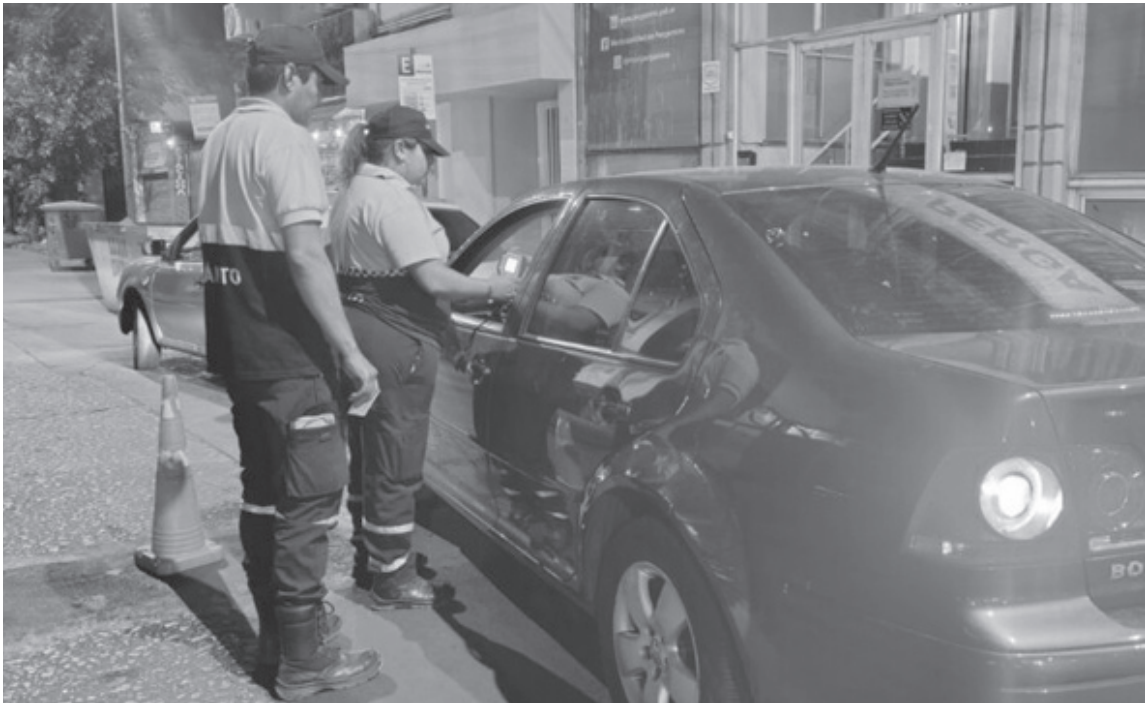
Según el relevamiento estadístico realizado, en enero de 2026 los accidentes de tránsito se redujeron un 5,71 % en comparación con enero de 2025. PRENSA MUNICIPALIDAD

La Subsecretaría de Tránsito de Pergamino informó una disminución significativa de los accidentes de tránsito y de personas lesionadas durante el mes de enero de 2026, como resultado de la puesta en marcha de un Programa Integral de Prevención y Reducción de siniestros viales.