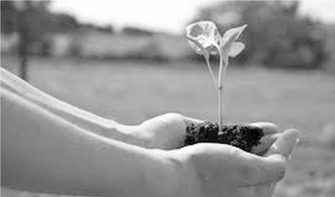
La Aianba aboga por la aplicación de tecnología responsable y las buenas prácticas agrícolas.