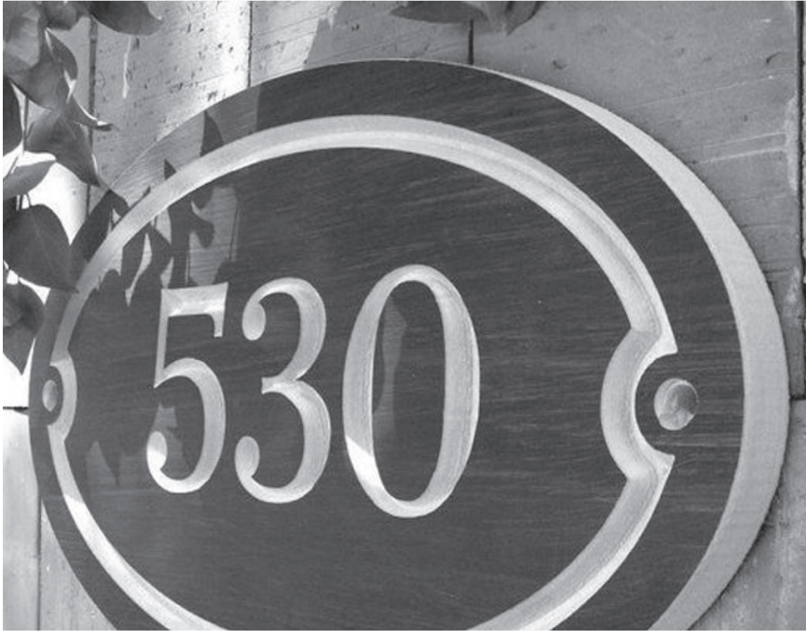
La normativa responde a la necesidad de que cada vivienda cuente con una identificación clara que permita su correcta individualización. (PERGAMINO AL DÍA)

Una ordenanza aprobada por unanimidad en Pergamino establece que todas las propiedades deben contar con el número oficial asignado por el Municipio, visible desde el exterior. La medida busca mejorar la identificación de los domicilios.