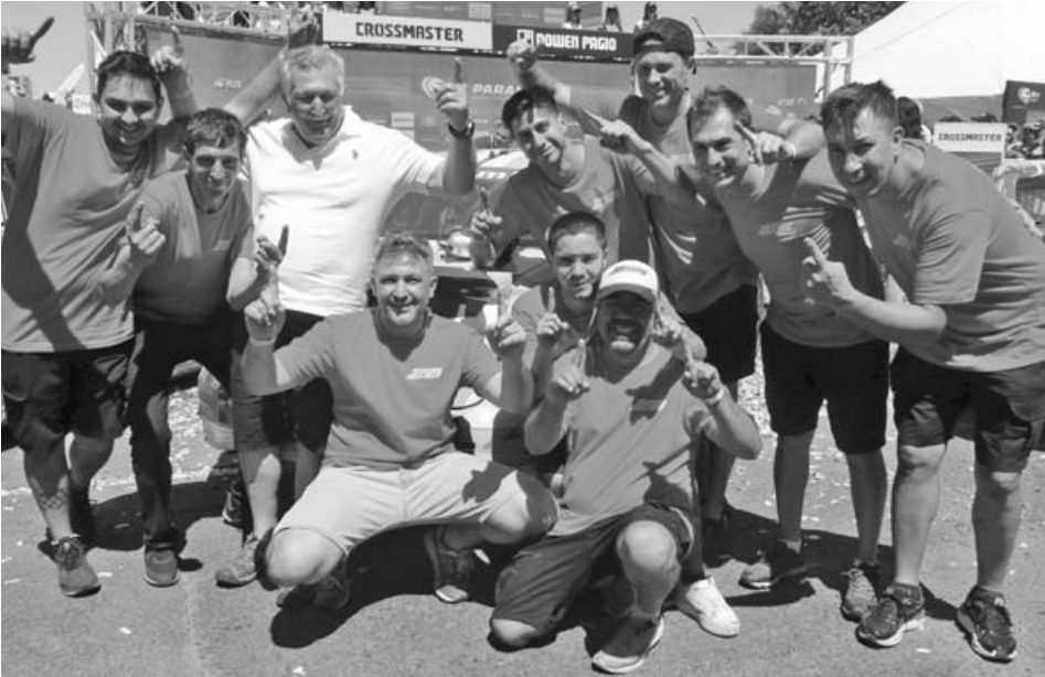
El festejo del equipo Saturni Racing, ganador de las dos finales (Clase 2 y 3) en Paraná. (DARIO GALLARDO)