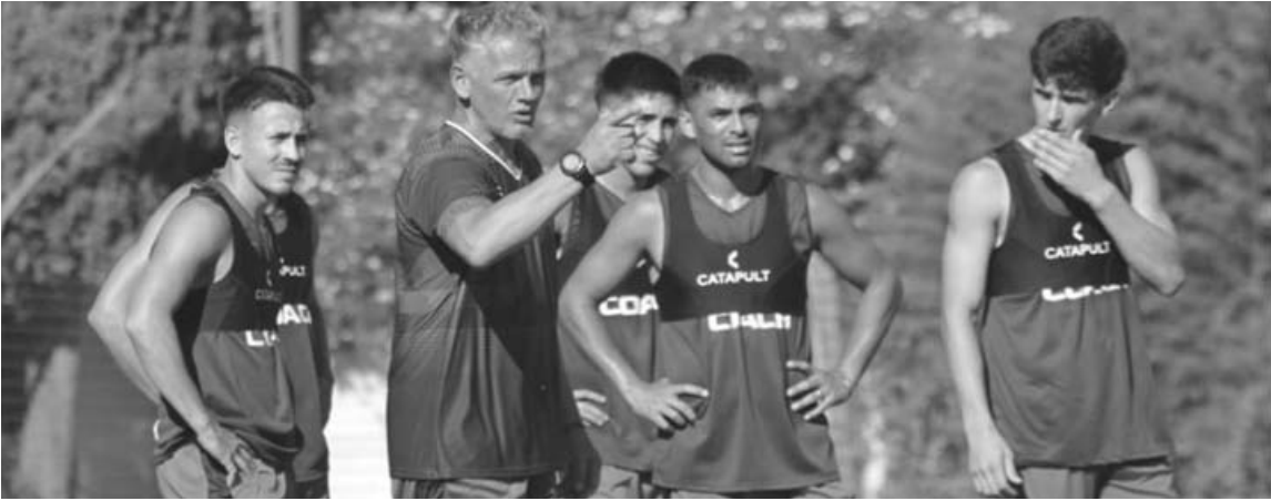
Douglas Haig entrenó ayer en doble turno y hoy lo hará solo por la mañana camino al primer amistoso.

Doble turno y tareas con pelota Ayer el plantel trabajó en doble turno, tal como estaba previsto en el cronograma semanal. Por la mañana, el grupo fue dividido en dos: mientras uno realizó fútbol en espacios reducidos, enfocado en intensidad, presión y circulación rápida, el otro desarrolló trabajos con pelota, priorizando coordinación, precisión en los pases y movimientos específicos por líneas. La modalidad apunta a sostener la base física construida en las primeras semanas y, al mismo tiempo, profundizar aspectos tácticos y de funcionamiento colectivo. Con el correr de los días, el protagonismo de la pelota empieza a ganar terreno en la planificación, una señal clara de que el equipo comienza a virar hacia una etapa más futbolística. La tercera semana presentó modificaciones respecto de la