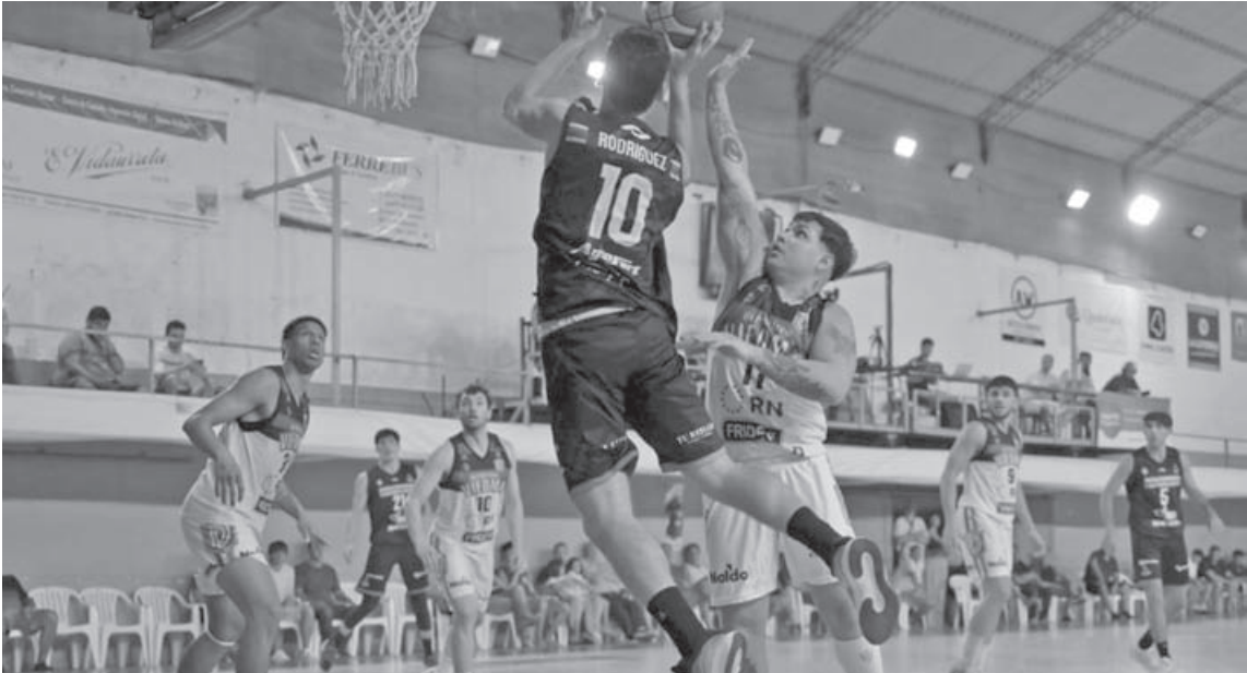
Pergamino Básquet sumó una nueva derrota ante Deportivo Viedma en el inicio de la seguidilla de local.