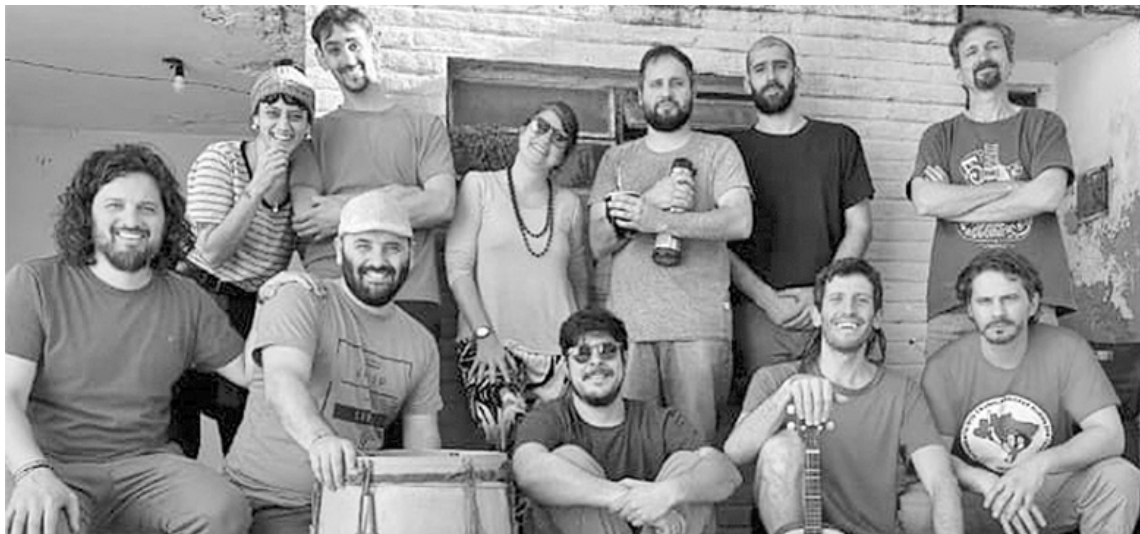
El sábado vuelve Ensamble Sudaca con un repaso de su repertorio brasileiro, argentino y peruano.