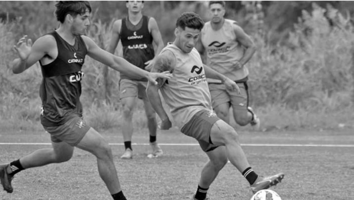
El ensayo de mañana abrirá una serie de encuentros preparatorios que continuarán en las próximas semanas.

anterior -que había sido íntegramente en doble turno- con el objetivo de administrar cargas y evitar sobreexigencias. En ese