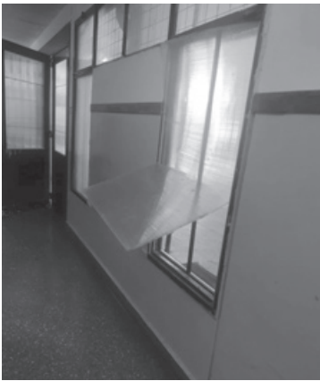
Rompieron aberturas de la Primaria 50.

Dos establecimientos educativos del barrio General San Martín fueron blanco de hechos delictivos durante la madrugada del martes, generando preocupación en la comunidad.