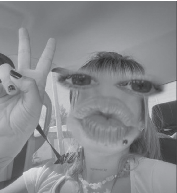
La joven posteoó una selfie haciendo la “V” de la victoria al ser liberado su novio.

La excarcelación del joven investigado por el asalto en un barrio privado generó una fuerte repercusión digital, donde su pareja transmitió en vivo cada instancia del trámite ante la Fiscalía y la seccional policial donde estuvo aprehendido. Mientras la pesquisa sigue su curso y apunta a nuevos nombres, la liberación reconfiguró el escenario del caso.