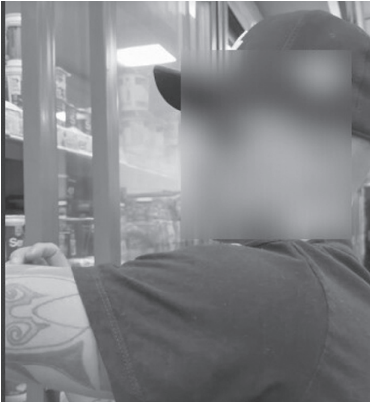
La imagen de su pareja en libertad fue una de las historias en sus redes.

DE LA REDACCION. La liberación de un joven de 22 años, aprehendido en el marco de una investigación penal por un violento robo en un barrio cerrado, fue celebrada públicamente por su pareja, una influencer local conocida como “La Jefa”, quien relató en tiempo real el proceso judicial a través de sus redes sociales. Desde las primeras horas del martes, la influencer comenzó a compartir videos e imágenes des-