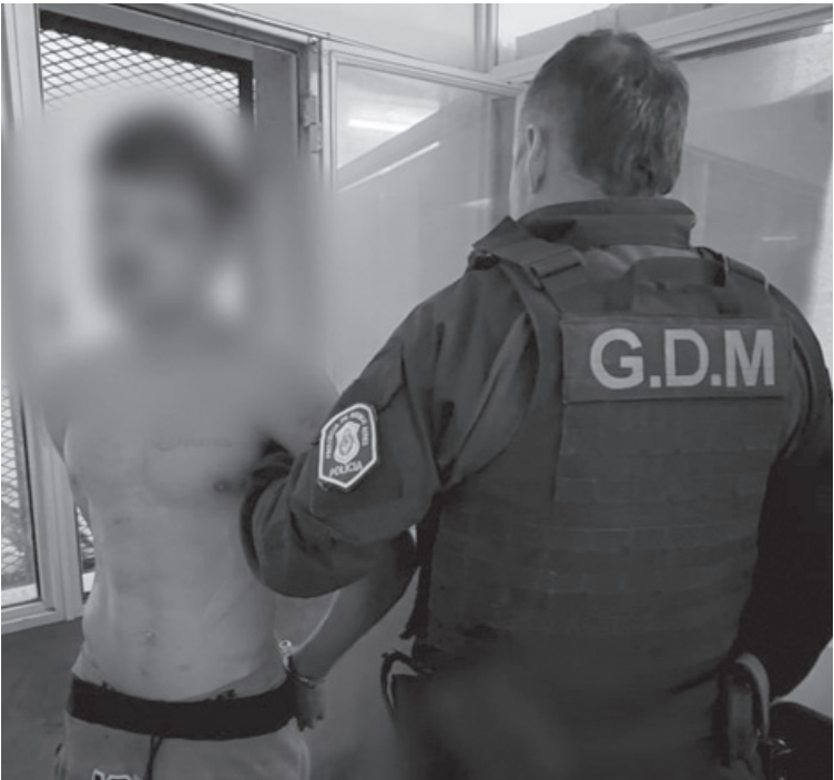
El sujeto de 21 años fue aprehendido en la vía pública.

La víctima presentaba dos heridas de arma de fuego; un disparo en el pecho y otro en el abdomen. La investigación determinó que