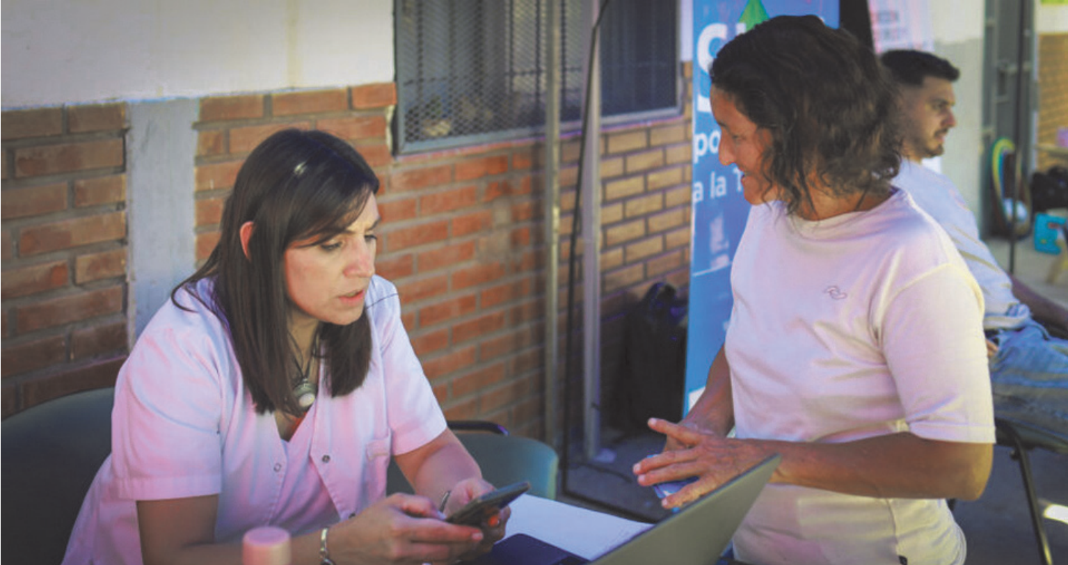
El operativo no solo apunta a resolver consultas puntuales, sino también a dar a conocer los servicios disponibles que ofrece el Área de Discapacidad. (PERGAMINO AL DÍA)

“Desde principios de enero estamos recorriendo los pueblos del Partido para acercarnos a quienes, por distintos motivos, no pueden trasladarse hasta la sede central. La respuesta viene siendo muy buena y en cada localidad encontramos una amplia convocatoria”, señaló en diálogo con LA OPINIÓN. A partir de la experiencia recogida en estas primeras semanas, el área está evaluando la posibilidad de establecer visitas mensuales en aquellas localidades donde se registra una demanda superior. La intención es sostener la presencia territorial y garantizar un acompañamiento más frecuente en los casos que así lo requieran.