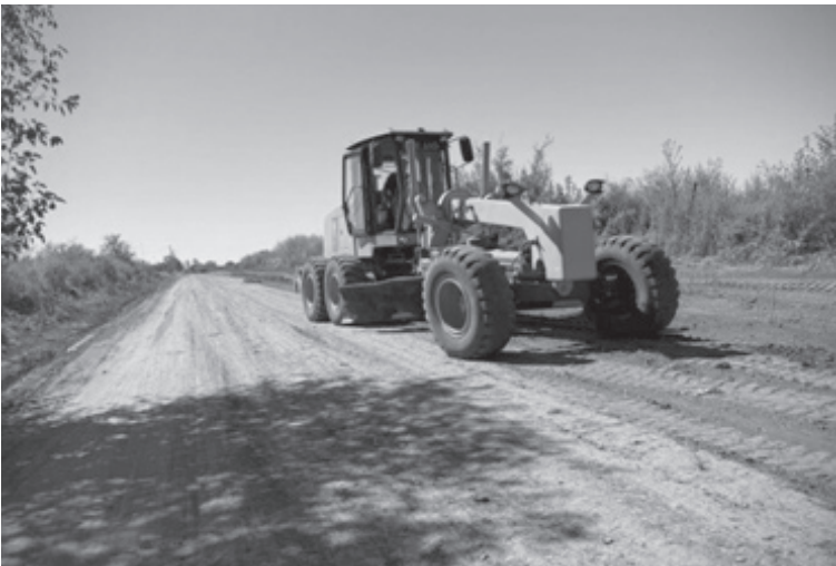
En la zona de Mastrángelo se está realizando perfilando calles y escoriado.

La Secretaría de Servicios Públicos continúa con su plan integral de intervenciones en las distintas zonas de nuestra ciudad. Quinta Mastrángelo, 12 de octubre, Güemes, La Guadalupe y San Martín, son algunos de los barrios en los cuales se está trabajando en esta semana.