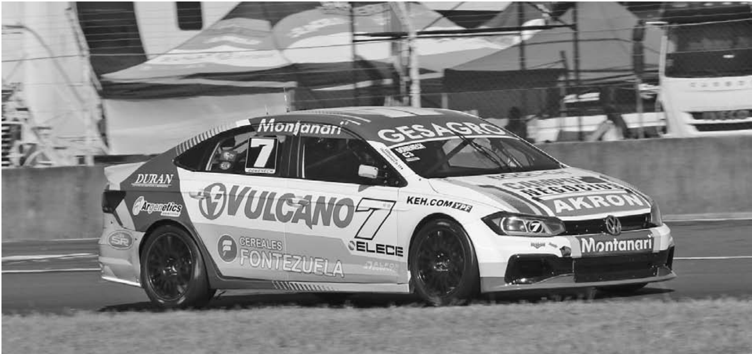
Paraná le sienta bien: Alfonso Domenech protagonizó otro gran arranque de temporada en Paraná al mando del Volkswagen Virtus.

El piloto pergaminense tuvo un arranque ideal en el campeonato 2026 de la Clase 3 del Turismo Nacional al ganar donde ya había triunfado el año pasado. El campeón 2024 lidera con 39 puntos tras un fin de semana sólido con el Virtus y afrontará la próxima fecha en Alta Gracia con el desafío extra de cargar 40 kilos de lastre por su condición de puntero.