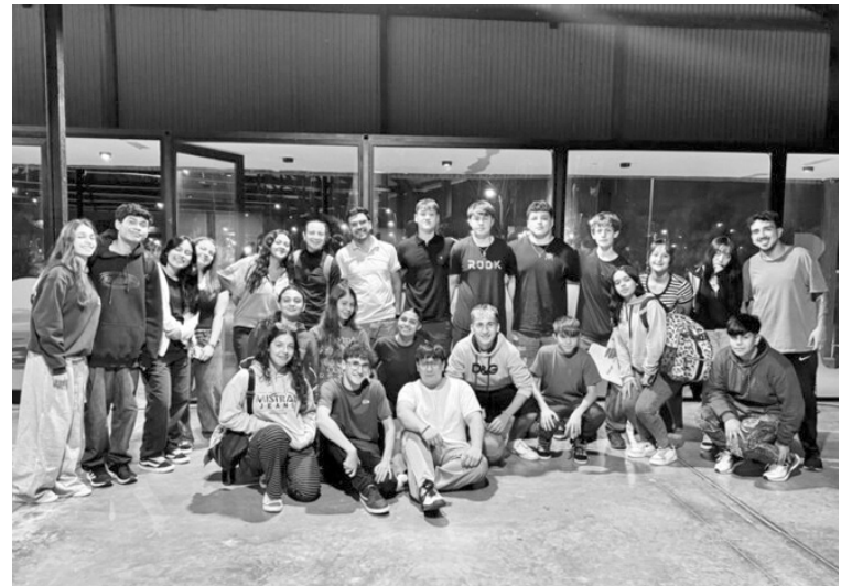
El primer encuentro fue muy productivo, destacaron desde el área de Juventud. (PERGAMINO AL DIA)

Desde la Dirección de Juventud invitan a que más centros de estudiantes se sumen a los próximos encuentros. Para participar, pueden comunicarse vía WhatsApp al 2477 665731 o a través de Instagram en @jovenesperga.