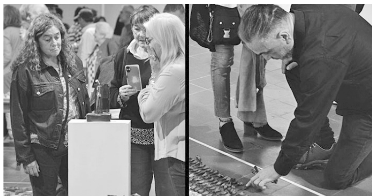
Materiales, texturas y objetos diversos dialogan en obras únicas.