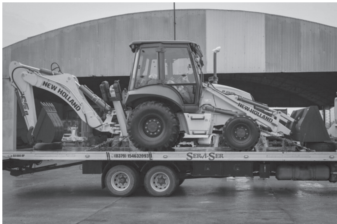
Esta unidad, que ya se encuentra en funcionamiento, fue sumada a la flota municipal a través de la Secretaría de Servicios Públicos.

“Esta nueva máquina nos permite sumar capacidad operativa, armar una logística más amplia y estar más