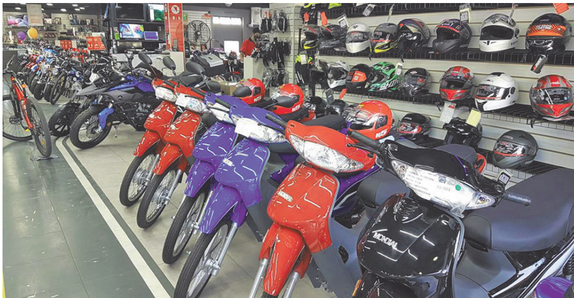
En ciudades del interior bonaerense como Pergamino, esta tendencia se refleja con claridad en el crecimiento del parque de motovehículos. (LA OPINION)

El análisis mensual permite observar con mayor claridad la evo-