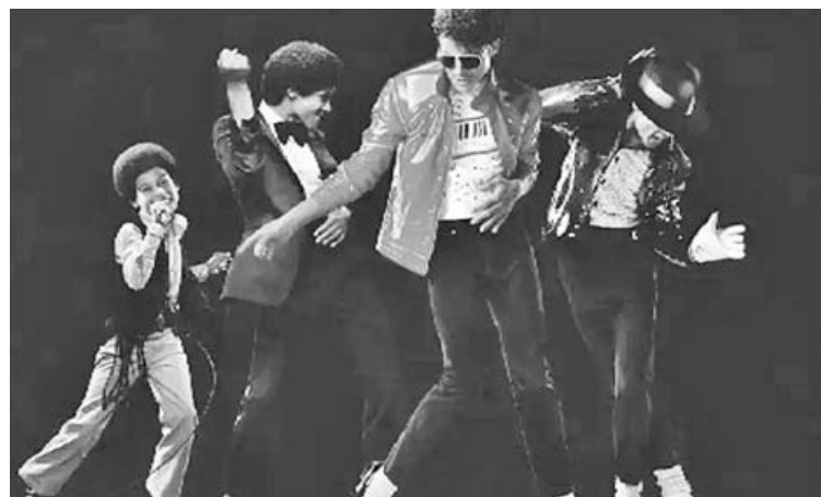
La película biográfica sobre Michael Jackson se estrenó este miércoles a Cinema Pergamino.

por retratar al músico, esta producción cuenta con el aval de su entorno más cercano, lo que permitió utilizar su obra completa —desde su etapa con The Jackson 5 hasta sus discos solistas más emblemáticos— y acceder a material de archivo inédito.