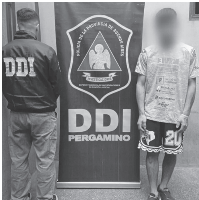
El sujeto detenido por la DDI Pergamino quedó a disposición de la Fiscalía.

DE LA REDACCION. Un joven de 21 años fue detenido en el marco de una investigación por un violento episodio ocurrido en un local de indumentaria, donde un agresor redujo al comerciante y sustrajo dinero, teléfonos y mercadería. La pesquisa permitió reunir pruebas determinantes para avanzar en la imputación y fortalecer la causa judicial en curso.