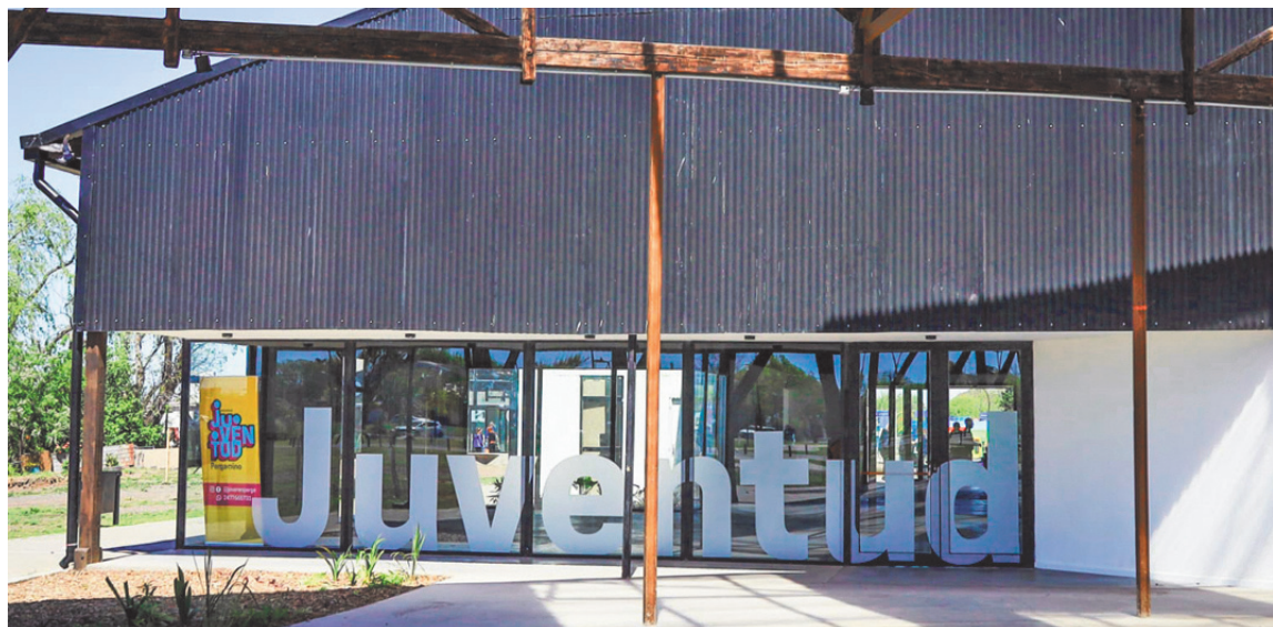
La fiesta tendrá lugar hoy, desde las 20:00 en el Galpón de la Juventud del Parque Belgrano.

La propuesta, impulsada por el Club de Amigos Neurodivergentes, invita a jóvenes mayores de 16 años -con y sin discapacidad- a compartir un espacio de encuentro, música y diversión. La primera edición será este viernes, de 20:00 a 00:00, en el Galpón de la Juventud, con DJ en vivo, buffet solidario y múltiples propuestas pensadas desde la inclusión.