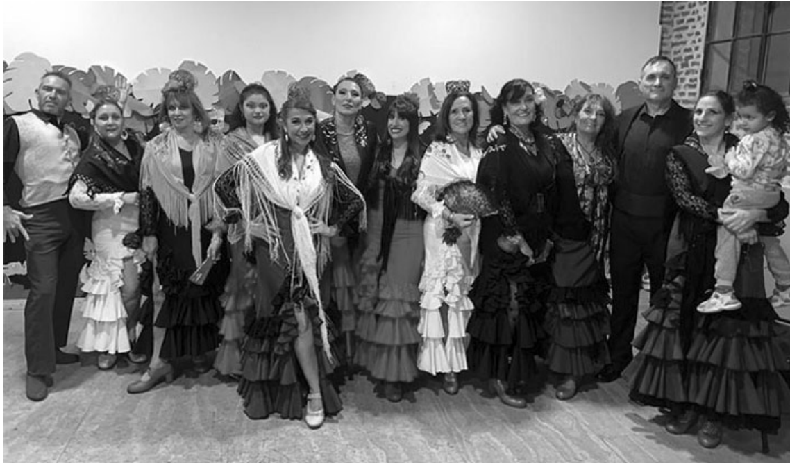
Este viernes en el salón del Concejo Deliberante de Pergamino se presentan alumnos y alumnas del Ballet Español y el Instituto de Danzas La Bayadera.

Este viernes Cinema Pergamino estrena la película Michael, la biopic oficial sobre Michael Jackson.