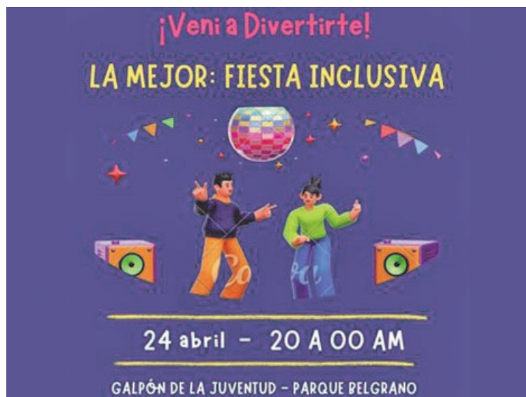
Será la primera fiesta con fines inclusivos que habrá en Pergamino.

Más allá de lo recreativo, la Fiesta Inclusiva nace de una necesidad concreta: generar espacios donde las personas con discapacidad o neurodivergentes puedan disfrutar de propuestas sociales habituales, como bailar