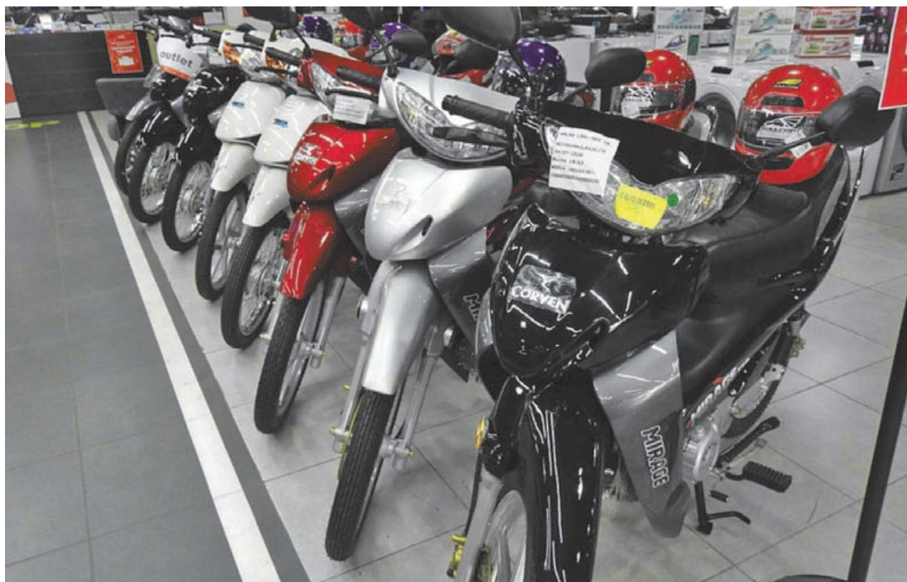
Durante el primer trimestre, el crecimiento en el patentamiento de estos vehículos superó las expectativas del sector.

De acuerdo con los datos oficiales, entre enero y marzo se patentaron 222.871 motos en todo el país, un volumen que evidencia un fuerte repunte de la actividad en comparación con el mismo período del año pasado y que consolida al sector como uno de los más dinámicos dentro del mercado de bienes durables. PAGINA 8