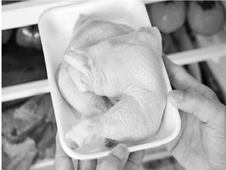
El pollo fue uno de los productos comestibles que más aumentaron durante el tercer mes del 2026.

Entre los rubros que más incidieron en el resultado final de marzo, se destacó el pollo, que