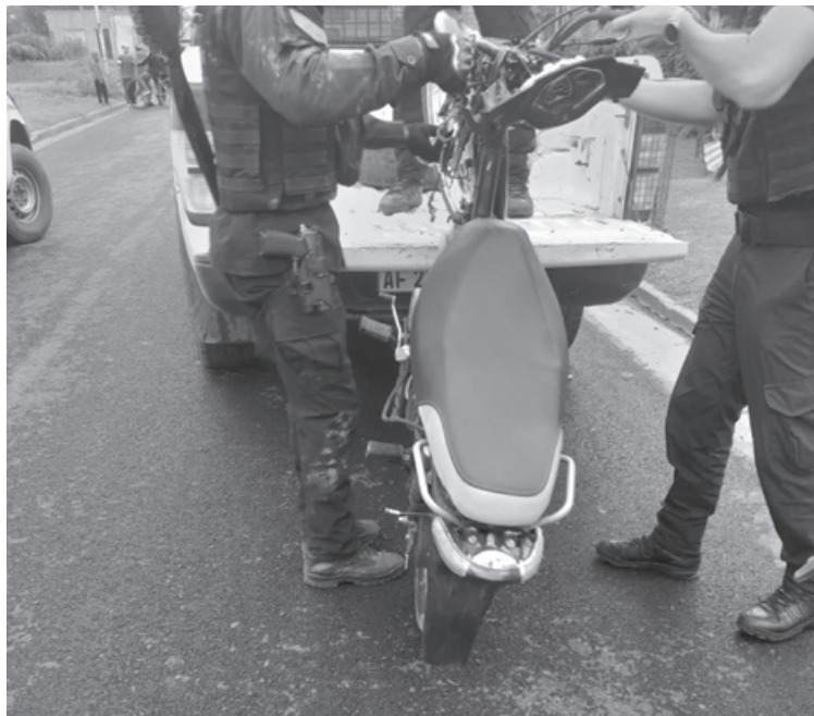
La Policía actuó con celeridad allanando la morada del sospechoso.