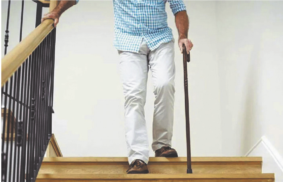
Se debe tener especial precaución con las escaleras en los hogares donde viven adultos mayores.

Si bien las caídas lideran el ranking de accidentes, existen otros peligros latentes en la rutina diaria, tales como quemaduras -originadas principalmente en la cocina o por el uso de agua caliente sin regular-; intoxicaciones por errores en la toma de medicamentos o confusión con productos