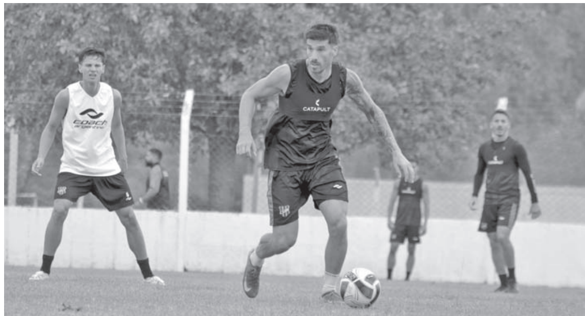
Douglas Haig continúa con su puesta a punto en la recta final de la preparación para el domingo.