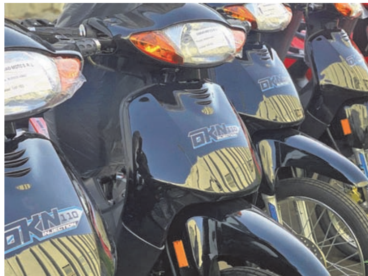
Importante participación del mercado nacional en el segmento de motos.

En ese sentido, Vacas remarcó que la moto no debe ser considerada un bien de lujo, sino una solución concreta a los problemas de transporte, una herramienta de trabajo y un vehículo de inclusión que permite a millones de personas acceder a nuevas oportunidades.