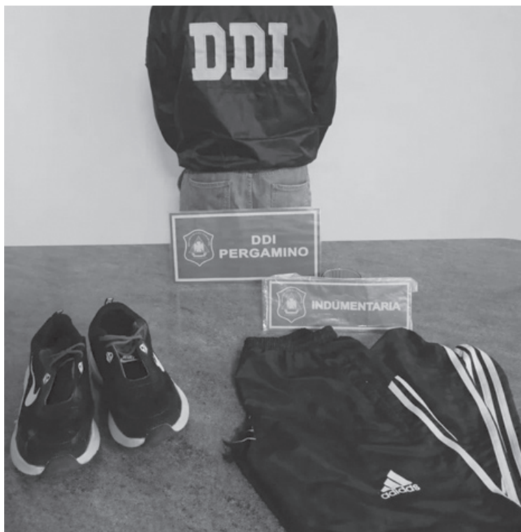
Prendas secuestradas, claves en la investigación por el asalto a comercio.

Las imágenes obtenidas resultaron determinantes para establecer