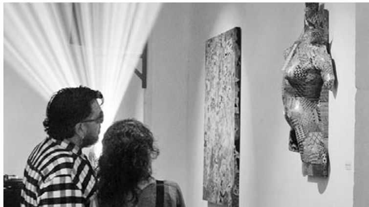
La muestra reúne instalaciones que nacieron en La Vidriera de Dry Bar.