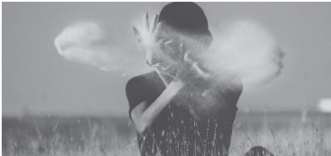
En tiempos donde las problemáticas de salud mental adquieren mayor visibilidad, la consolidación de estas políticas públicas resulta clave para fortalecer el tejido social. (PSICOLOGIA Y MENTE)

Uno de los pilares es el Centro de Prevención y Tratamiento de Adicciones "Padre Galli", donde