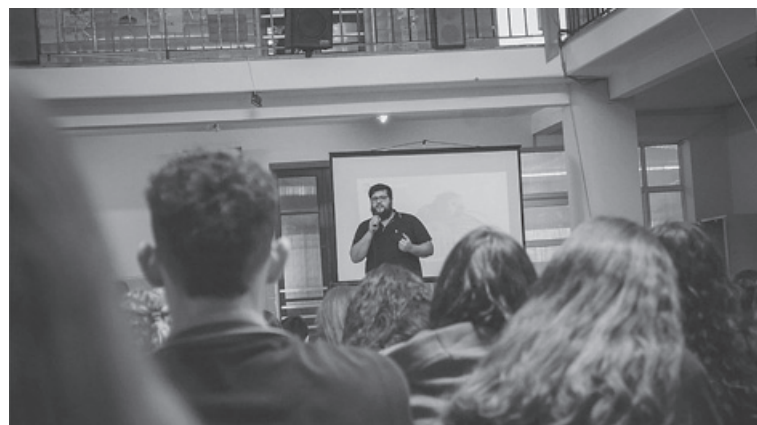
Son varios los grupos que están desarrollándose en la actualidad.