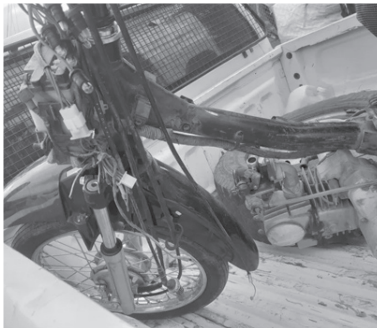
La mujer logró recuperar su moto semi desmantelada.

La rápida reacción de la damnificada de un robo de la motocicleta permitió reconstruir el recorrido del autor y guiar a los uniformados hasta una vivienda donde funcionaría un desarmadero ilegal de vehículos robados. El procedimiento derivó en la aprehensión de un sospechoso y el secuestro de numerosas piezas vinculadas a distintos robos recientes.