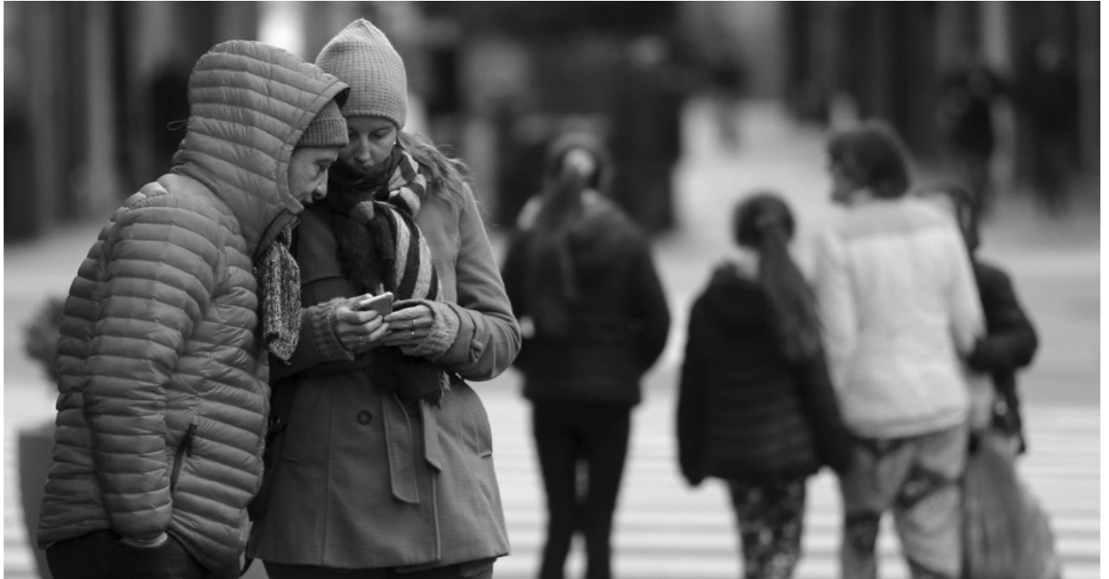
Durante todo el fin de semana continuarán las temperaturas bajas, con mínimas que podrían ubicarse por debajo de los 10 grados y máximas de 12-13 grados. (PERFIL)

Otros registros destacados informados por las estaciones