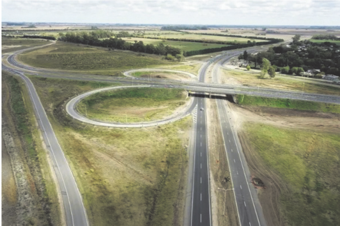
Con esta iniciativa, el Ejecutivo nacional busca avanzar en un nuevo esquema de gestión vial basado en la participación privada. (LA OPINION)

En el texto oficial, el Gobierno argumentó que resulta necesario incorporar una