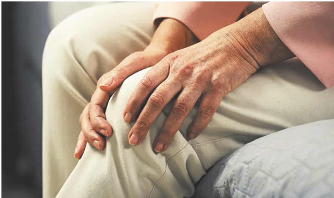
La rigidez muscular y la falta de movimiento son las principales causas de las molestias típicas de la temporada.

A esto, advierte la especialista, se suma el cambio de hábitos estacionales, ya que la tendencia al sedentarismo durante los meses fríos favorece la pérdida de movilidad y la tensión sostenida en las articulaciones.