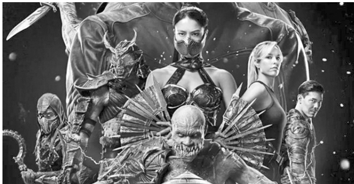
El film profundiza el universo del clásico videojuego Mortal Kombat, apostando por la fidelidad a su estética brutal.

La secuela dirigida por Simon McQuoid llega a los cines con más combates y sangre, pero también reabre la discusión sobre el sentido de la violencia en la cultura contemporánea. Continúan: Súper Mario Galaxy, Michael y El diablo viste a la moda 2.