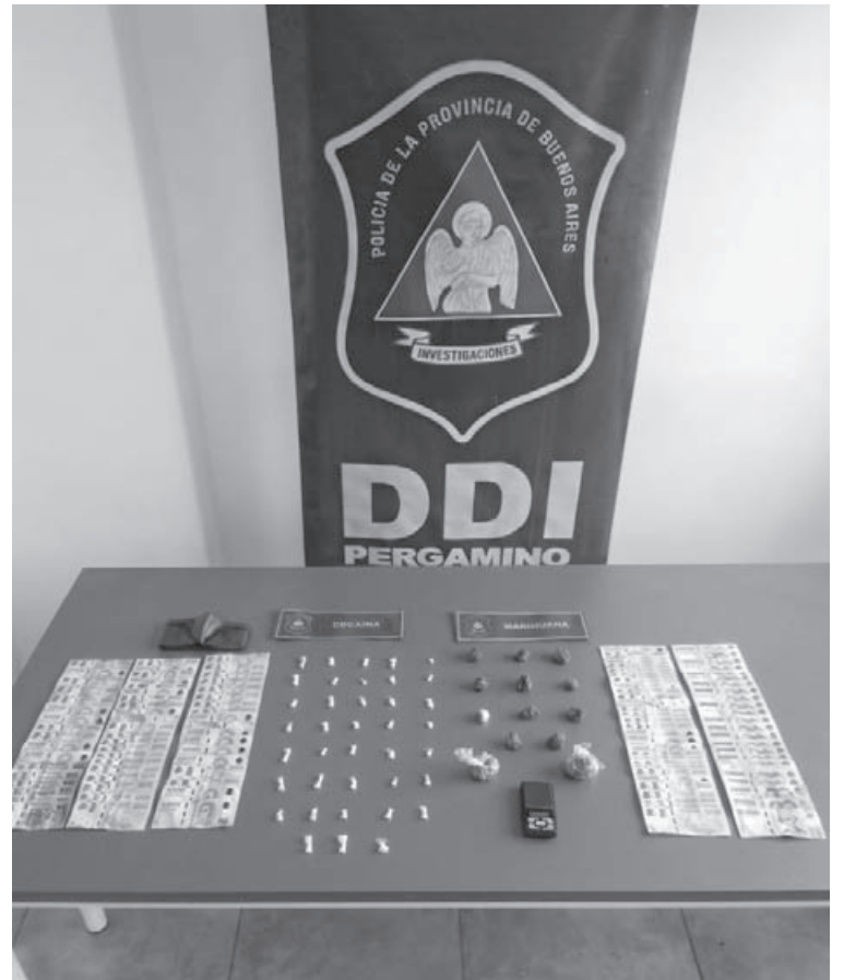
El menor está involucrado en el homicidio de un joven en barrio Hernández.

Fuentes del caso indicaron que su detención generó alivio entre los habitantes del sector, quienes habían manifestado preocupación por situaciones de violencia atribuidas al menor.