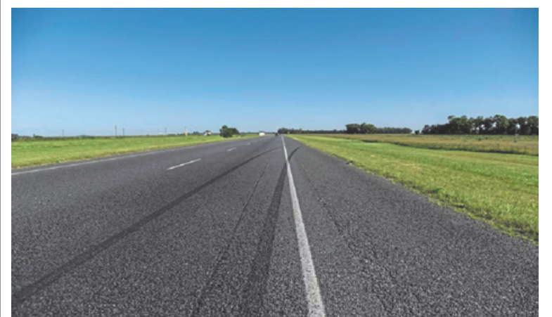
En ciudades como Pergamino, el avance del proceso es seguido con atención.