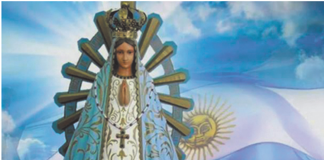
La Virgen de Luján no solo representa una figura religiosa: para miles de personas simboliza consuelo, protección y acompañamiento.

El momento más esperado llegará esta tarde. Si bien se mantendrán las instancias habituales de ora-