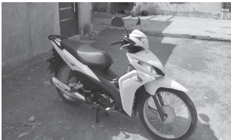
La moto Honda Wave en disputa violenta entre el vendedor y los compradores.

Según el relato de la denunciante, el vendedor se presentó en la vivienda a cerca del mediodía para exigir el pago restante o la devolución de