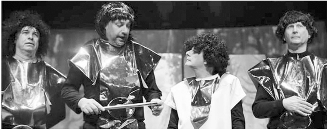
Este domingo se estrena en Espacio GAE la obra Doctor Streamer, con dirección de Marta Lere y Neme Careno, y un elenco de cerca de 30 artistas en escena.

Este viernes Cinema Pergamino se estrena la película Mortal