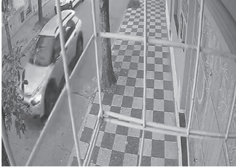
La difusión de la imagen del vehículo provocó que el conductor se entregara.

La difusión del video del siniestro vial en las redes sociales de Diario La Opinión permitió avanzar rápidamente en la investigación judicial por el choque ocurrido el sábado en la esquina de Italia y Castelli. Luego de la viralización de las imágenes y del pedido público de colaboración impulsado por la Fiscalía 8, el conductor del automóvil involucrado se presentó espontáneamente ante las autoridades judiciales para someterse al proceso penal.