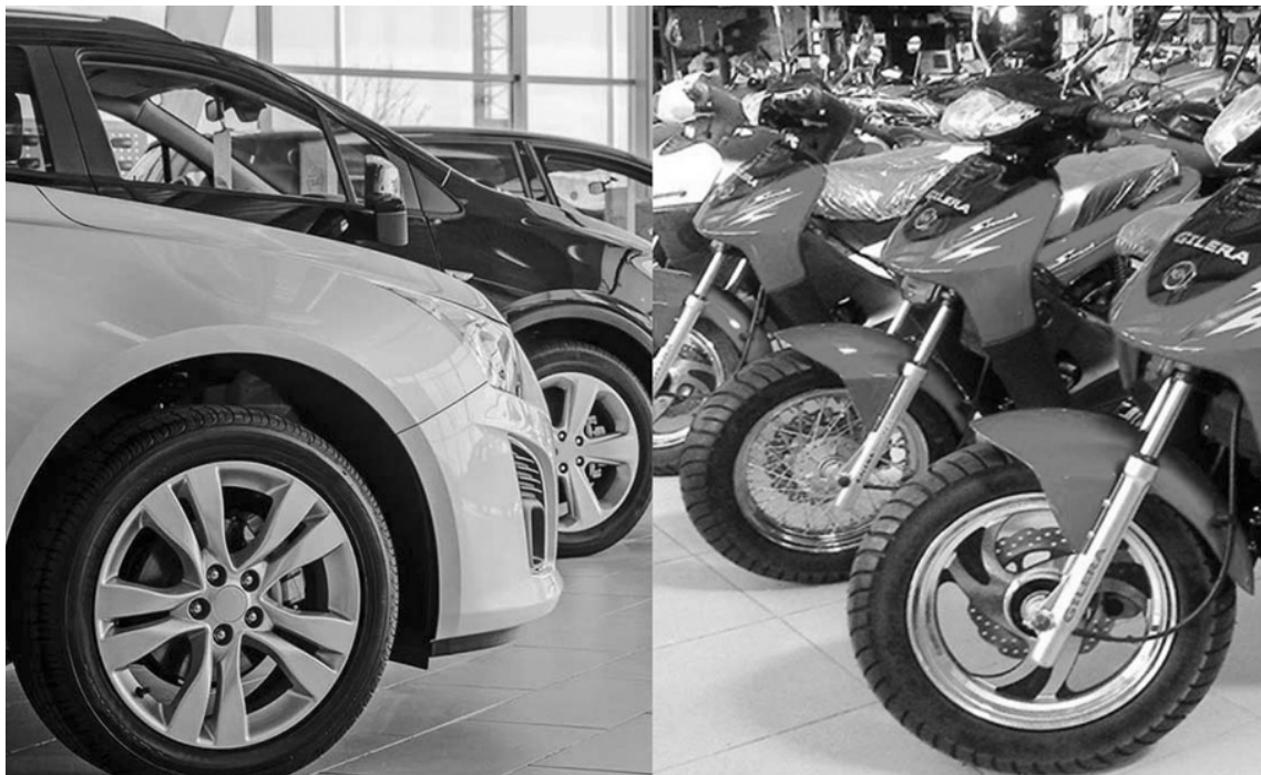
Estos números reflejan una transformación que atraviesa al sector automotor argentino, donde las concesionarias y terminales siguen adaptándose a un nuevo escenario.

El comportamiento del mercado muestra que, pese a cierta estabilidad económica y a la desaceleración inflacionaria observada en los últimos meses, el consumo de vehículos todavía no logra recuperar el dinamismo que había mostrado años atrás. La financiación continúa siendo