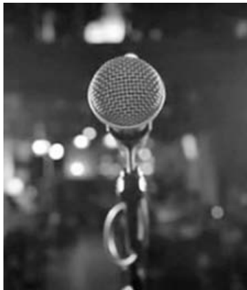
Dos noches de música.

Pero la actividad del espacio no se limita a las funciones. Como asociación civil, Florentino también desarrolla una intensa tarea formativa y comunitaria a través de talleres de teatro destinados a niños, adolescentes y adultos. A ello se suma la creación del Grupo de Teatro Florentino, una experiencia colectiva que representa otro de los grandes orgullos de sus impulsores.