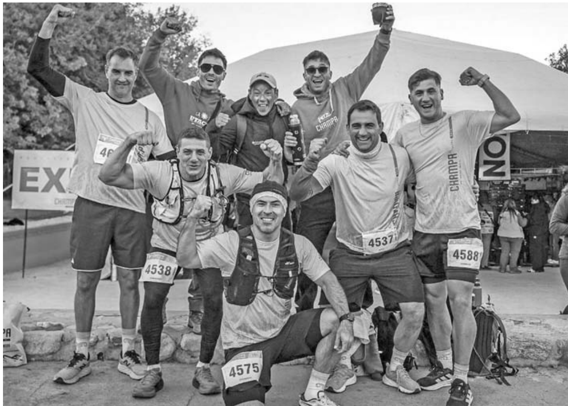
Algunos de los atletas pergaminenses que participaron en la undécima edición de Champa Ultra Race.