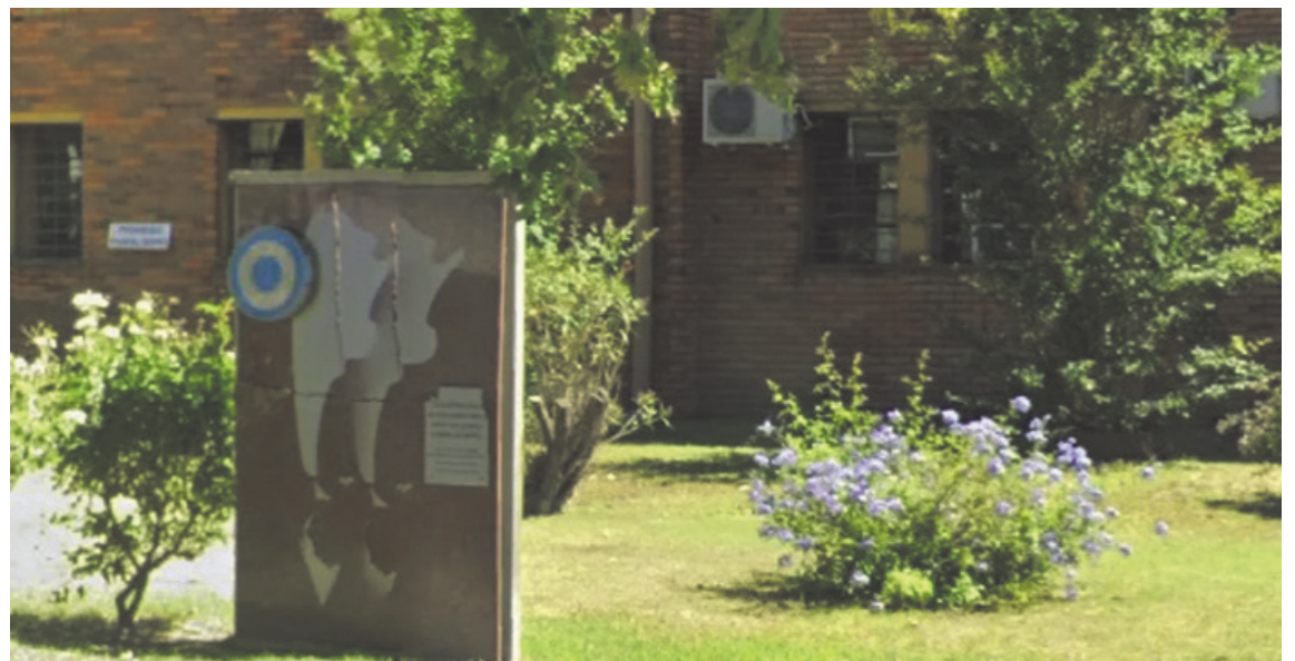
El acto contará con la participación de integrantes de la institución, representantes de entidades intermedias y vecinos de la ciudad.

A partir de las 19:00, en la Cooperativa Eléctrica, se llevará a cabo el acto con el que se presentarán los trabajos realizados para la reconstrucción de este sitio, que es único en el país. Participación especial de la Banda Municipal de Pergamino