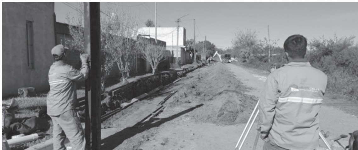
La política de intervención barrial impulsada por la administración local busca llegar de manera progresiva a distintos puntos de la ciudad.

El avance de los trabajos en barrio Virgen de Itatí se suma a otras acciones que la gestión municipal viene desarrollando en distintos puntos de la ciudad, con el objeti-