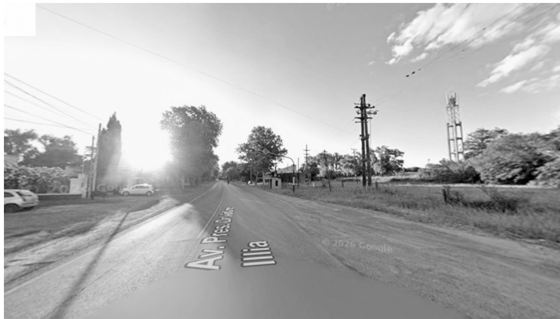
La mujer evitó tener contacto con el ladrón que intentó interrumpir su paso.