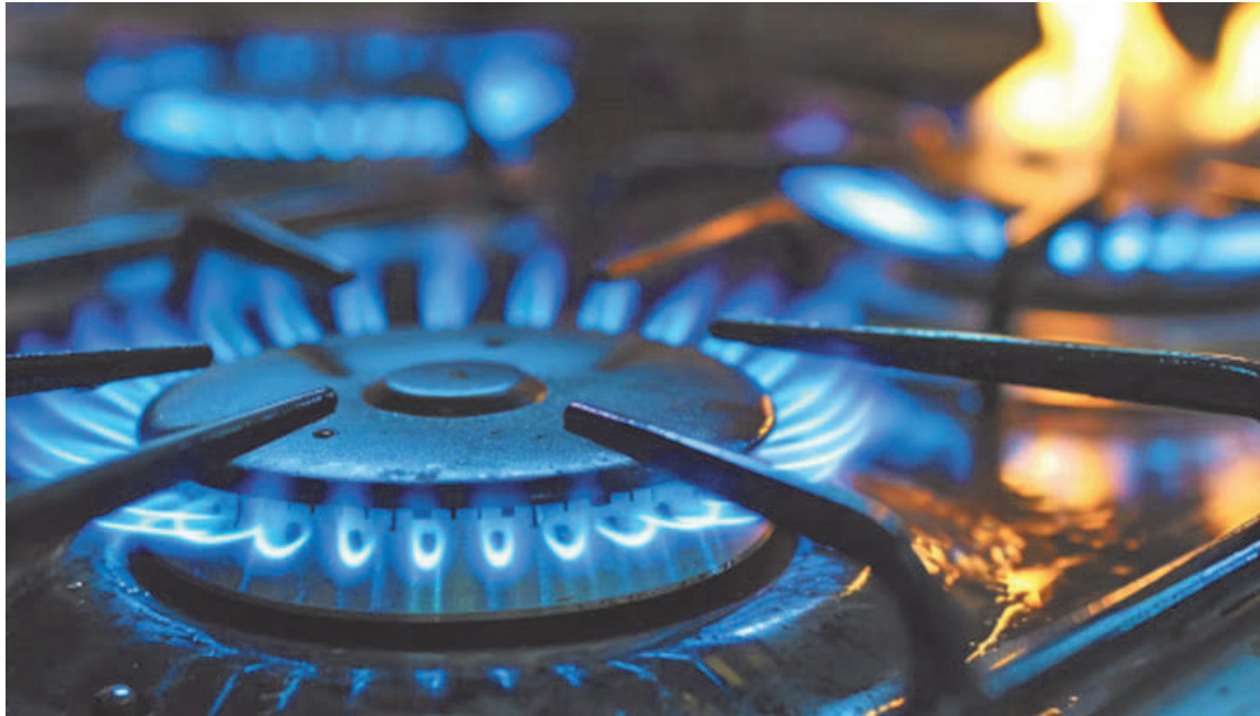
No utilizar hornallas, hornos o braseros para calefaccionar ambientes cerrados sin ventilación adecuada. Las estufas sin salida al exterior representan otro factor de riesgo importante. (DIB)

Además de no percibirse por no tener olor ni generar irritación, los síntomas de la intoxicación por monóxido de carbono suelen confundirse con cuadros virales o malestares propios de las bajas temperaturas u otras dolencias cotidianas: causa dolor de cabeza, mareos,