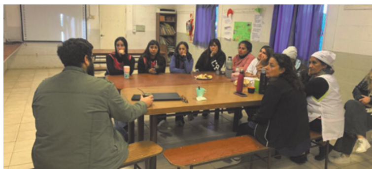
El objetivo es fortalecer las redes de salud mental en los barrios. (PERGAMINO AL DÍA)

El objetivo del Programa es fortalecer las redes de salud mental en los barrios y generar un pilar preventivo, de contención y de cercanía.