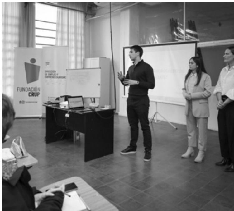
La primera jornada de capacitación se llevó adelante en la sede de la Fundación CRUP y reunió a cerca de 180 emprendedores locales, distribuidos en tres turnos de cursada.