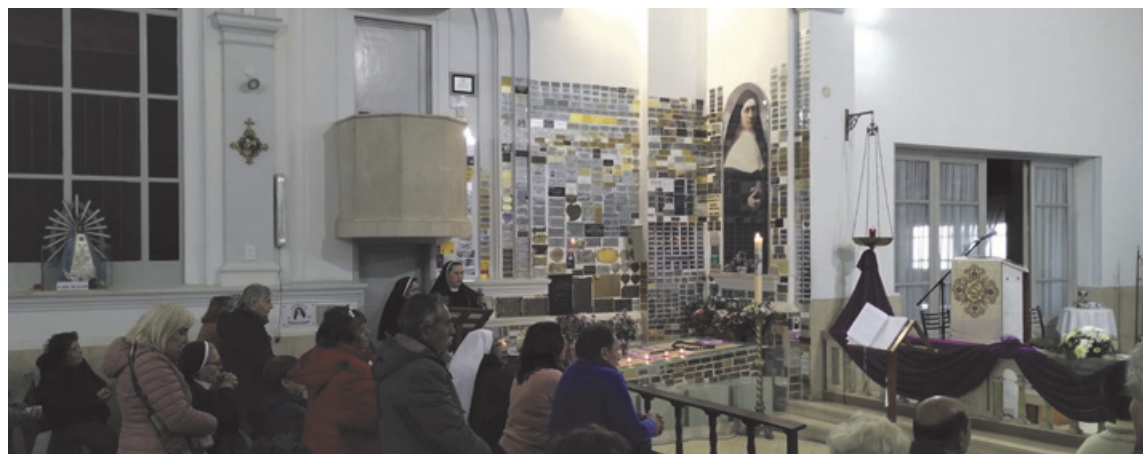
Cada día a las 18:00, en la capilla del Huerto, se celebra misa en el marco de la novena. (LA OPINION)

En el marco del tiempo de preparación en memoria de "Sor Dulzura" son varios los contingentes de fieles que están llegando a Pergamino desde otras localidades. Las celebraciones se desarrollarán a diario en la capilla del Colegio del Huerto.