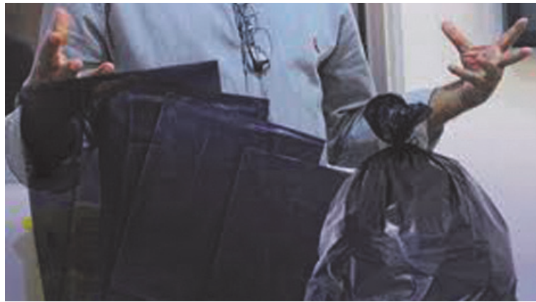
Importante advertencia a los vecinos para evitar estafas de este tipo.