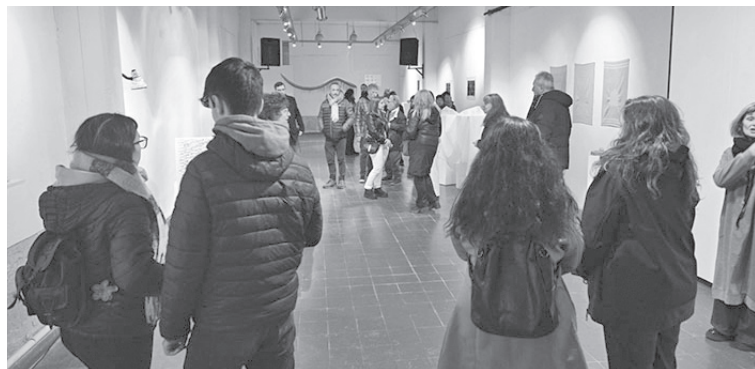
Las artistas rosarinas presentan en ArteMás una propuesta donde el textil se transforma en lenguaje artístico, memoria y reflexión colectiva.