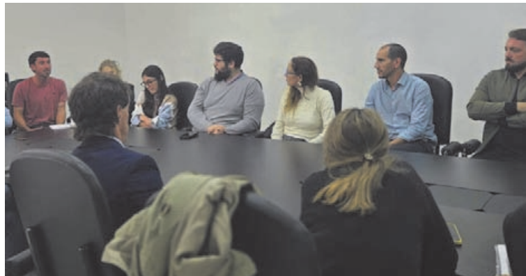
Los participantes coincidieron en la importancia de sostener un trabajo integrado. (PERGAMINO)

Con la premisa de generar respuestas más rápidas, coordinadas y efectivas frente a situaciones de violencia en el ámbito escolar, días atrás se desarrolló en Pergamino una reunión intersectorial que reunió a representantes de distintos organismos vinculados a educación, salud, justicia y asistencia social.