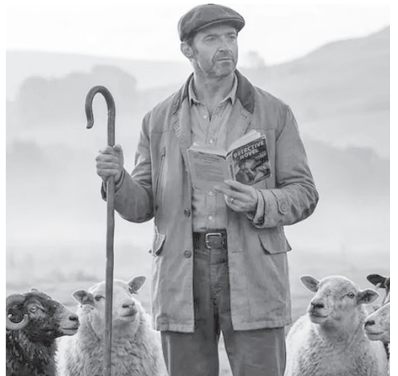
Las ovejas detectives , protagonizada por Hugh Jackman, una propuesta que combina humor, misterio y aventura familiar.

cula es Kyle Balda, con experiencia en la silla con cintas animadas como “ Minions ” (2015) y “ Mi villano favorito 3 ” (2017). Este es su primer live action con actores reales y los efectos de las ovejas están muy bien logrados.