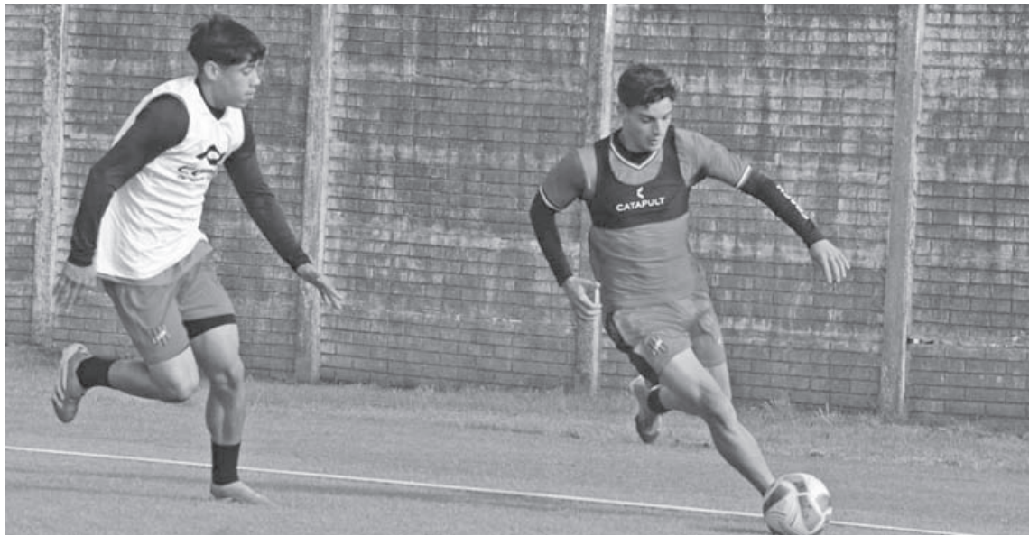
El plantel de Douglas Haig continúa ajustando detalles para visitar el domingo a 9 de Julio de Rafaela.