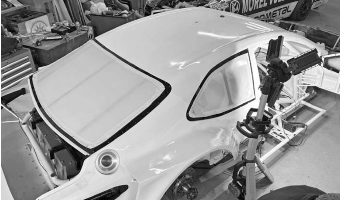
El Toyota Camry transita los últimos trabajos de armado antes de su presentación oficial.