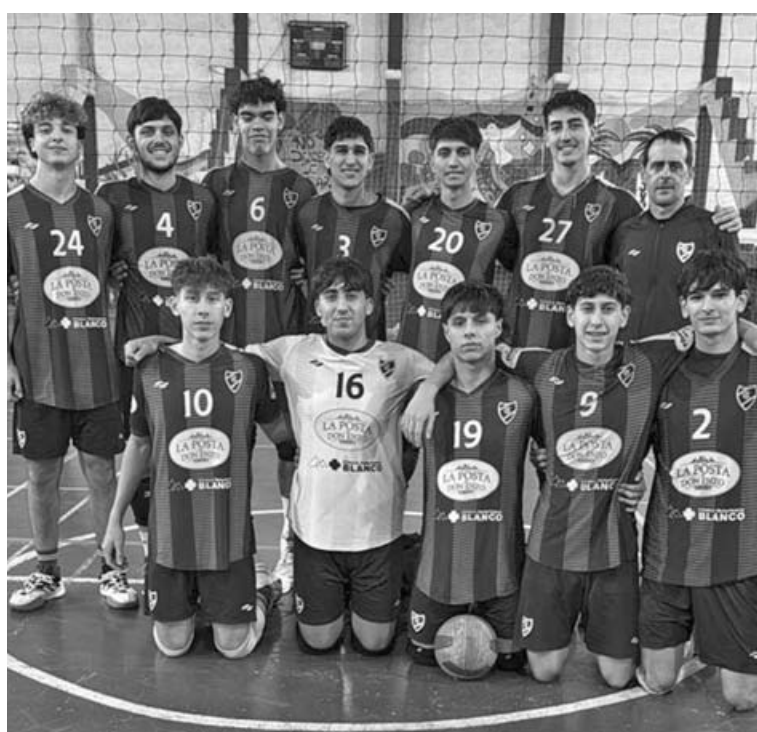
La Primera de Gimnasia y Esgrima también dijo presente en el primer weekend de la LiNoBo en Los Toldos. (APV)