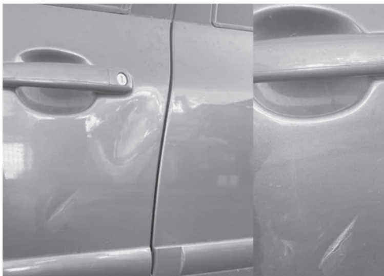
Las abolladuras en la carrocería fueron a la altura de la puerta de la conductora.

La maniobra generó una situación de extrema tensión y temor para la