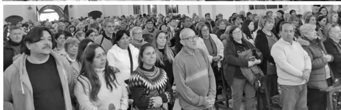
El color violeta que cubrió las calles no fue solamente un símbolo litúrgico. Fue también la expresión visible de una fe compartida.

En ese marco, explicó que el amor atraviesa diferentes etapas a lo largo de la vida. Primero, el ser humano aprende a recibir amor; luego, descubre la reciprocidad en la amistad y en la pareja; finalmente, madura cuando comprende que amar implica entregarse desinteresadamente.