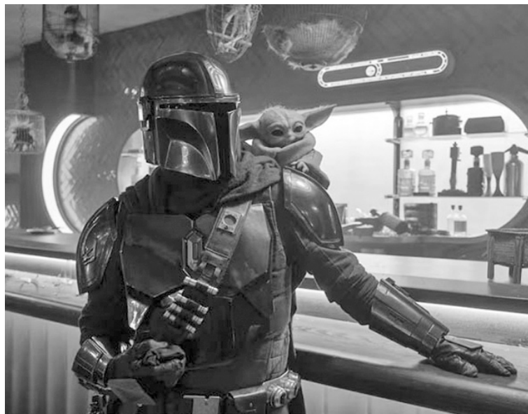
El universo de Star Wars: Mandalorian y Grogu llega a Cinema Pergamino.

El Mandaloriano y Grogu emprenden su misión más emocionante hasta la fecha en "The Mandalorian and Grogu", de Lucasfilm. El malvado Imperio ha caído, pero quedan señores de la guerra imperiales esparcidos por toda la galaxia. Entre tanto, la incipiente Nueva República se esfuerza por proteger todo aquello por lo que luchó la Rebelión, logrando la ayuda del legendario cazarecompensas mandaloriano Din Djarin (Pedro Pascal) y su joven aprendiz Grogu. Dirigida por Jon Favreau, también está protagonizada por la gran