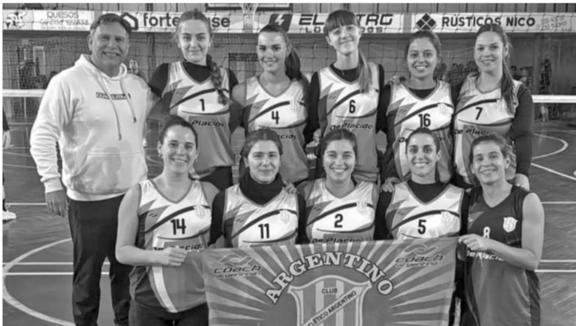
La Primera femenina de Argentino dejó una muy buena imagen en Los Toldos en el comienzo de la LiNoBo.

La APV (Asociación Pergaminense de Vóleybol) estuvo representada por las primeras divisiones de Argentino (femenino), Gimnasia y Esgrima (masculino) y Argentino de Alfonso (masculino). El saldo fue positivo para los conjuntos pergaminenses, especialmente para Argentino de Alfonso y Argentino de Pergamino, que lograron importantes triunfos en el inicio de la competencia.