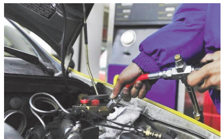
La presión del suministro es la necesaria para funcionar sin problemas. (LA OPINION)

Mientras tanto, en Pergamino el panorama continúa siendo favorable. Las estaciones de GNC funcionan normalmente, mantienen buena presión en el sistema y no presentan, al menos por ahora, señales de restricciones que afecten el servicio.