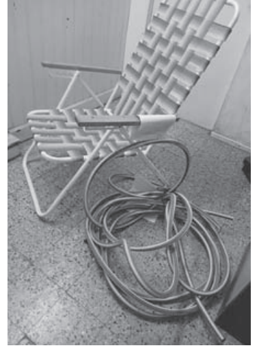
La reposera y la manguera que le secuestró la Policía a los menores.

Fuentes policiales indicaron que la intervención contó también con el apoyo de la Patrulla Municipal N° 29, a cargo de un inspector de la Secretaría de Seguridad comunal.