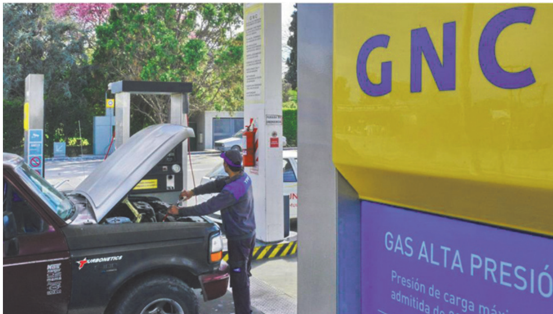
Las estaciones de GNC ubicadas en Pergamino están trabajando con normalidad hasta el momento y no hubo cambios en las últimas horas.

Las medidas adoptadas a nivel nacional afectan principalmente a empresas y estaciones de GNC que poseen contratos "in-