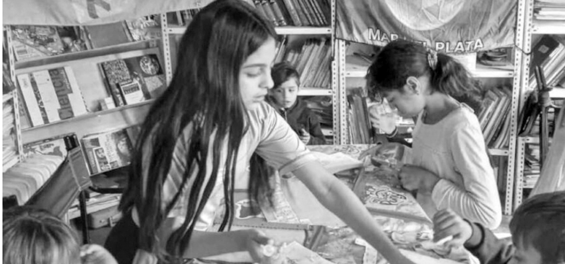
La implementación del programa en espacios comunitarios también refleja la intención de acercar oportunidades educativas a distintos barrios de Pergamino.

La situación en matemática es aún más desafiante: apenas el 14 por ciento de los estudiantes logra un nivel satisfactorio, mientras