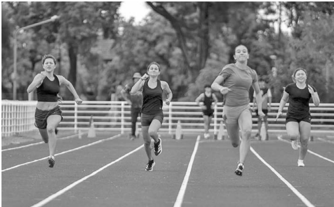
La pista de la Villa Deportiva del Parque Municipal será escenario del Torneo Ciudad de Pergamino. (AAP)

de velocidad y medio fondo, además de competencias de salto en largo y lanzamientos. Las actividades de pista comenzarán oficialmente a las 11:00 con los 50 metros para la categoría U8.