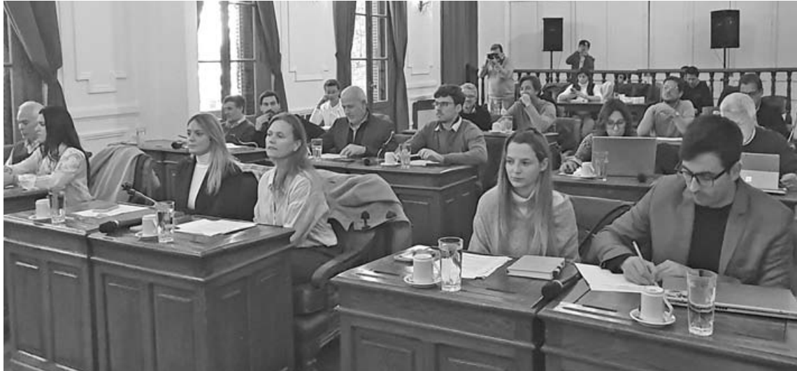
La votación representó uno de los puntos políticos más relevantes de la jornada legislativa.