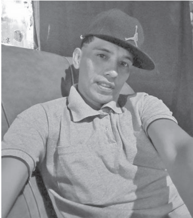
Una familia de comerciantes de la Lomita vivió un calvario por el hostigamiento de este sujeto.