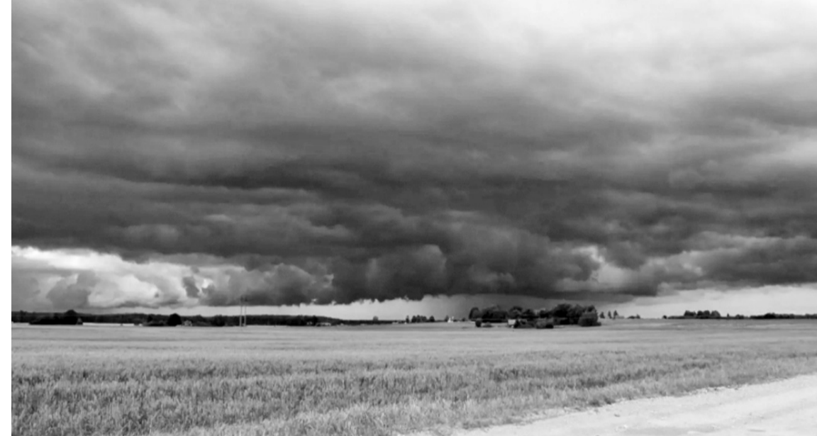
Según especialistas, El Niño tiene más del 80 % de probabilidades de establecerse durante el periodo junio-agosto.

norte de región Pampeana y Cuyo, donde son mayores las probabilidades de transitar un trimestre con precipitaciones normales a inferiores al promedio.