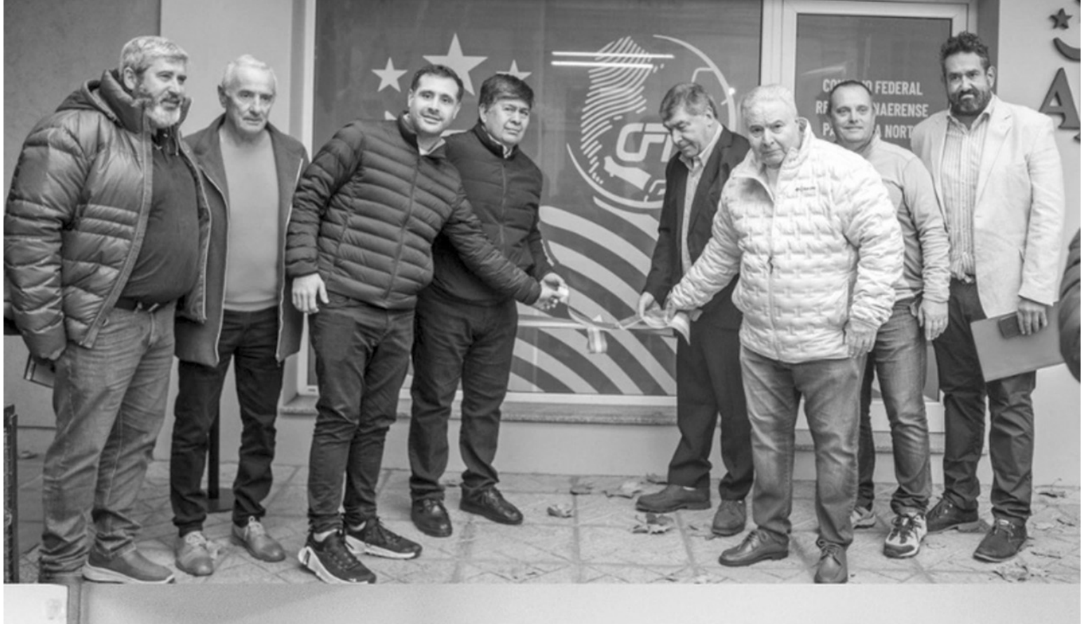
Desde el jueves funciona en Salto la Delegación del Consejo Federal para la Región Bonaerense Pampeana Norte, que agrupa a 31 Ligas.