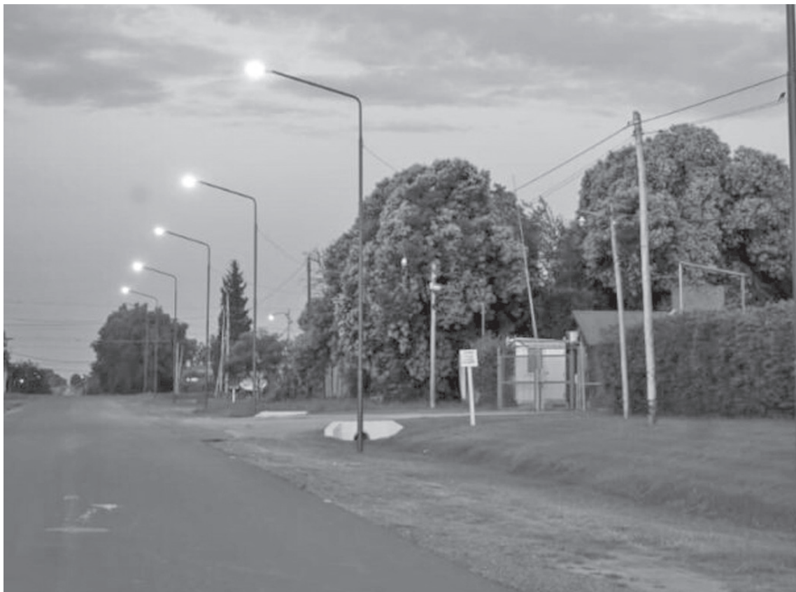
Importantes mejoras generará en las zonas intervenidas la colocación del nuevo sistema de iluminación LED.

Las tareas también se extenderán a otros sectores de la zona norte de Pergamino, donde se ejecutarán nuevas obras de