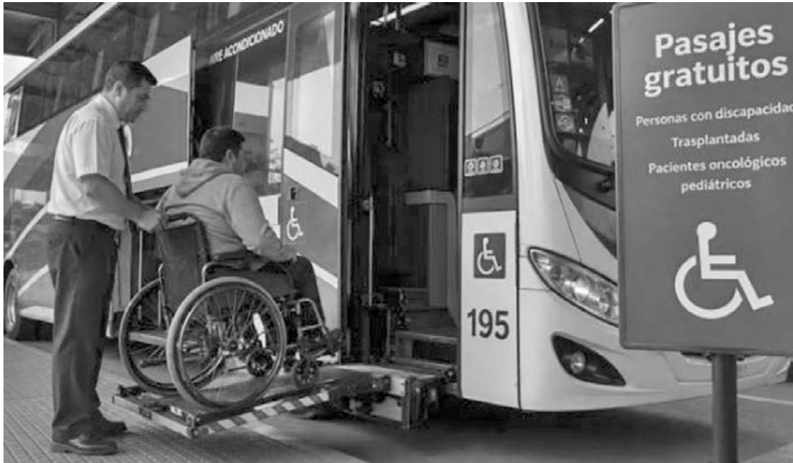
La Resolución 28/2026 también establece que la Comisión Nacional de Regulación del Transporte (CNRT) será la encargada de garantizar el efectivo cumplimiento de la emisión de pasajes gratuitos.

Es importante destacar que el derecho al pasaje gratuito sigue vigente por lo que las empresas continúan obligadas a otorgar los boletos sin cargo a personas con Certificado Único de Discapacidad (CUD) y a otros grupos protegidos por la normativa nacional.