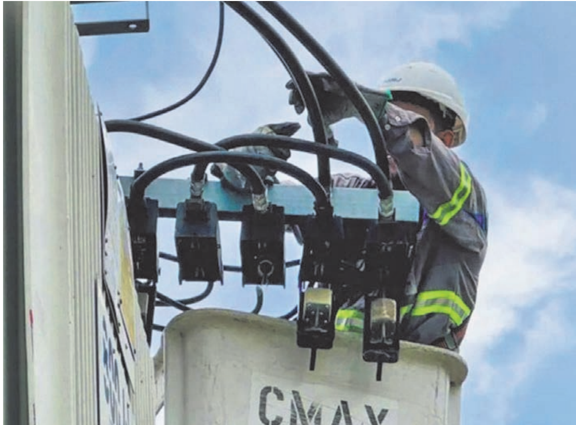
Los pergaminenses tendrán nuevas tarifas tanto en las boletas de luz como de gas dada esta autorización de la Provincia.

Los nuevos cuadros incorporan los precios estacionales de energía