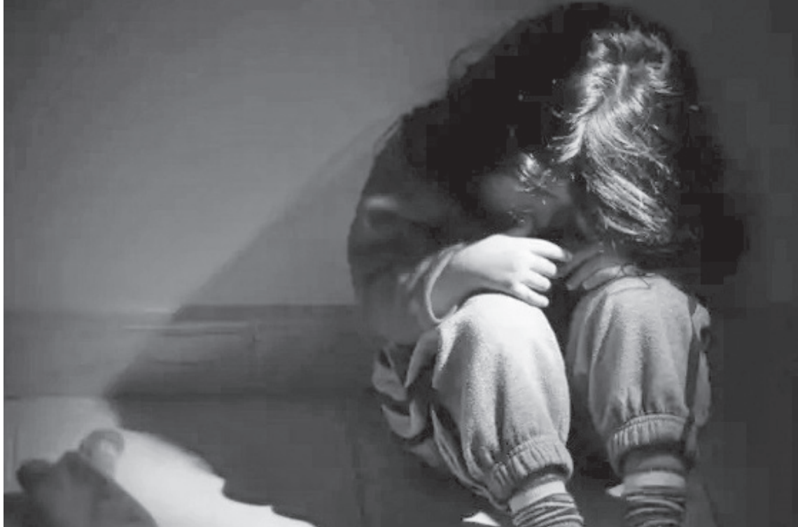
La niña señaló a un instructor de un Club de la ciudad.

La denuncia judicial no tardó en llegar. Uno de los momentos más críticos del proceso fue la declaración en Cámara Gesell. Para los padres, ese tiempo se sintió como una «eternidad», viendo a su hija de tres años narrar frente a una profesional desconocida el trauma padecido. Sin embargo, destacan la