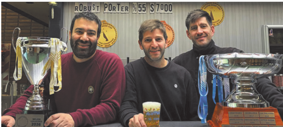
Los fundadores de Astor Birra celebran el doble reconocimiento obtenido en la Copa Argentina de Cervezas y la South Beer Cup.

Por su parte, la South Beer Cup es la primera competencia profesional