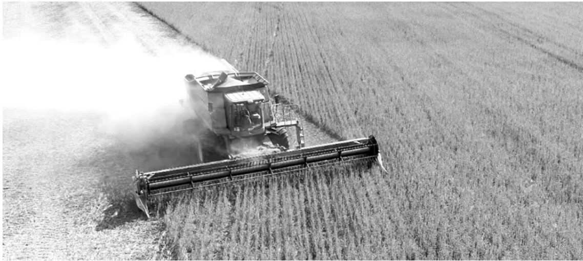
Al proyectarse la nueva perspectiva de siembra vuelve a poner en debate la sustentabilidad de los esquemas productivos.

La explicación principal pasa por los costos. Aunque desde el punto de vista climático se proyecta un ciclo favorable para los cereales, particularmente por la presencia de un evento “Niño” que podría aportar buenas lluvias desde la primavera, muchos productores comenzaron a inclinarse nuevamente por la soja debido a que demanda una inversión inicial considerablemente menor.