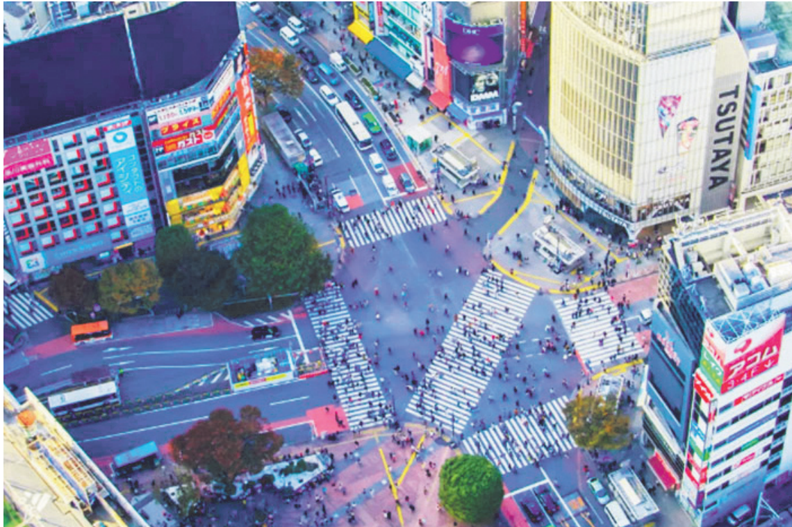
El Cruce de Shibuya, un clásico de Tokio. Japón combina hoy una serie de factores que explican por qué el destino se volvió más atractivo.

En 1995 viajaron al país asiático poco más de 4.000 argentinos. Treinta años después, la cifra superó los 33.000. El crecimiento, de más del 740%, no solo refleja una tendencia, sino una transformación profunda en la relación de los argentinos con el destino.