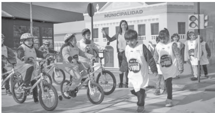
La participación de las familias ocupará un lugar central durante toda la jornada.

La propuesta contará con dos grandes ejes. Por un lado, una capacitación teórico-práctica destinada a profesores de Educación Física y, por otro, talleres especialmente diseñados para niños