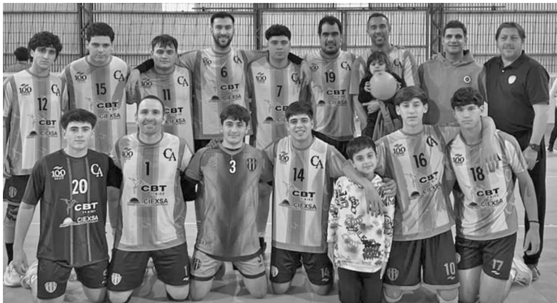
Paso firme. Argentino de Alfonso derrotó a Belgrano de San Nicolás y a Pescadores de San Pedro.