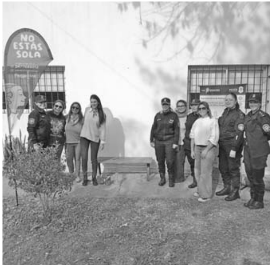
En Urquiza, los estudiantes de la escuela intervinieron un banco en el marco de Ni una Menos. También participaron de una charla.

Desde la Dirección remarcan la importancia de trabajar en territorio, escuchando de primera mano las necesidades, inquietudes y problemáticas que atraviesan las mujeres de cada barrio y localidad. La propuesta apunta no sólo a intervenir ante situaciones de violencia ya existentes, sino también a promover la prevención, la difusión de derechos y la construcción de redes comunitarias de apoyo.