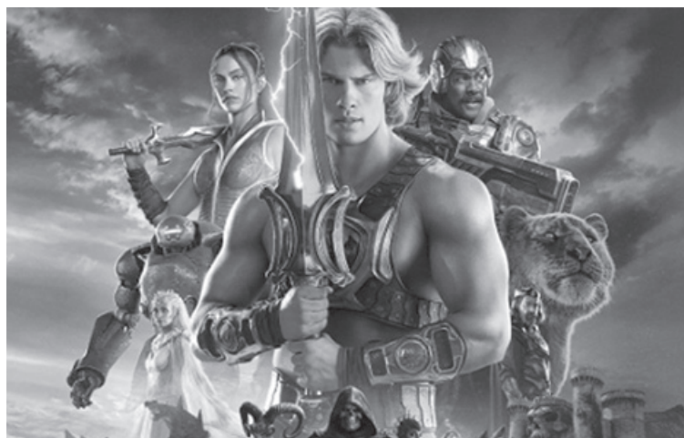
Nicholas Galitzine y Jared Leto encabezan el elenco de la nueva versión de Amos del Universo, que se estrena este viernes en Cinema Pergamino.

El papel de Adam y su alter ego He-Man estará a cargo del actor británico Nicholas Galitzine, mientras que el temible Skeletor será interpretado por Jared Leto. El reparto también incluye a reconocidas figuras de Hollywood como Idris Elba, quien dará vida a Duncan (Man-At-Arms), Camila