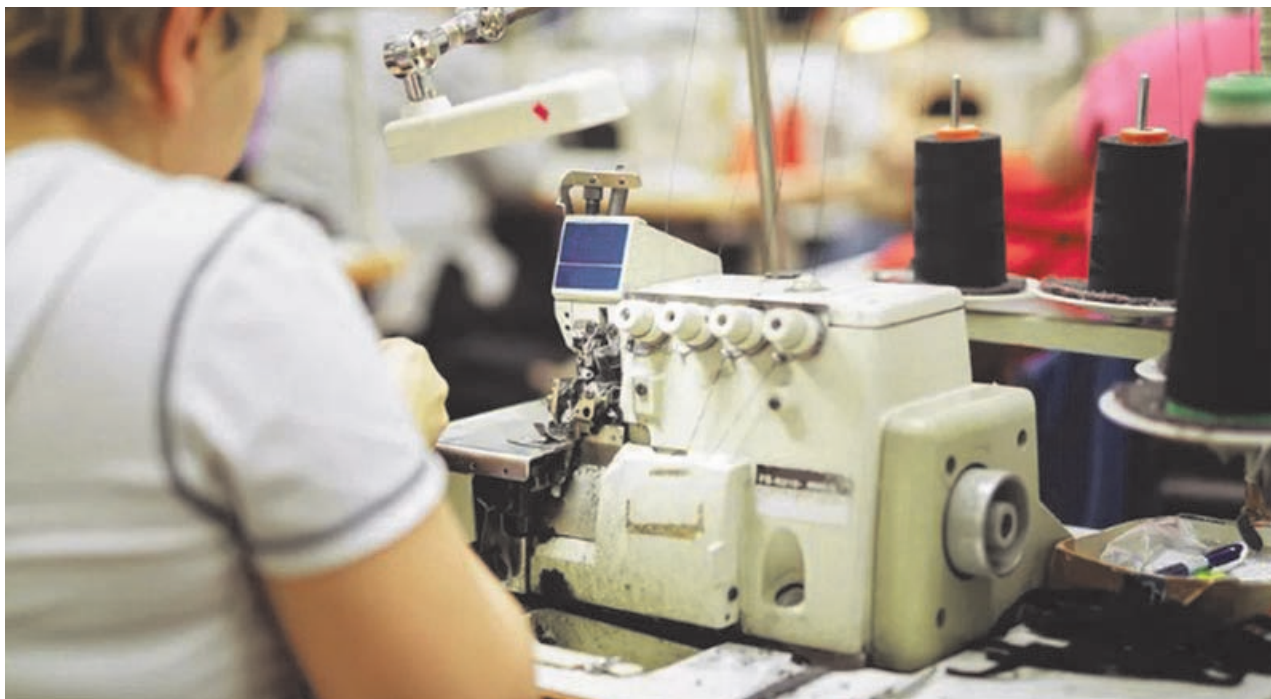
La industria del vestido está atravesando uno de los peores momentos de la historia en Pergamino y la región.

La caída del consumo, la acumulación de stock, las dificultades para trasladar costos a los precios finales y la incertidumbre económica conforman un escenario que preocupa a empresarios y comerciantes pergaminenses de un rubro históricamente ligado al movimiento de la economía local. PAGINA 8