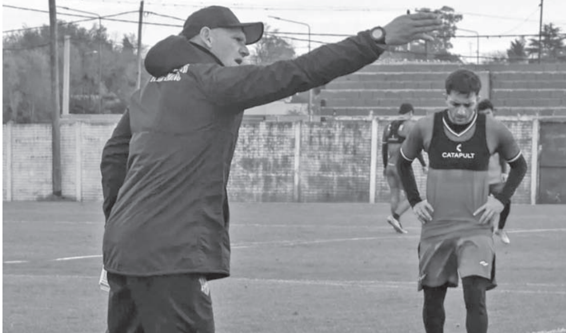
Douglas Haig completará hoy y mañana los últimos entrenamientos antes de visitar a Defensores.

La caída ante 9 de Julio de Rafael (2 a 0) a y la posterior derrota frente a Gimnasia de Chivilcoy (también por 2 a 0)