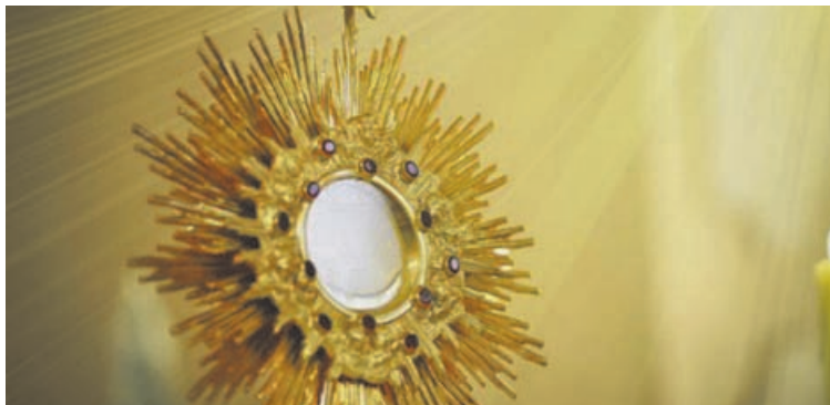
La solemnidad de Corpus Christi invita a detenerse, agradecer y renovar la confianza en la presencia de Dios en la vida de cada persona. (NOTICIAS RNN)

Una fiesta que pone a la Eucaristía en el centro Corpus Christi significa lite-