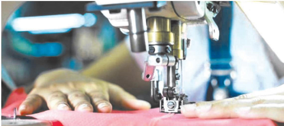
Las perspectivas para los próximos meses tampoco resultan alentadoras para este sector de la industria local.

Según el informe del sector, el 59 por ciento de las empresas