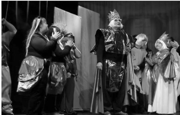
Este domingo vuelve a escena en Espacio GAE la obra Doctor Streamer, una versión libre de Médico a palos. (ESPACIO GAE)

Almafuerte 160, viernes y sábado a las 21:00. Anticipadas para ambas noche a $6000. Reservas